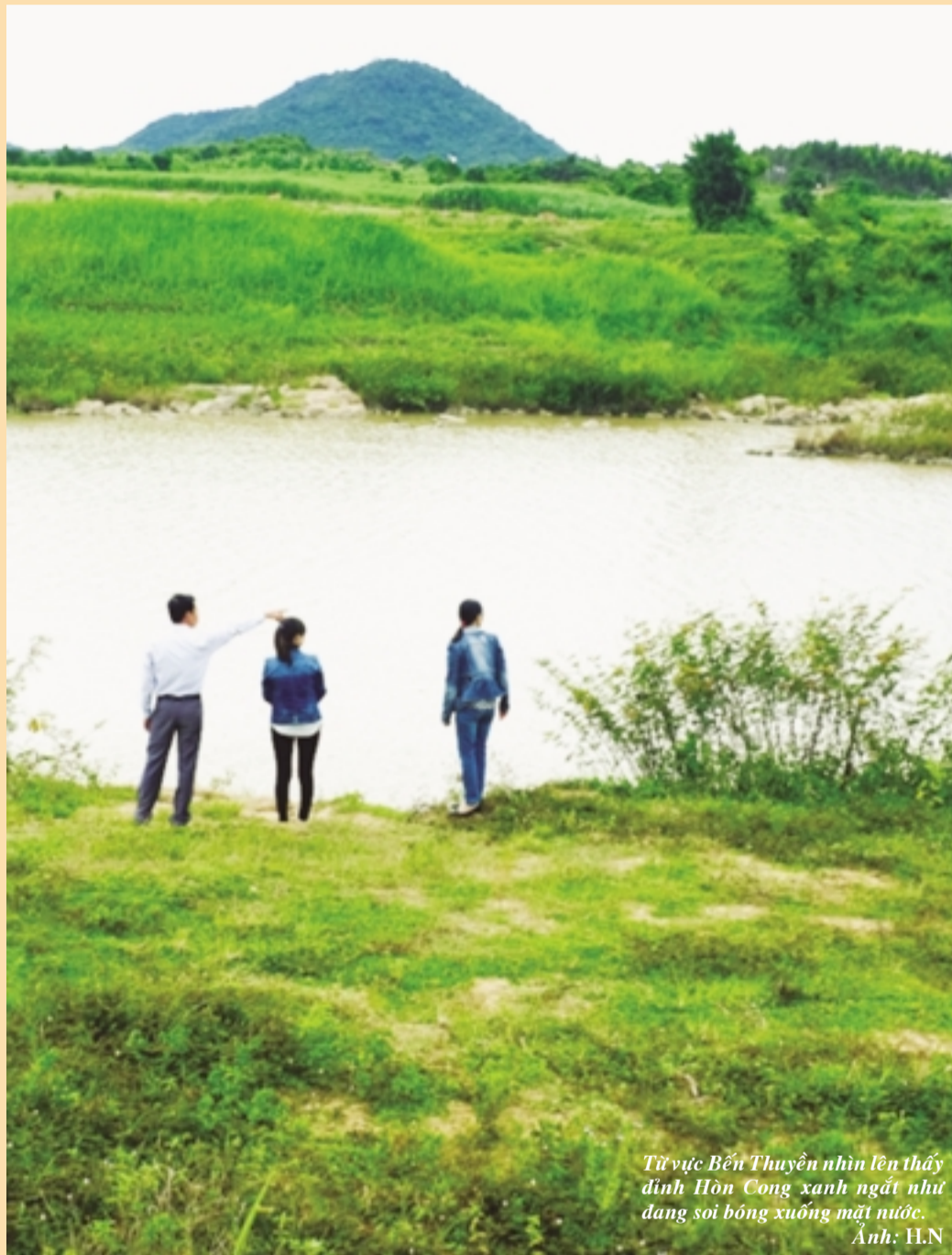
Từ vực Bến Thuyền nhìn lên thấy đỉnh Hòn Cong xanh ngắt như đang soi bóng xuống mặt nước.

Dưới thời Tây Sơn, cây trầm hương được bảo vệ nghiêm mật vì người Thượng coi đây là cây thần. Thuở ấy, người Thượng ở vùng An Khê đều một lòng theo anh em Tây Sơn. Đến khi vương triều Tây Sơn diệt vong, quan nhà Nguyễn sai quân lính phải đốn hạ bằng được cây trầm hương, nhưng khi quân lính vừa kéo lên núi thì trời bỗng nổi mưa to gió lớn. Cây trầm hương tróc gốc bay cả thân lẫn gốc rễ xuống vực sông Ba rồi từ từ chìm xuống đáy.