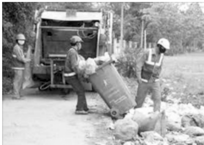
Ảnh minh họa.