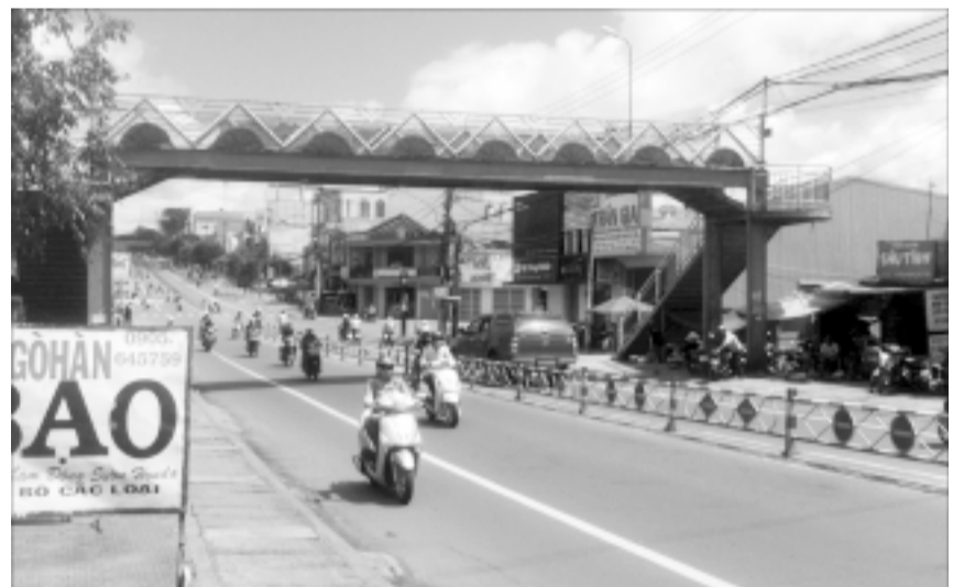
Cầu vượt ngã ba Hùng Vương-Nguyễn Viết Xuân.

Các cầu vượt kể trên đều làm bằng sắt, trị giá mỗi chiếc lên đến mấy trăm triệu đồng nhưng hiện tại trừ chiếc cầu vượt trên đường Phạm Văn Đồng còn có học sinh sử dụng để qua đường, hai cây cầu còn lại trên đường Hùng Vương hoàn toàn không có người đi. Chân và thành cầu đã lâu không sơn nên nhiều chỗ bị gỉ sét, nhiều người dân tận dụng chân cầu làm chỗ đổ rác, thành cầu thì phơi chăn và quần áo, nhìn thật phản cảm.