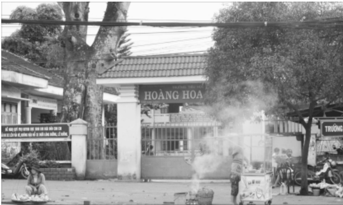
Nhiều gánh hàng rong bày bán la liệt trước cổng Trường Tiểu học Hoàng Hoa Thám (TP. Pleiku).