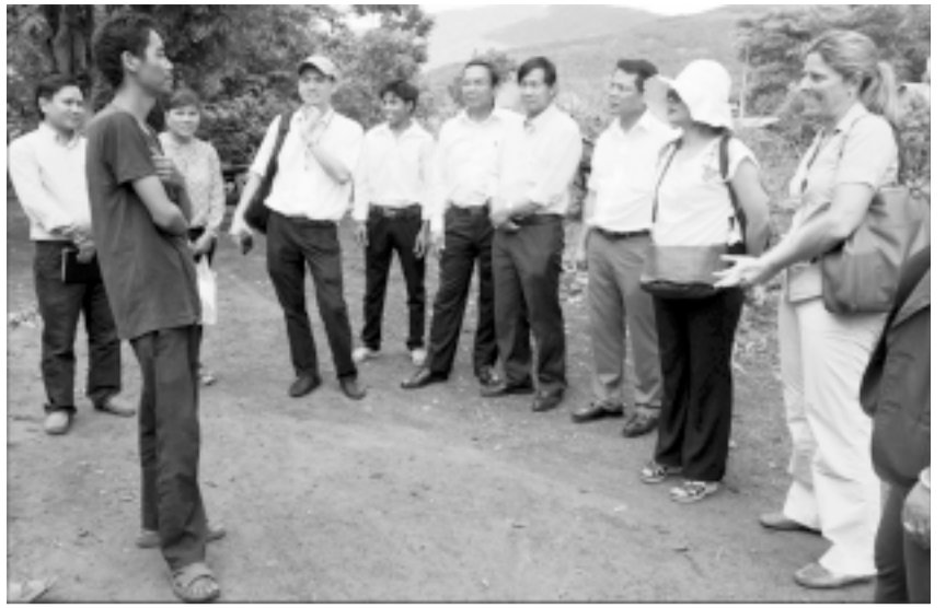
Ban Điều phối dự án giảm nghèo khu vực Tây Nguyên khảo sát tại làng Đak Hlă, xã Lơ Pang (huyện Mang Yang).

Gia Lai là một trong những địa phương được chọn để triển khai thực hiện dự án giảm nghèo khu vực Tây Nguyên (giai đoạn 2014-2019) với tổng nguồn vốn đầu tư lên đến gần 29 triệu USD. Mục tiêu của dự án là nâng cao mức sống thông qua cơ hội cải thiện sinh kế ở các xã nghèo trong vùng dự án. Theo đánh giá của các chuyên gia, dự án này có nhiều điểm tích cực hơn so với các dự án cùng tính chất.