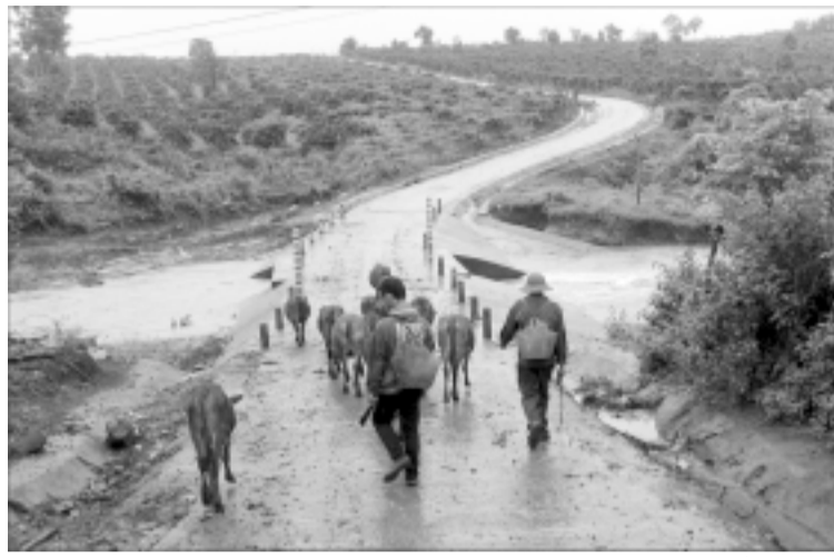
Con đường làng Pó đang làm cho cuộc sống nơi đây thay da đổi thịt.