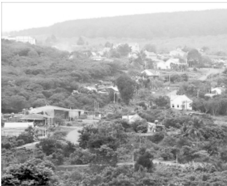
Trung tâm xã Ia Krai.

cầu, hàng trăm con rết lớn và cuốn chiếu bò lên bám dày hai bên thành cầu.