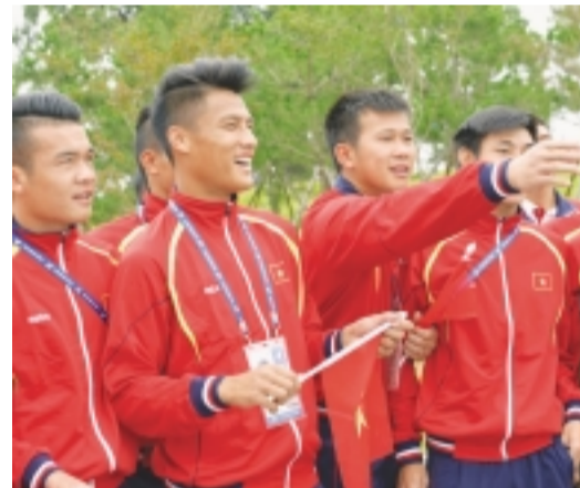
Niềm vui các cầu thủ Olympic Việt Nam.