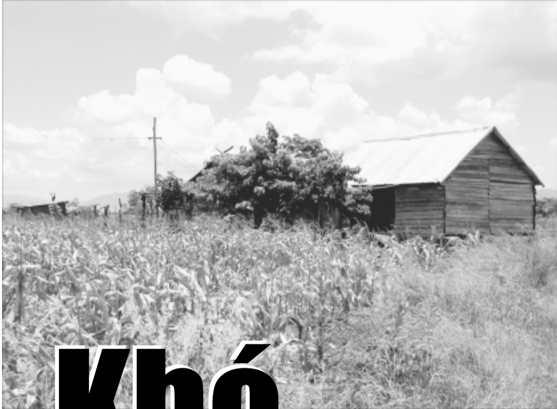
Những ngôi nhà của dân di cư tự do dựng tạm bợ trên nương rẫy của mình.