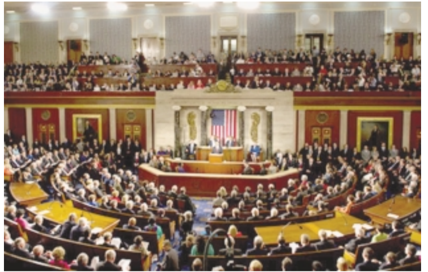
Hạ viện Mỹ vẫn còn nhiều ý kiến trái chiều về kế hoạch tiêu diệt IS của Tổng thống Obama.

Trước đó, Chủ tịch Hạ viện John Boehner cũng đặt câu hỏi về kế hoạch dài hạn của Mỹ trong chiến dịch săn lùng IS. "Nếu mục tiêu của chúng ta là tiêu diệt IS, chúng ta phải làm nhiều hơn là đào tạo vài người ở