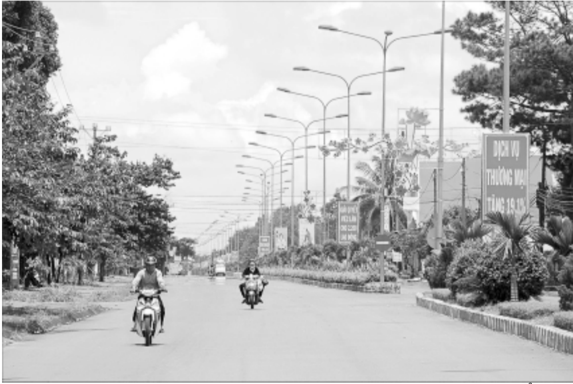
Thị trấn Ia Kha, huyện Ia Grai.