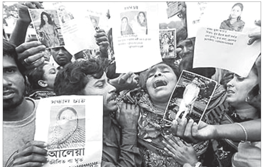
Người dân Bangladesh biểu tình mang theo ảnh người thân thiệt mạng trong vụ sập nhà.

Chính phủ Bangladesh phải đối mặt với áp lực nước ngoài ngày càng