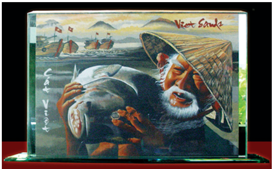
Một tác phẩm tâm đắc của nghệ nhân Ý Lan.