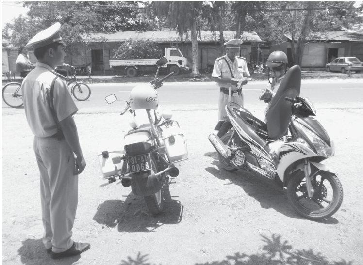
Lực lượng Cảnh sát Giao thông Công an huyện Phú Thiện đang làm nhiệm vụ tuần tra kiểm soát trên tuyến quốc lộ 25.

Từ đầu năm đến nay, trên địa bàn huyện Phú Thiện xảy ra 9 vụ tai nạn giao thông (TNGT), 7 vụ va chạm giao thông làm 10 người thiệt mạng, 21 người bị thương. Điều đáng nói là hầu hết các vụ tai nạn và va chạm giao thông đều xuất phát từ ý thức của người tham gia giao thông.