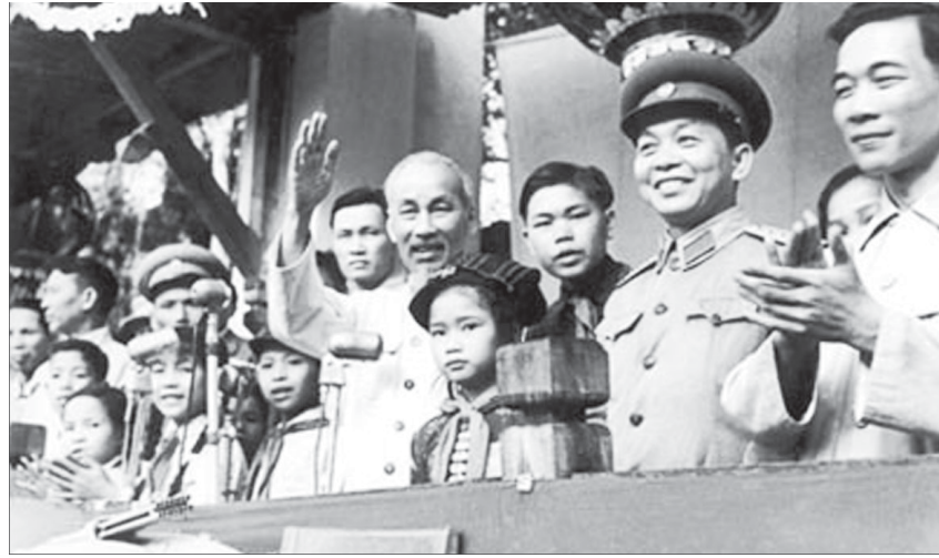
Bác Hồ thăm đồng bào Tây Bắc tháng 5-1959.

Ngày 25-12-1952, Bác gửi thư cho bộ đội, dân công ở mặt trận Tây Bắc, Bác khen ngợi bộ đội, dân công đã thắng trận,