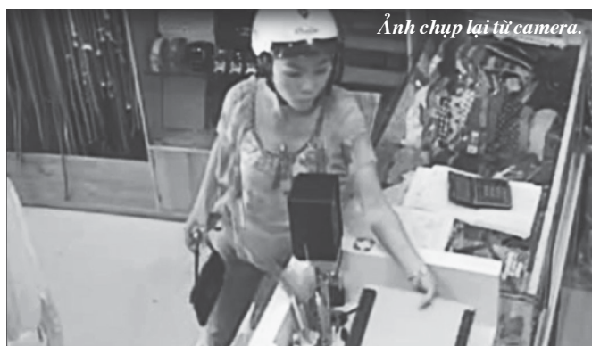
Ảnh chụp lại từ camera.