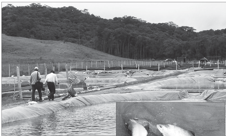
Một cơ sở nuôi cá nước lạnh ở Đạ Chais (Lạc Dương, Lâm Đồng).

Tại Hội nghị của Hiệp hội Phát triển cá nước lạnh được tổ chức vào cuối tháng 4 vừa qua tại Đà Lạt (Lâm Đồng), nhiều đại biểu đã đề nghị cơ quan chức năng của Việt Nam cần ngăn chặn ngay lập tức nạn nhập cá nước lạnh (nhất là cá tầm) từ nước ngoài vào Việt Nam, đặc biệt là nhập lậu qua đường hàng không. Cụ thể hơn, nhiều đại biểu cho rằng tình trạng nhập cá tầm lậu từ Trung Quốc sang và bán dưới nhãn mác “cá tầm Đà Lạt”, “cá tầm Sa Pa” đã đến lúc báo động.