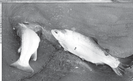
Cá nước lạnh Đà Lạt đang bị cạnh tranh khốc liệt bởi mặt hàng cùng loại nhập lậu.

vào Việt Nam được bán với giá thấp hơn nhiều so với giá trong nước. Hiện tại, trên thị trường Đà Lạt, cá tầm đến tay người tiêu dùng chỉ nằm khoảng 180.000 đồng/kg, thấp hơn từ 350.000 đồng đến 400.000 đồng so với cách nay 5 năm. Một doanh nghiệp kinh doanh cá tầm ở Lâm Đồng đặt vấn đề: “Cá nước lạnh Đà Lạt xuống giá mạnh hoàn toàn không vì phẩm cấp hay vì đây là thứ thực phẩm đã trở nên nhàm chán mà là vì sự cạnh tranh khốc liệt của mặt hàng cùng loại từ nước ngoài nhập lậu về. Tại TP. Hồ Chí Minh và Hà Nội, cá tầm nhập lậu đội lốt cá tầm Đà Lạt, cá tầm Sa Pa được tiêu thụ gần như công khai. Còn tại Đà Lạt, mặc dù chưa có cơ quan nào khẳng định trên thị trường có cá tầm Trung Quốc được tiêu thụ nhưng cũng không ai dám chắc rằng 100% thực phẩm cá nước lạnh đang tiêu thụ trên địa bàn thành phố này hoàn toàn là cá của Lâm Đồng”.