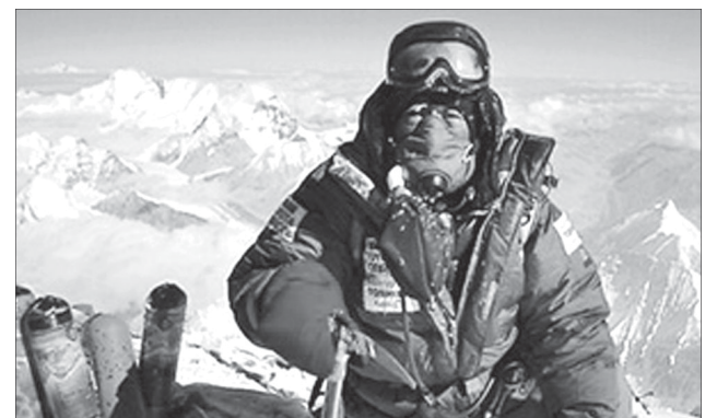
Đến nay đã có hơn 3.000 người thành công leo lên đỉnh Everest và các kỷ lục liên tiếp bị phá bỏ. Mùa leo núi năm nay mang ý nghĩa đặc biệt, đánh dấu 60 năm lần đầu tiên “nóc nhà thế giới” được con người chinh phục.

Cách đây 5 năm, cụ Min Bahadur Sherchan ở độ tuổi 76 đã vượt qua đối thủ là cụ Yuichiro Miura-người Nhật Bản. Năm đó, cụ Minra ở độ tuổi 75 cũng chinh phục thành công Everest nhưng “trẻ” hơn 1 tuổi so với cụ Sherchan. Năm nay, cụ Sherchan dự định sẽ phá kỷ lục của chính mình và điều thú vị là đối thủ Minra, giờ đã 80 tuổi, cũng đã lên đường chinh phục lại đỉnh núi cao 8.848 mét này.