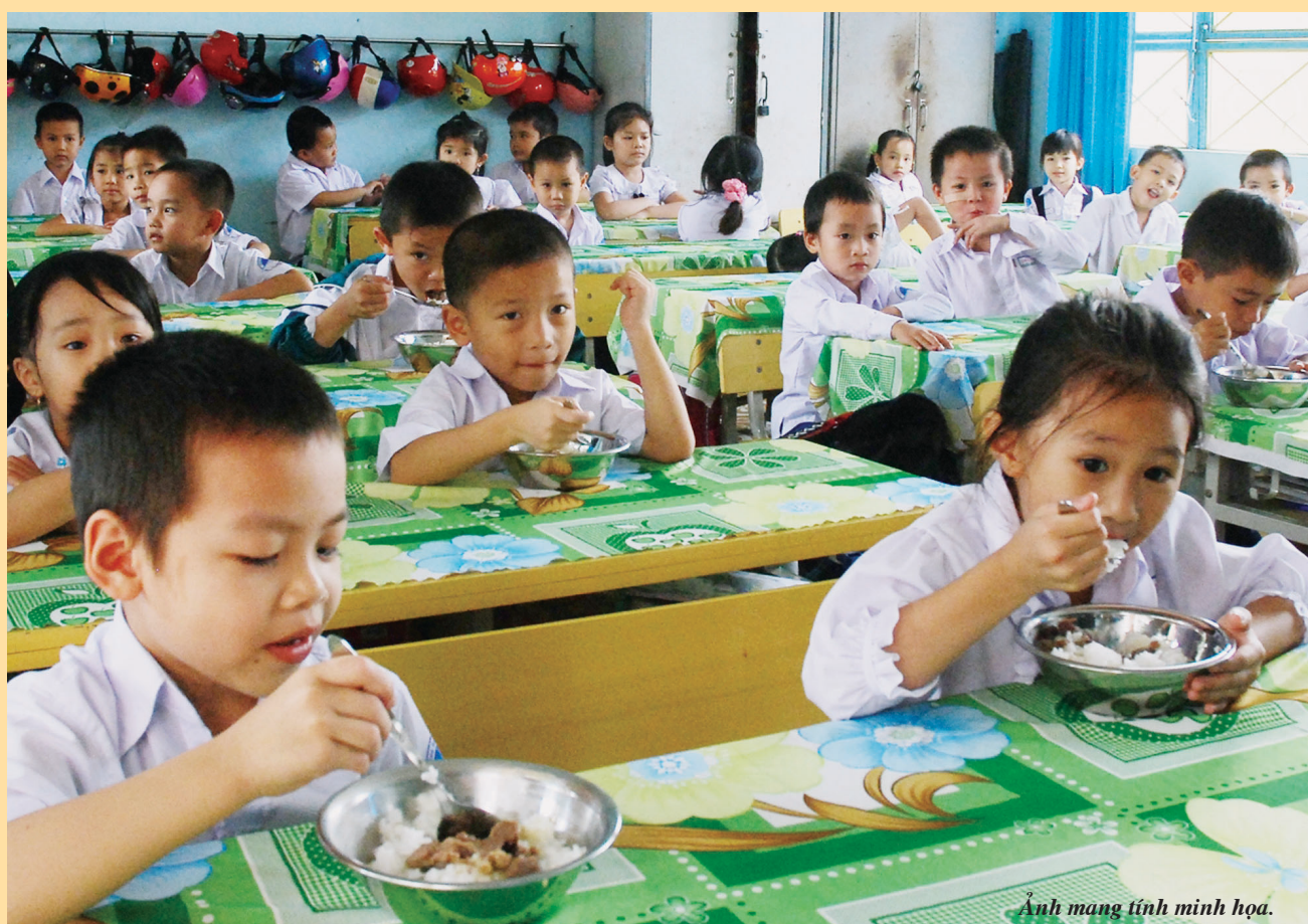
Ảnh mang tính minh họa.