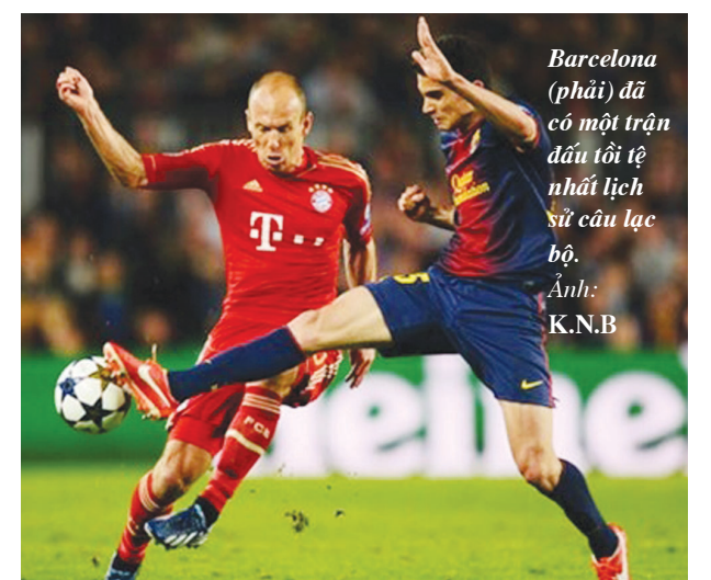
Barcelona (phải) đã có một trận đấu tồi tệ nhất lịch sử câu lạc bộ.