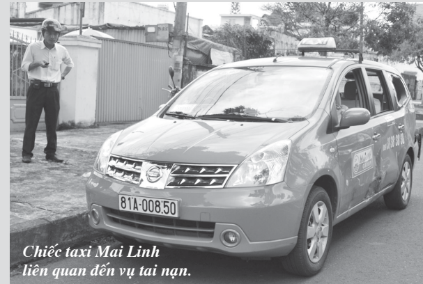
Chiếc taxi Mai Linh liên quan đến vụ tai nạn.