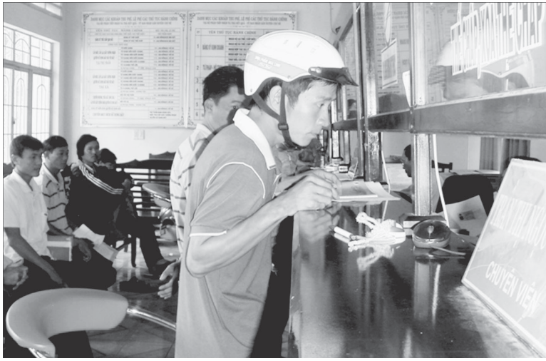
Bộ phận “một cửa điện tử” ở huyện Chư Sê.