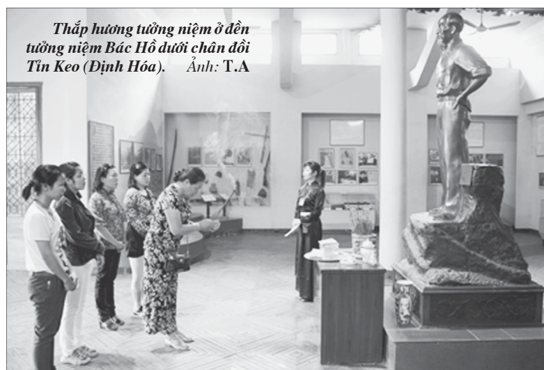
Thắp hương tưởng niệm ở đền tưởng niệm Bác Hồ dưới chân đồi Tỉn Keo (Định Hóa).

Nói rồi, cô dẫn chúng tôi lên lán Tỉn Keo. Căn lán nhỏ đơn sơ nằm giữa lưng chừng đồi. Bên cạnh cây hoa râm bụt Bác trồng năm nào, giờ cành lá