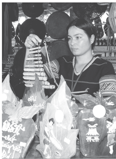
Hàng mỹ nghệ của HTX Linh H'Nga Chư Sê.