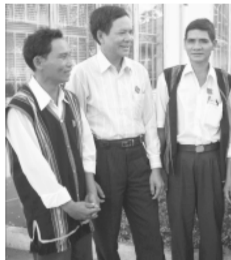
Một số đảng viên người dân tộc thiểu số của huyện Chư Sê.

Hàng năm, Ban Tổ chức Huyện ủy đã tham mưu cho Ban Chấp hành và Ban Thường vụ Huyện ủy giao chỉ tiêu, nhiệm vụ phát triển ĐV, xây dựng chi bộ thôn làng có đủ ĐV tại chỗ cho các tổ chức cơ sở đảng hệ thống chính trị triển khai thực hiện. Đồng thời, phân công nhiệm vụ cho thành viên Ban Chỉ đạo 04 của huyện phụ trách các tổ chức cơ sở đảng xã, thị trấn, các doanh nghiệp. Ban Tổ chức Huyện ủy phối hợp với các ban xây dựng Đảng khảo sát đánh giá thực trạng đội ngũ cán bộ, ĐV và nguồn bổ sung đối tượng Đảng, làm cơ sở để chỉ đạo công tác tạo nguồn và phát triển ĐV trong toàn Đảng bộ huyện.