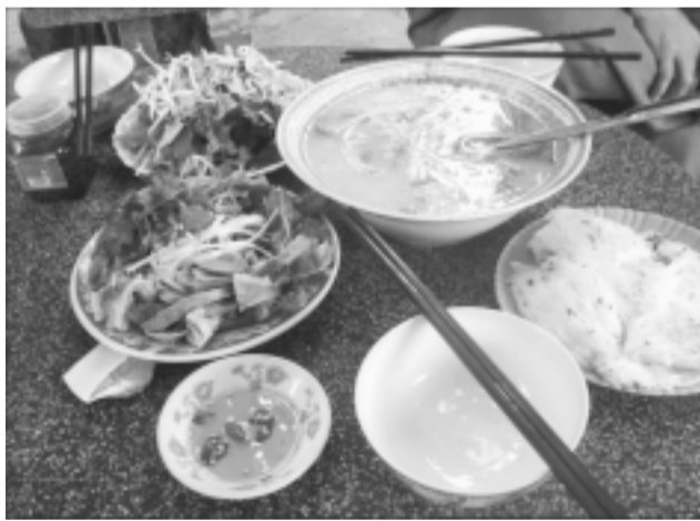
Món cháo-bánh hỏi-lòng heo ở Phù Cát.

Lần nào về quê, tôi cũng được thưởng thức món bánh hỏi-lòng heo buổi sáng rất tuyệt vời, rất đặc trưng. Gọi đó là món ăn dân dã là hoàn toàn đúng, bởi với dân quê, món bánh hỏi khá phổ biến vì giá rẻ, hợp với túi tiền nghèo. Nhưng nếu gọi đó là món ăn sang trọng thì xem ra cũng không sai, bởi bây giờ, món ẩm thực bánh hỏi-lòng heo đã có mặt ở rất nhiều khách sạn lớn (nhưng giá cũng rất vừa phải).