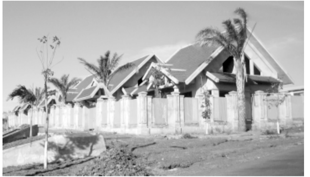
Một dự án bất động sản đang trong tình trạng im lìm.