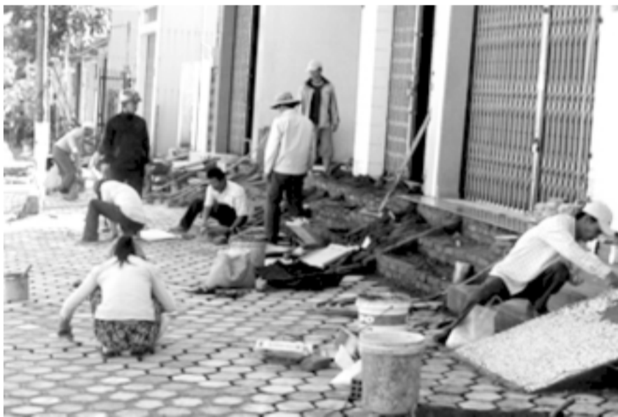
Người dân tự làm vỉa hè trước nhà mình.