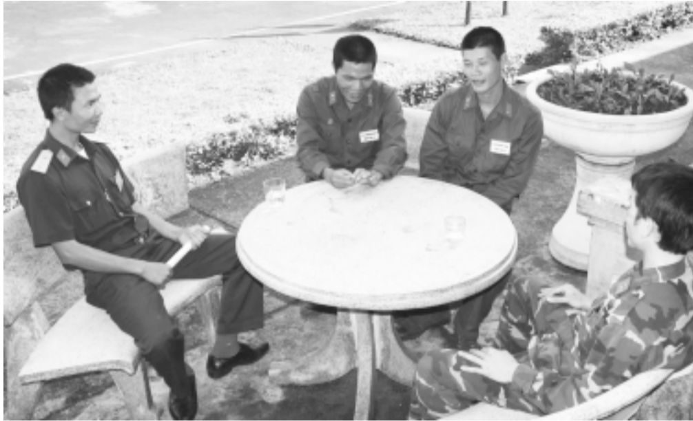
Chỉ huy Lữ đoàn trò chuyện cùng các tân binh.

mỗi bài huấn luyện sẽ cao hơn. Bên cạnh đó để các chiến sĩ mới hiểu về truyền thống của đơn vị vinh dự được 2 lần Bác Hồ về thăm, chúng tôi đã xây dựng những bảng ảnh, những tư liệu để các chiến sĩ mới hiểu được truyền thống đơn vị, tự hào vì mình được biên chế trong một đơn vị có bề dày truyền thống.