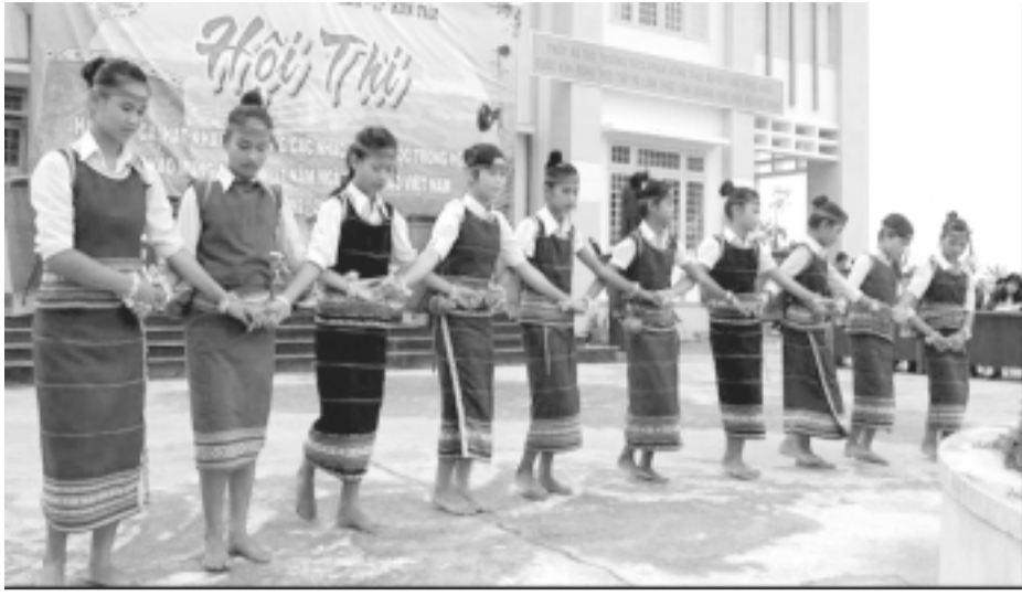
Một tiết mục của Hội thi hát dân ca.