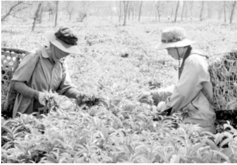
Áp dụng quy trình VietGAP cho sản phẩm chè Bàu Cạn.