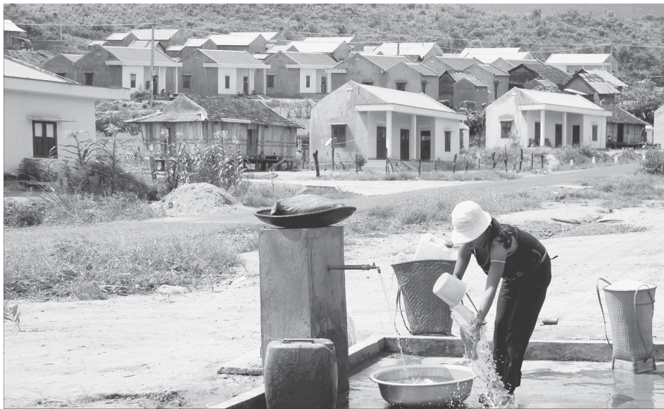
Làng mới.

Từ lời kêu gọi của Bác, suốt 65 năm qua, những phong trào thi đua yêu nước đã đẩy lên sôi động và đi vào trang sử cách mạng. Các phong trào thi đua yêu nước