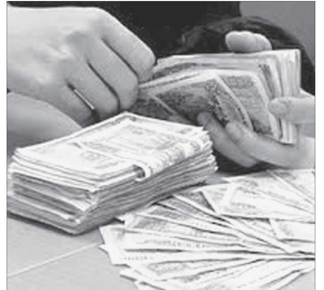
Ảnh minh họa.