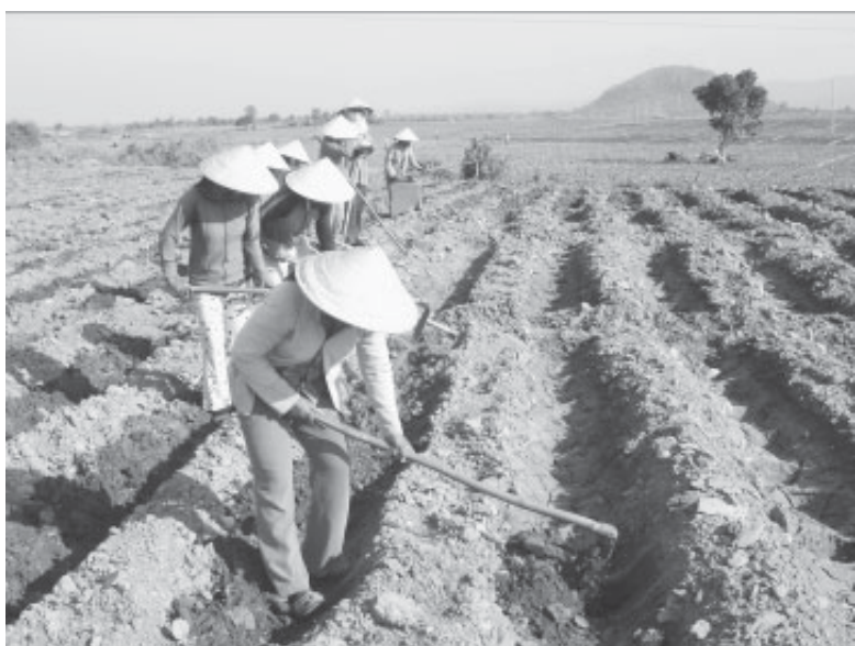
Nông dân sản xuất vụ mùa.