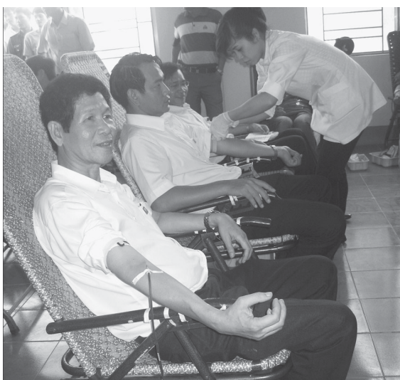
Đông đảo đoàn viên thanh niên, cán bộ, công nhân viên chức và chiến sĩ lực lượng vũ trang ở thị xã Ayun Pa tình nguyện tham gia hiến máu.

Sáng 7-6, hơn 250 đoàn viên thanh niên, người lao động và cán bộ chiến sĩ lực lượng vũ trang ở thị xã Ayun Pa đã tình nguyện tham gia buổi hiến máu nhân đạo tổ chức tại trụ sở Ủy ban MTTQ thị xã.