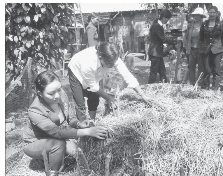
Cán bộ Hội hướng dẫn hội viên trồng nấm.

Có thể thấy, 5 năm qua, phong trào phụ nữ làm kinh tế giỏi đã thúc đẩy, khuyến khích hội viên phụ nữ nỗ lực phấn đấu, vươn lên làm giàu, góp phần quan trọng vào phát triển kinh tế ở địa phương và khẳng định vai trò, vị trí của mình trong xã hội.