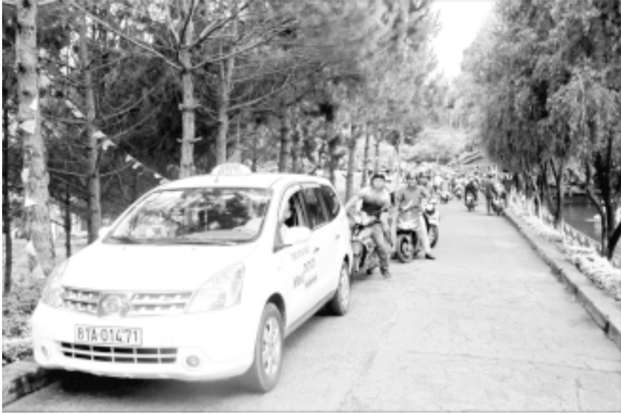
Công viên Diên Hồng tấp nập ngày nghỉ lễ 2-9.