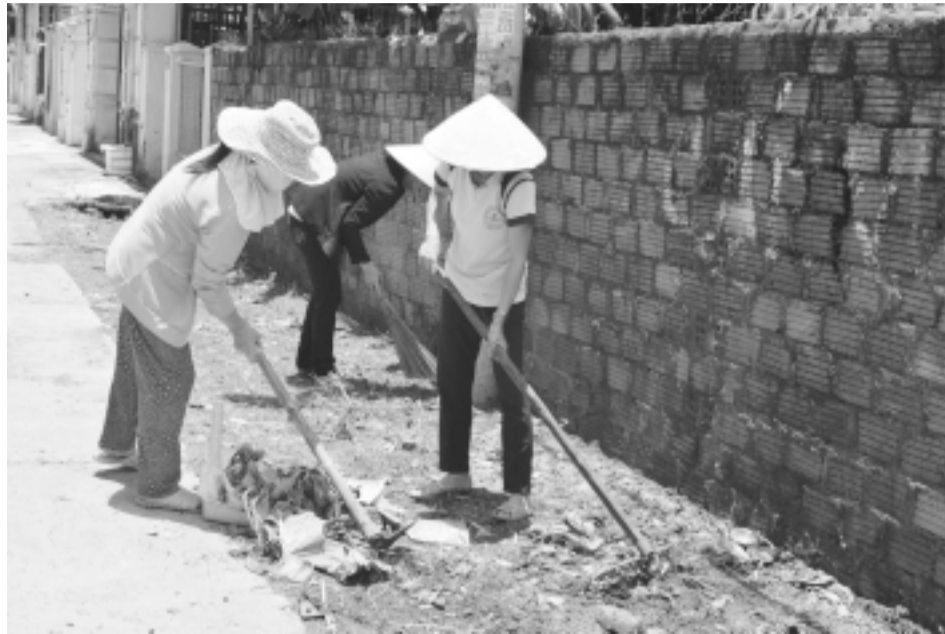
Chị em tích cực thực hiện mô hình “Con đường phụ nữ tự quản”.

Cùng sáng thứ bảy ngày 23-8, tại những “Con đường phụ nữ tự quản”, ở tổ