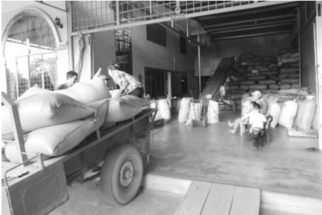
Thời gian qua ở các tỉnh Tây Nguyên đang nở rộ “nghề” tạm trữ cà phê.