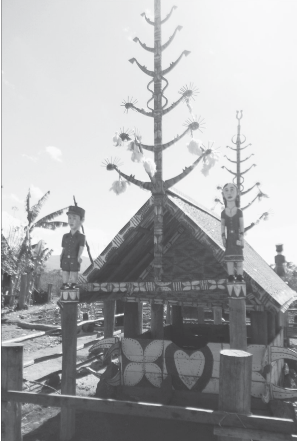
Khu nhà mồ ở làng Byang (thị trấn Kông Chro).

Kông Chro là một trong những địa phương còn bảo lưu được nhiều giá trị văn hóa truyền thống bản địa. Toàn tỉnh hiện có khoảng 6.000 bộ công chiêng thì riêng ở huyện này có tới 560 bộ, trong đó 150 bộ chiêng cổ-mỗi bộ có thể đối tới cả chục con trâu trắng, khỏe. Làng nào cũng còn lưu giữ 3-5 bộ công chiêng và đều được đưa vào sử dụng trong những ngày lễ hội. Ở Kông Chro còn mới hình thành thêm 3 đội công chiêng nhi đồng tại làng Byang (thị trấn), làng Tờ Nừng (xã Ya Ma) và làng H' Tiêng (xã Đak Kơ Ning). Hoạt động của các đội công chiêng nhi đồng rất hiệu quả và thiết thực, đây được coi là mô hình mới và huyện đã có chủ trương nhân rộng mô hình này đến tất cả các thôn, làng dân tộc trên địa bàn trong những năm tới.