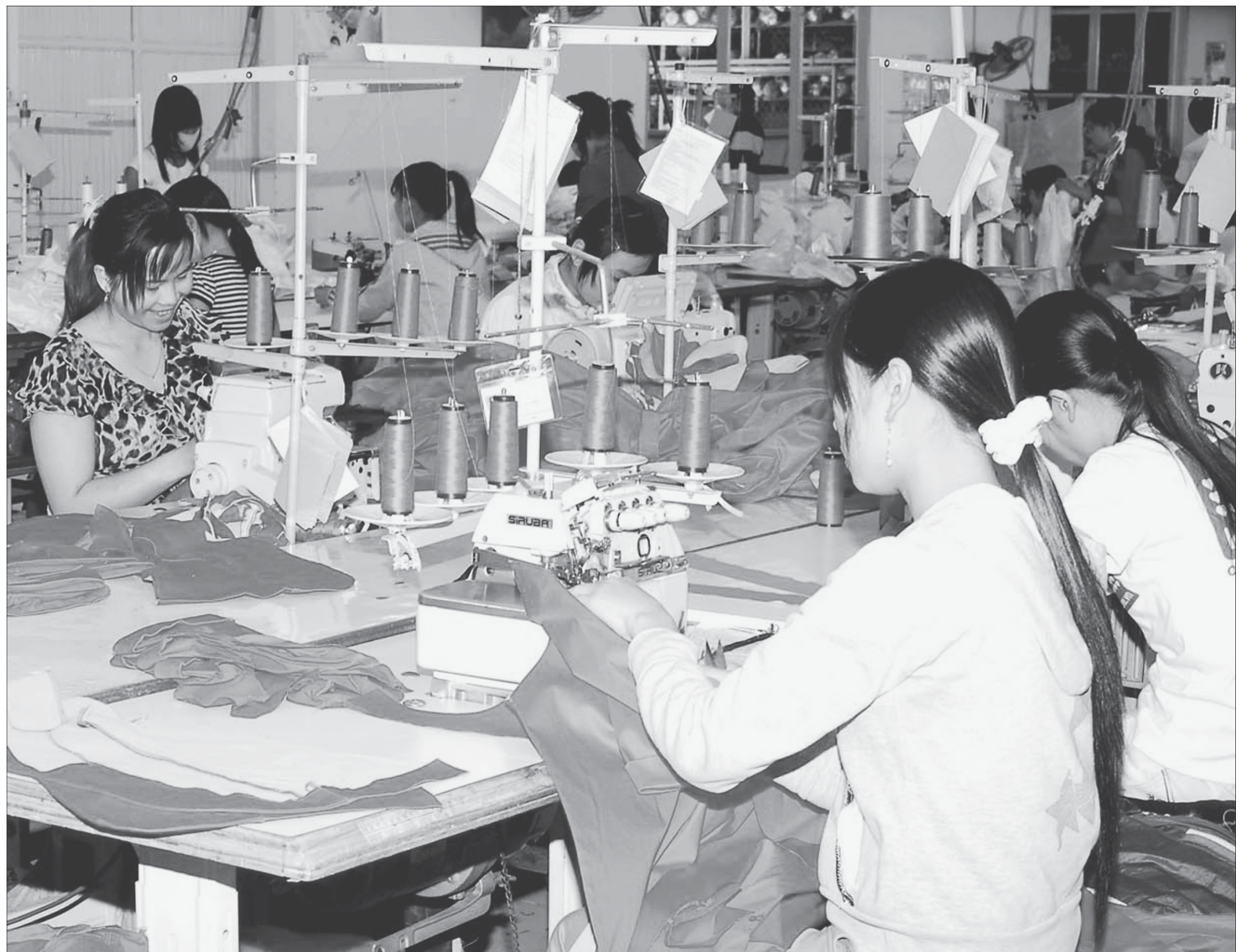
Dây chuyền sản xuất của Tổng Công ty May Nhà Bè tại Gia Lai.

IA GRAI Vùng chuyên canh cây công nghiệp