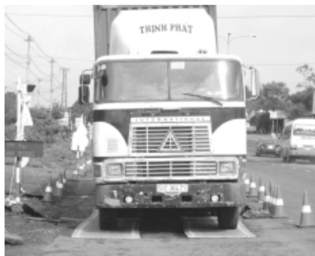
Xe lên cân kiểm tra tải trọng.