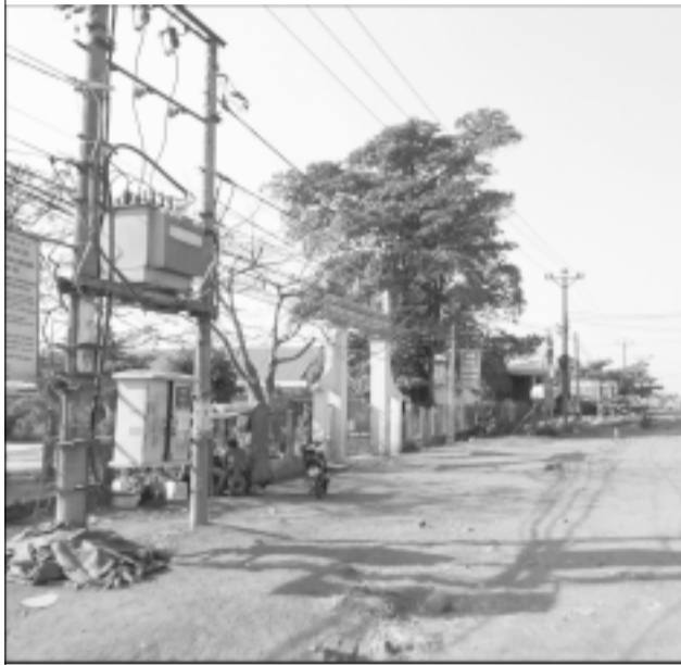
Hệ thống lưới điện tại xã Ia Hrú.