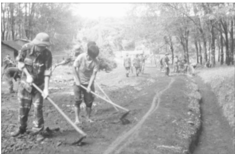
Tham gia làm đường giao thông nông thôn.