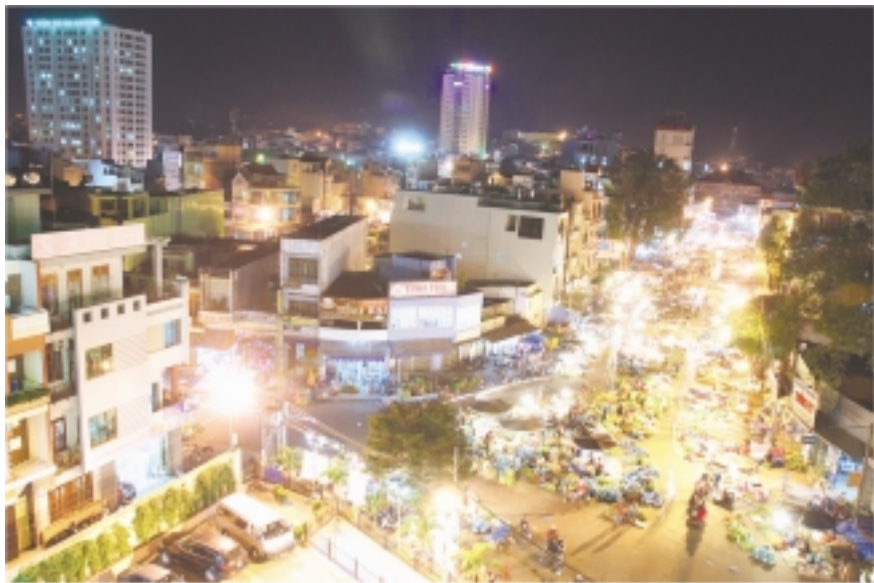
Nhộn nhịp chợ đêm Pleiku.