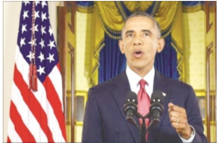
Tổng thống Mỹ Obama phát biểu trước toàn dân Mỹ.

Ông Obama cũng được cho là ông sẽ không đưa bộ binh sang chiến đấu với nhóm IS và Mỹ sẽ hành động để tiêu diệt nhóm IS trong khuôn khổ một liên minh mở rộng bao gồm các đồng minh phương Tây và các quốc gia Arab. "Chiến dịch chống khủng bố này sẽ được thực hiện bằng một nỗ lực liên tục nhằm đánh đuổi phiến quân IS ở bất kỳ nơi nào chúng hiện diện, sử dụng sức mạnh của không quân Mỹ và sự hỗ trợ của các lực lượng ủng hộ Mỹ trên mặt đất"-Nhà Trắng dẫn một đoạn trong bài phát biểu mà ông Obama đưa ra.