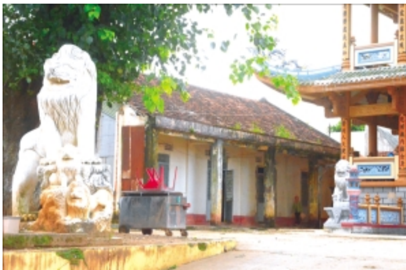
Sư tử đá theo tạo hình phương Tây trước cổng chùa Bửu Thắng (TP. Pleiku).

Các khách sạn cũng khá chuộng sư tử đá để trang trí để làm không gian thêm phần sinh động. Tại Khách sạn Hoàng Anh Gia Lai ở ngã ba Phù Đổng, ngay trước lối ra vào của khách sạn là 2 chú sư tử đá đang vờn bóng. Khách sạn Mạnh