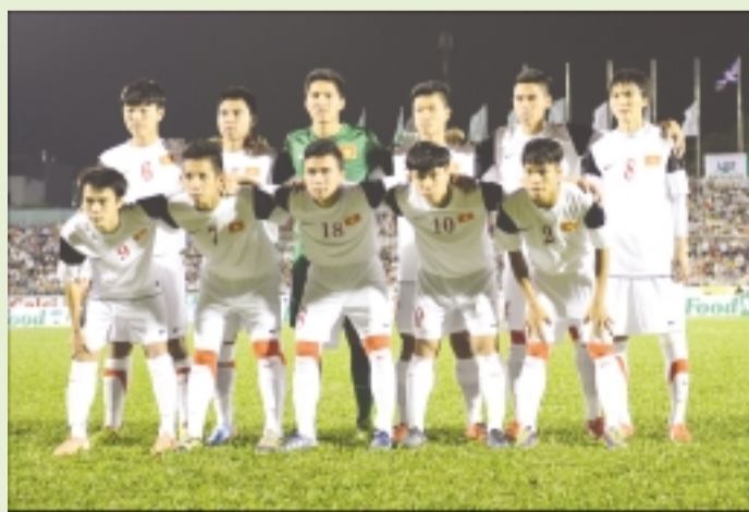
U19 Việt Nam còn quá nhiều việc phải làm.

Những kết quả ở giải U.19 Đông Nam Á mở rộng tại Hà Nội đã cho thấy tuyển U.19 Việt Nam vẫn còn quá nhiều việc để làm khi chuyển từ một đội bóng còn mang nhiều tính phô diễn, hoa mỹ thành một đội bóng hiệu quả cho những sân chơi có tầm vóc lớn. Ở giải U.19 Đông Nam Á dù kết quả của tuyển U.19 Việt Nam có