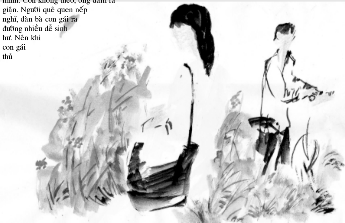
Minh họa: Kim Hương

mình. Con không theo, ông đâm ra giận. Người quê quen nếp nghĩ, đàn bà con gái ra đường nhiều dễ sinh hư. Nên khi con gái thủ