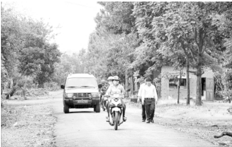
Đường liên xã được rải nhựa.

Ngay trong năm 1975-khi có tên mới là huyện Chư Pah, nhân dân trong huyện đã khai hoang phục hóa 2.500 ha ruộng đất, tích cực xóa mù chữ, phát