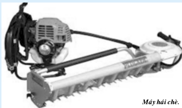
Máy hái chè.