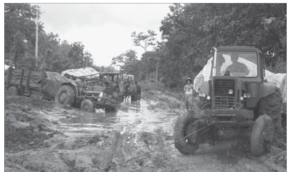
Hàng loạt xe chờ nông sản thay nhau sa vũng lầy.