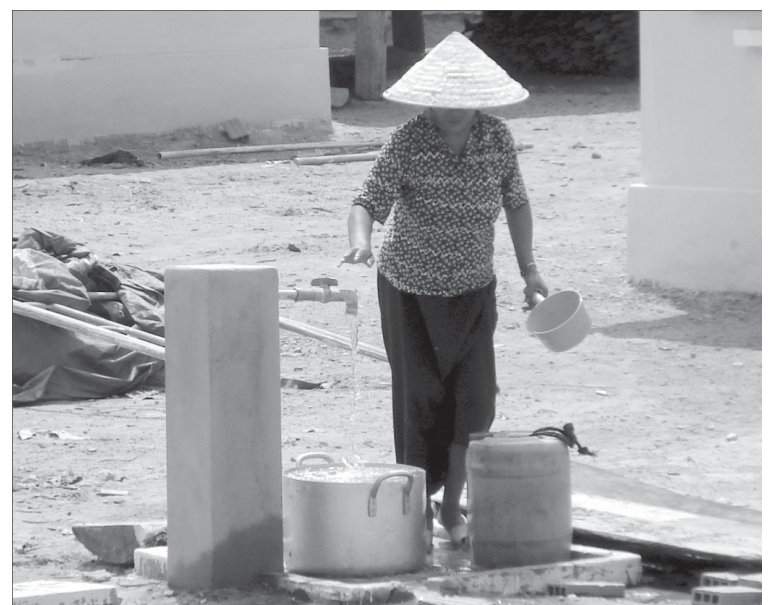
Cần thêm nhiều các công trình cấp nước sinh hoạt cho người dân.