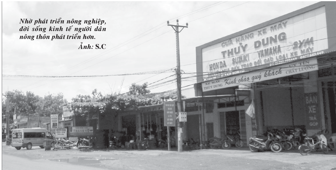
Nhờ phát triển nông nghiệp, đời sống kinh tế người dân nông thôn phát triển hơn.