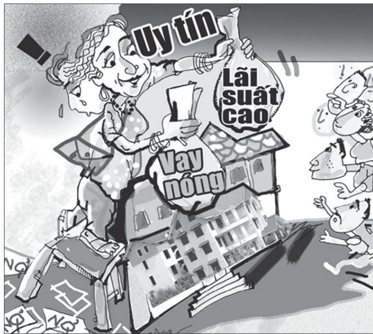
Tranh minh họa.