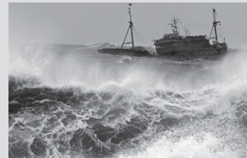
Một tàu cá Trung Quốc chống chọi với sóng to gió lớn khi đang tìm nơi trú ẩn tại một bến cảng ở đảo Jeju hôm 27-8.