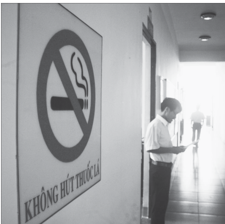
Biển cấm hút thuốc lá sẽ là vô hiệu, nếu người hút không có quyết tâm từ bỏ thuốc lá.

Trên cơ sở những kết quả đã đạt được, tỉnh đề ra mục tiêu đến năm 2020 giảm tỷ lệ trẻ em có hoàn cảnh đặc biệt xuống còn 3%, 95% tỷ lệ trẻ em có hoàn cảnh đặc biệt được trợ giúp, chăm sóc tái hòa nhập với cộng đồng và có cơ hội phát triển, số trẻ em bị bạo lực giảm xuống còn 40%, giảm tỷ lệ suy dinh dưỡng ở trẻ em dưới 5 tuổi thể nhẹ cân xuống 15%, giảm tỷ suất trẻ em bị tai nạn, thương tích xuống còn 450/100.000 trẻ em... P.L