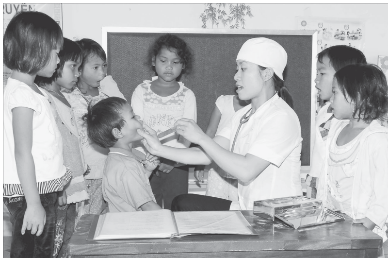
Chăm sóc sức khỏe cho các cháu thiếu nhi xã Ia Kly, huyện Chư Prông.

học và trung học cơ sở tiến hành đồng thời với việc nâng cao số lượng và chất lượng đội ngũ giáo viên ở các cấp học, ngành học, nâng cao cơ sở vật chất, trang-thiết bị dạy và học. Từ đó, chất lượng giáo dục không ngừng được nâng cao với tỷ lệ học sinh đi học đúng độ tuổi ngày càng tăng, từ 98,2% (năm 2005) đến 99,8% (năm 2012). Tỷ lệ trẻ em 5 tuổi đi mẫu giáo đạt 98,7%, tỷ lệ trẻ em tốt nghiệp tiểu học đạt 99,4%, tốt nghiệp trung học cơ sở đạt 96,1%.