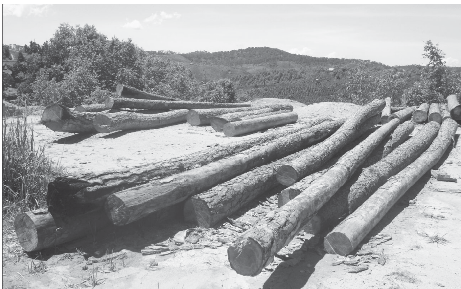
Một bãi gỗ từ nguồn tận thu ở rừng đầu nguồn Tây Nguyên.