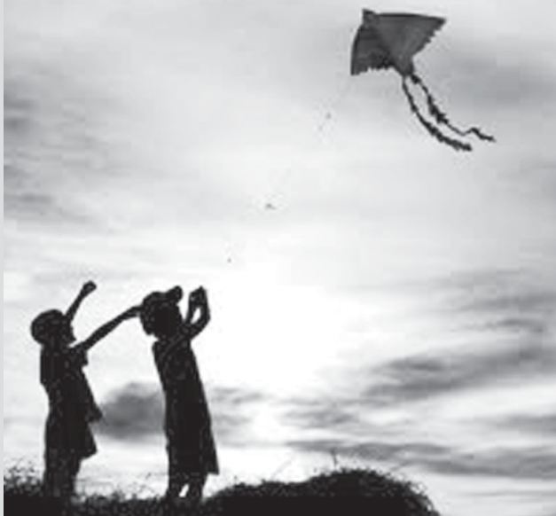
Ảnh minh họa.

Đó là phương pháp dạy học được đánh giá là tích cực, tiên tiến, ngoài dạy kiến thức giáo viên còn dạy học sinh cách tự học, tự khám phá, tìm hiểu, nghiên cứu cuộc sống xung quanh, tạo nên tính tò mò và say mê khoa học. Qua một năm triển khai thí điểm tại 2 Trường Tiểu học Nguyễn Trãi-TP. Pleiku và Tiểu học Ia Nhin-huyện Chư Pah, phương pháp này đã được các giáo viên áp dụng thành công và sẽ được tiếp tục nhân rộng vào năm học tới.