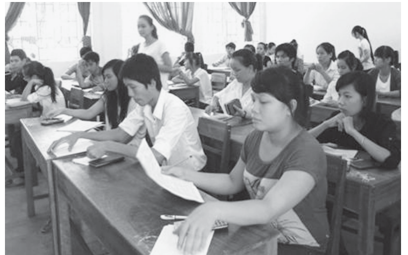
Thí sinh dò lại bài thi trước khi nộp tại điểm thi Trường THPT Cao Thắng, TP. Huế trong kỳ thi tuyển sinh đại học, cao đẳng 2012.

- Về phía gia đình, bố mẹ nên làm “xe ôm” cho con vì như vậy vừa đảm bảo an toàn, sức khỏe cho con vừa tăng tinh thần trách nhiệm của bố mẹ, tạo sự gần gũi và thể hiện sự yêu thương của bố mẹ đối với các con. Đặc biệt, cần quan tâm chế độ dinh dưỡng cho các con nhưng cũng đừng cho ăn đồ bổ quá nhiều sẽ gây khó tiêu; nên cho con ăn rau xanh, tôm, cua... và cố gắng