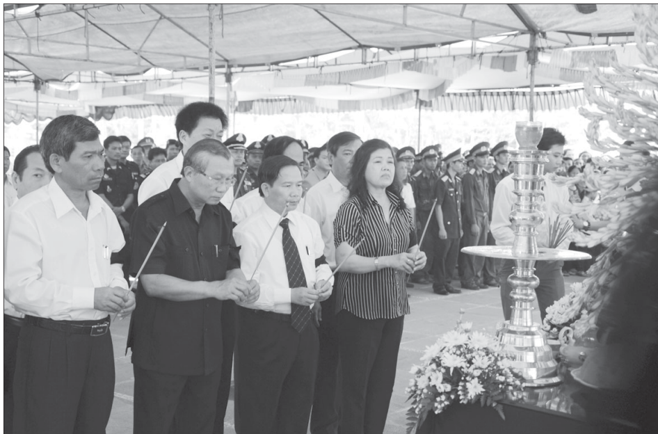
Lãnh đạo tỉnh thấp hương tưởng niệm các liệt sĩ.