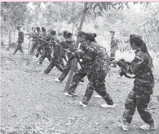
Huấn luyện các động tác vận động trên chiến trường.

Lễ xuất quân học kỳ trong quân đội năm 2013 với chủ đề “Tôi là chiến sĩ” sẽ diễn ra vào sáng 7-6, tại Trung tâm Hoạt động Thanh niên (347 Cách Mạng Tháng Tám, TP. Pleiku). Tính đến thời điểm hiện tại, mọi công tác chuẩn bị đã cơ bản hoàn tất.