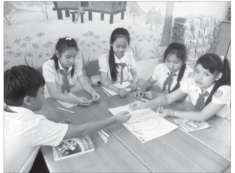
Học sinh Trường Tiểu học Nguyễn Trãi (TP. Pleiku) trong giờ học.

Đó là phương pháp dạy học được đánh giá là tích cực, tiên tiến, ngoài dạy kiến thức giáo viên còn dạy học sinh cách tự học, tự khám phá, tìm hiểu, nghiên cứu cuộc sống xung quanh, tạo nên tính tò mò và say mê khoa học. Qua một năm triển khai thí điểm tại 2 Trường Tiểu học Nguyễn Trãi-TP. Pleiku và Tiểu học Ia Nhin-huyện Chư Pah, phương pháp này đã được các giáo viên áp dụng thành công và sẽ được tiếp tục nhân rộng vào năm học tới.