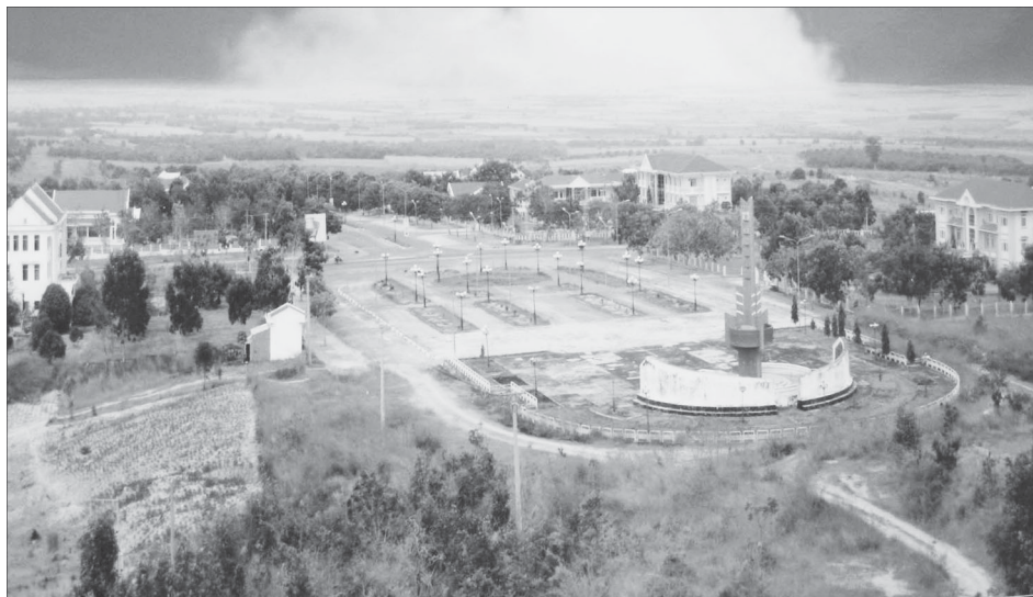
Một góc trung tâm huyện Ia Pa hôm nay.

Sau 10 năm thành lập, huyện Ia Pa từ trong nghèo khó đã phát huy nội lực, tận dụng các nguồn đầu tư để nhanh chóng tạo những đổi thay mạnh mẽ và toàn diện trên mọi lĩnh vực kinh tế-xã hội.