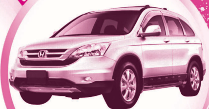
GIẢI ĐẶC BIỆT Xe ô tô Honda CR-V