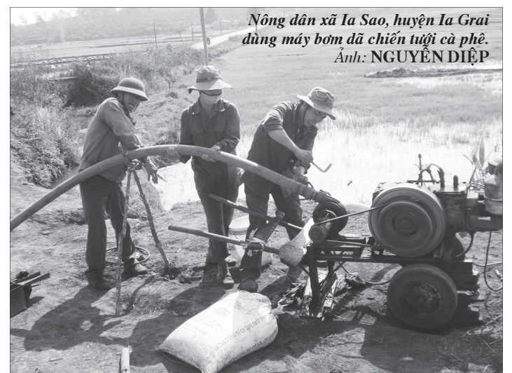
Nông dân xã Ia Sao, huyện Ia Grai dùng máy bơm dã chiến tưới cà phê.