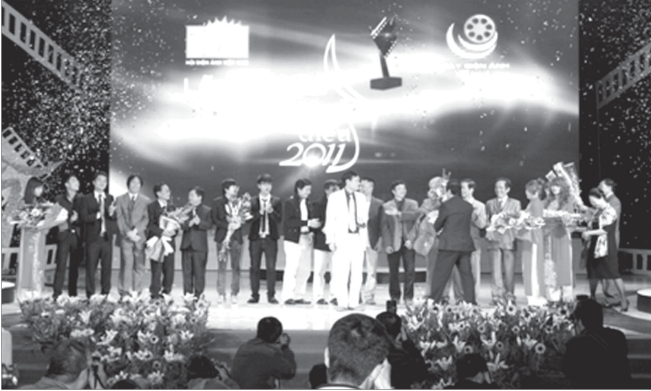
Phim "Mùi cỏ cháy" được vinh danh tại lễ trao giải Cánh diều tháng 3-2012.