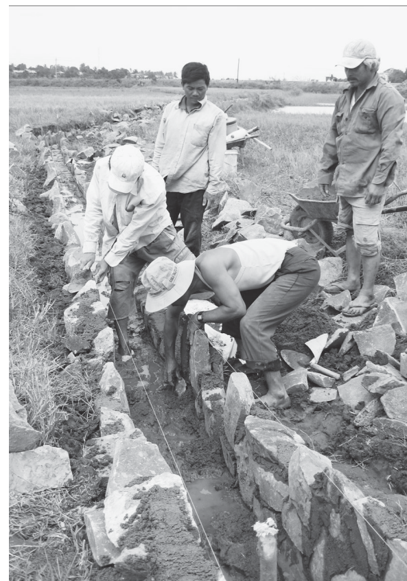
Nông dân góp sức cùng với Nhà nước xây dựng kênh mương nội đồng.

Trong năm 2012, xã Ia Ma Rơn đã huy động được nguồn vốn trên 4,88 tỷ đồng để đầu tư xây dựng nông thôn mới. Với nhiều công trình có ý nghĩa. Đáng kể như công trình đường giao thông liên xã nối từ chợ xã đến thôn sang xã Ia Yeng, huyện Phú Thiện; đường cấp phối liên thôn Ma Rin 2 đi Hlin; đường bê tông nội thôn Đak Chá; phục hồi đường trục nội đồng của 2 thôn Ama San và Bả Long; làm đường trục nội đồng thôn Đoàn Kết bị lũ phá