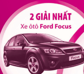
2 GIẢI NHẤT Xe ô tô Ford Focus

Chia sẻ cơ hội, hợp tác thành công www.bidv.com.vn