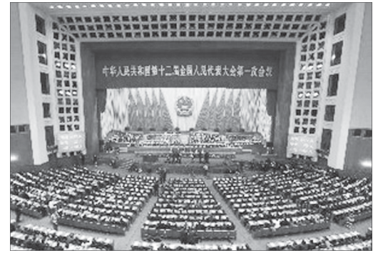
Toàn cảnh lễ khai mạc phiên họp thứ nhất, Quốc hội khóa XII của Trung Quốc.

Đoàn Chủ tịch đã chốt danh sách ứng cử viên cho các chức danh lãnh đạo chủ chốt của Ủy ban Thường vụ Quốc hội khóa XII gồm Chủ tịch Ủy ban Thường vụ, các Phó Chủ tịch, Tổng Thư ký và các ủy viên, cũng như Chủ tịch, Phó Chủ tịch nước Cộng hòa Nhân dân Trung Hoa và Chủ tịch Quân ủy Trung ương để gửi đến các đoàn đại biểu Quốc hội thảo luận và lấy ý kiến. Ông Lưu Văn Sơn-Ủy viên Thường vụ Bộ Chính trị Ban Chấp hành Trung ương Đảng Cộng sản Trung