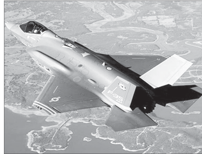
Chiến đấu cơ tàng hình F-35.

Quốc đảo Đông Nam Á đang ở những giai đoạn cuối cùng trong việc đánh giá các máy bay chiến đấu tàng hình F-35 của Mỹ, để thay thế cho đội bay cũ kỹ. Bộ Quốc phòng Singapore cho biết các chiến đấu cơ F-35 được coi là sự thay thế cho những chiếc F-5, vốn đã ở cuối vòng đời hoạt động và những chiếc F-16 cũng đã được sử dụng từ khá lâu.