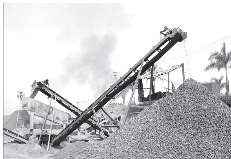
Nhiều lao động ngoài quốc doanh chưa được thực hiện đầy đủ về các phương tiện bảo hộ lao động.

Đáng nói nhất là phải kể đến các doanh nghiệp ngoài quốc doanh. Hầu hết các doanh nghiệp này khi tuyển