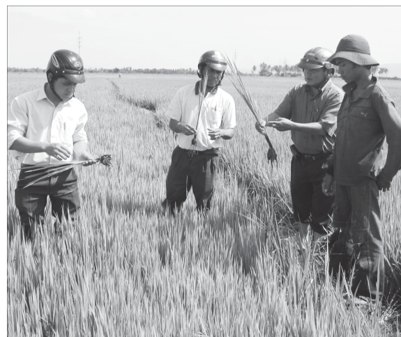
Hướng dẫn nông dân thâm canh tăng năng suất lúa nước.