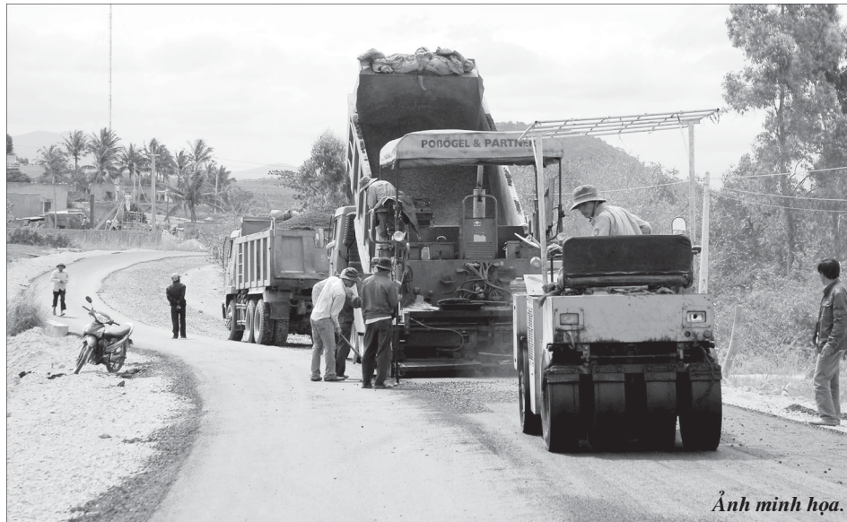
Ảnh minh họa.