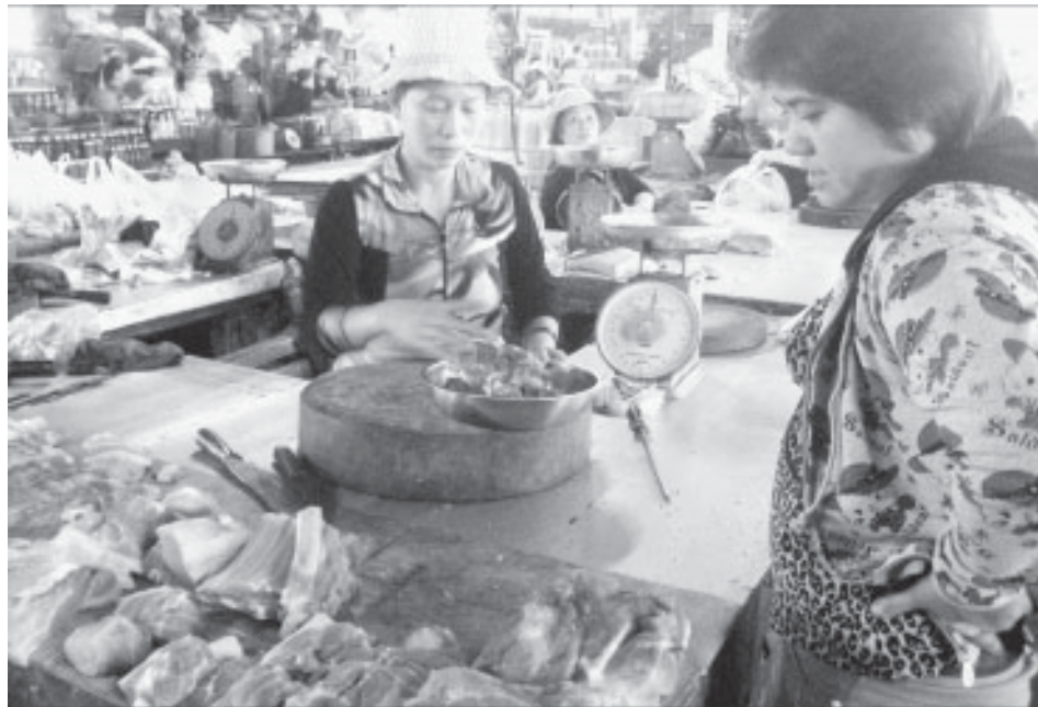
Khó biết được thịt heo nào đã quá 8 giờ sau giết mổ.