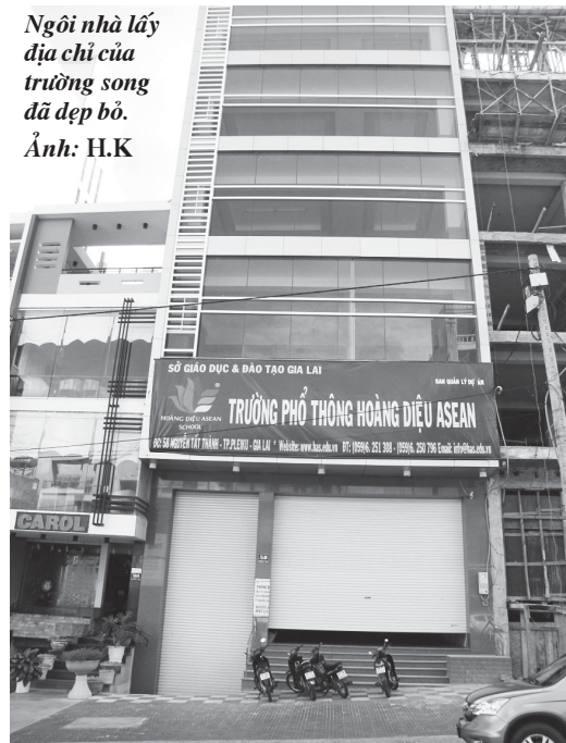
Ngôi nhà lấy địa chỉ của trường song đã đẹp bỏ.