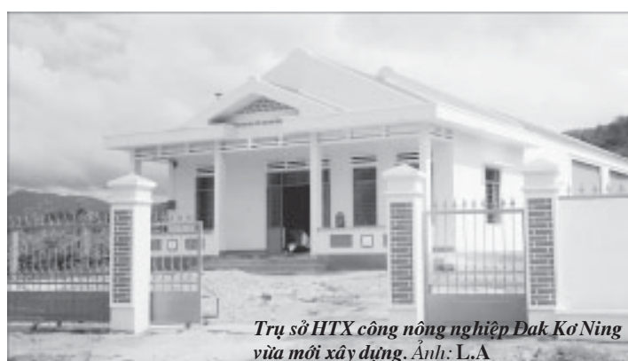
Trụ sở HTX công nông nghiệp Đak Kơ Ning vừa mới xây dựng.