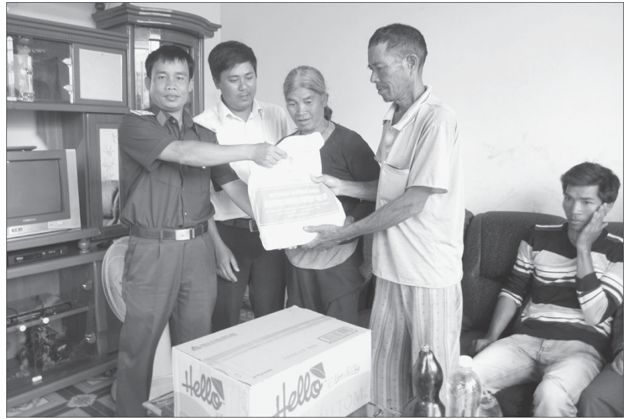
Các ban, ngành đoàn thể đến thăm hỏi, động viên gia đình thanh niên trước ngày nhập ngũ.