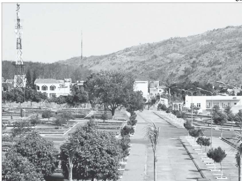
Một góc huyện Chư Pah.