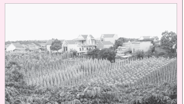
Một góc xã Hải Yang.