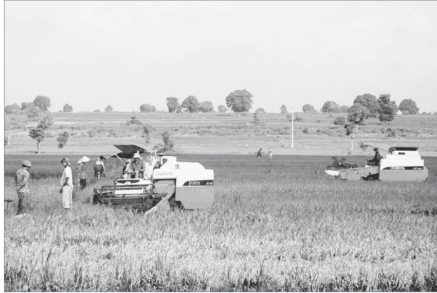
Máy gặt lúa trên cánh đồng xã Ia Ma Rơn.

Ông Lữ Phúc Phong-Trưởng phòng Nông nghiệp và PTNT kiêm Phó ban chỉ đạo thực hiện Chương trình xây dựng NTM huyện Ia Pa cho biết: Thực hiện Chương trình xây dựng NTM, theo lộ trình của huyện được phân chia II giai đoạn: giai đoạn I từ 2010-2015 và giai đoạn 2 từ 2015-2020. Trên cơ sở kế hoạch huyện đã xây dựng, mục tiêu phấn đấu 100% xã đạt đủ 19 tiêu chí. Tuy nhiên, nhìn nhận thực tế khách quan để thực hiện được mục tiêu xây dựng NTM ở một huyện nghèo như Ia Pa là rất khó. Qua khảo sát, hiện nay mức độ đạt chuẩn các tiêu chí về xây dựng NTM ở huyện Ia Pa chỉ có 3/9 xã đạt được từ 3 đến 8 tiêu chí, còn 6 xã đạt dưới 5 tiêu chí. Hơn nữa, trước đây thực hiện Quyết định 800/QĐ-TTg, ngày 4-6-2010 của