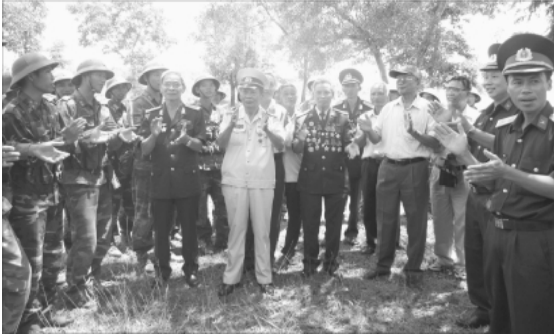
Các thể hệ cán bộ, chiến sĩ Trung đoàn 38 trong ngày gặp mặt.