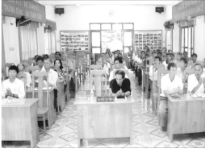
Câu lạc bộ tổ chức tổng kết sau 3 năm đi vào hoạt động.

Dù đã rời môi trường quân đội để trở về với cuộc sống đời thường nhưng những cựu quân nhân (CQN) của phường Tây Sơn, thị xã An Khê vẫn được sống trong ngôi nhà chung của tình đồng đội, đồng chí. Ngôi nhà chung ấy chính là Câu lạc bộ (CLB) Cựu Quân nhân. Sau gần 4 năm đi vào hoạt động, CLB đã đáp ứng được nguyện vọng chính đáng của bao thế hệ CQN, trở thành nơi nuôi dưỡng tâm hồn, cốt cách và phẩm chất của người lính Cụ Hồ.