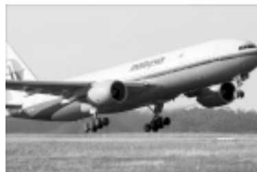
Máy bay của hãng Malaysia Airlines.

Đội tìm kiếm và cứu hộ quốc tế chiếc máy bay mang số hiệu MH370 của Hãng Hàng không Malaysia Airlines (MAS) đã phát hiện 58 vật thể cứng tại đáy biển Ấn Độ Dương khu vực đang tìm kiếm, những vật thể lạ này được cho là không thuộc về đáy biển.