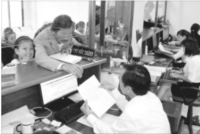
Văn phòng một cửa hiện đại TP. Pleiku.

Gắn với công tác xây dựng chính quyền, TP. Pleiku đã tăng cường công tác cải cách hành chính trên các lĩnh vực, chú trọng giải quyết các thủ tục hành chính. Thành phố đã tăng cường kỷ luật, kỷ cương hành chính, thực hiện nghiêm túc việc chấp hành giờ làm việc theo quy định, hiện đại hóa cơ sở vật chất cần thiết, ứng dụng công nghệ thông tin vào xử lý, giải quyết công việc hàng ngày, để nâng cao chất lượng dịch vụ hành chính công, góp phần nâng cao tính minh bạch, công khai trong việc tiếp nhận và giải quyết hồ sơ cho công dân, tổ chức.