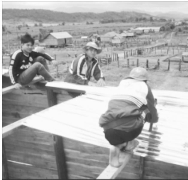
Sửa chữa nhà rông cho người dân ở xã Dak Kơ Ning.

Sau 3 năm thực hiện cuộc vận động “Tuổi trẻ chung sức xây dựng nông thôn mới”, đoàn viên thanh niên huyện Kông Chro đã thực hiện nhiều việc làm có ý nghĩa thiết thực, góp phần đẩy nhanh việc thực hiện các tiêu chí xây dựng nông thôn mới trên địa bàn.