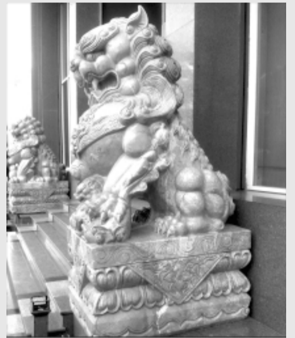
Sư tử đá trước trụ sở một cơ quan trên đường Quang Trung (TP. Pleiku).

Và theo trào lưu chung hiện nay ở Pleiku cũng đã xuất hiện kiểu đặt linh vật xuất xứ Trung Quốc-sư tử đá-tại một số nơi. Được biết sắp tới ngành Văn hóa-Thể thao và Du lịch sẽ tiếp tục triển khai công tác tuyên truyền, vận động các cơ quan cũng