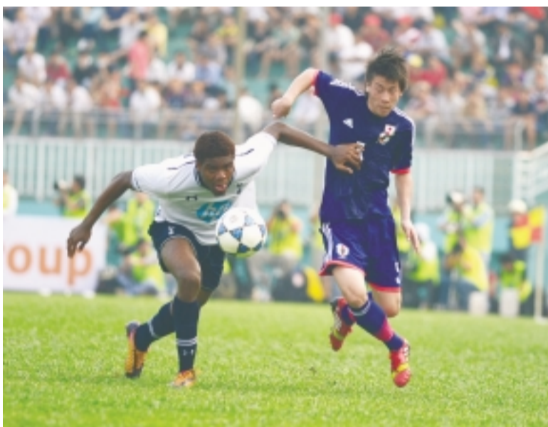
U19 Nhật Bản (áo xanh) là thuộc thủ lĩnh cao với các cầu thủ U19 Việt Nam tại giải vô địch U19 Đông Nam Á.