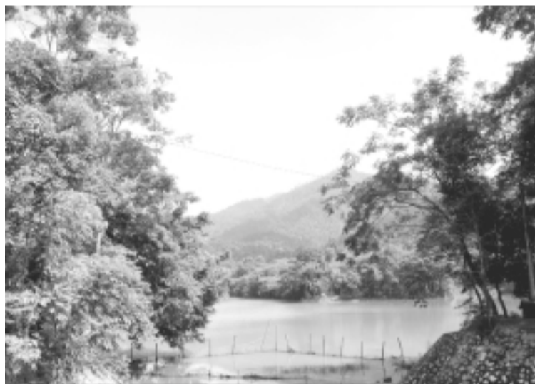
Sông núi hữu tình.

Với một đoạn đường không xa lắm, đã được bê tông hóa, các đồng nghiệp chủ nhà đưa chúng tôi lên lán Nà Lừa. Cũng từ cô hướng dẫn viên Thu Nga cho biết, thì chỉ ít ngày sau khi