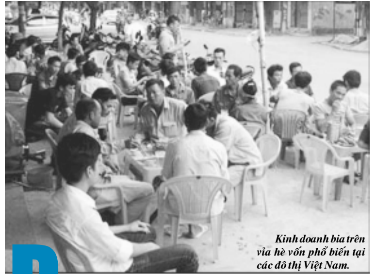
Kinh doanh bia trên vỉa hè vốn phổ biến tại các đô thị Việt Nam.