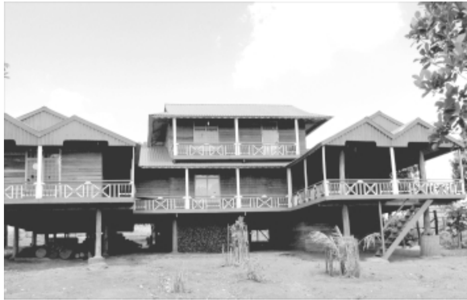
Nhà sàn của người Bahnar tại xã Yang Nam.

Điều khiến những ngôi nhà sàn “cải cách” trở nên nổi bật hơn hẳn chính là sự bề thế của nó. Không còn bó hẹp trong phạm vi ngôi nhà sàn nhỏ nhắn, nhiều ngôi nhà ở đây có bề ngang khoảng 10 mét, chiều dài cũng tương đương, thậm chí có nhà dài hơn tùy vào ý muốn và sự sắp xếp không gian bên trong của gia chủ. Chiều cao của ngôi nhà nhỉnh hơn hẳn so với nhà truyền thống, nhiều gia đình còn làm thêm phần gác khiến ngôi nhà càng to lớn hơn. Phần hiên lộ thiên của nhà sàn truyền thống cũng được mở rộng và lợp thêm mái tôn đẹp mắt, trở thành nơi để các già ngồi trà chén, nói chuyện phiếm, các mẹ ru con, dệt vải mặc cho trời nắng hay mưa. Xung quanh phần hiên được trang trí bởi dây lan can bằng gỗ tiện đẽo điệu đà. Ngôi nghỉ ngơi dưới mái hiên, mặc cho ngoài đường nắng như đổ lửa, gió vẫn lùa qua kẽ các tấm ván lót sàn thổi lên mát rượi, ông Đinh Quen (làng Tpong 1) nói: “Ngày trước nhà không có hiên như thế này đâu. Mình thấy nhiều người làm nên học