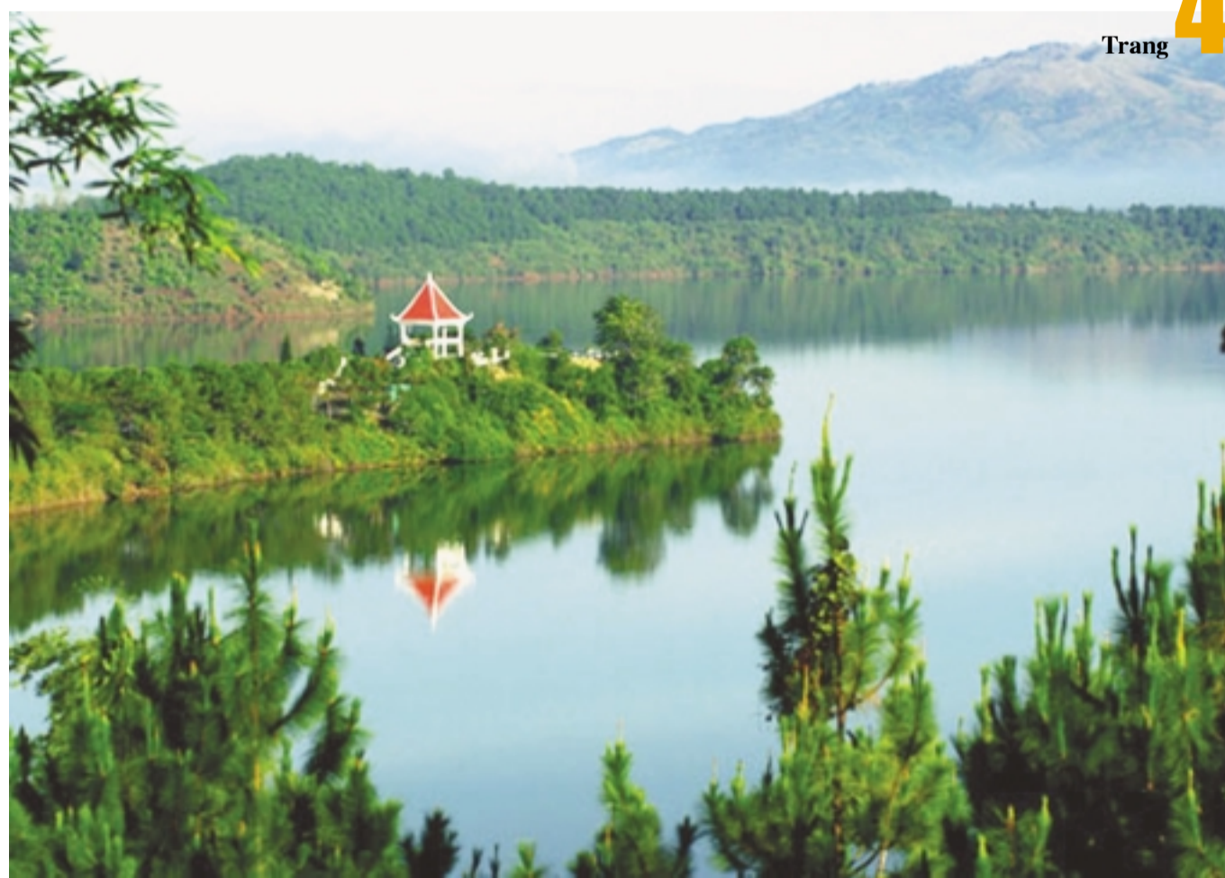
Biển Hồ-nguồn nước cung cấp cho TP. Pleiku.