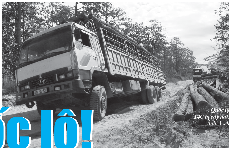
Quốc lộ 14C bị cày nát.