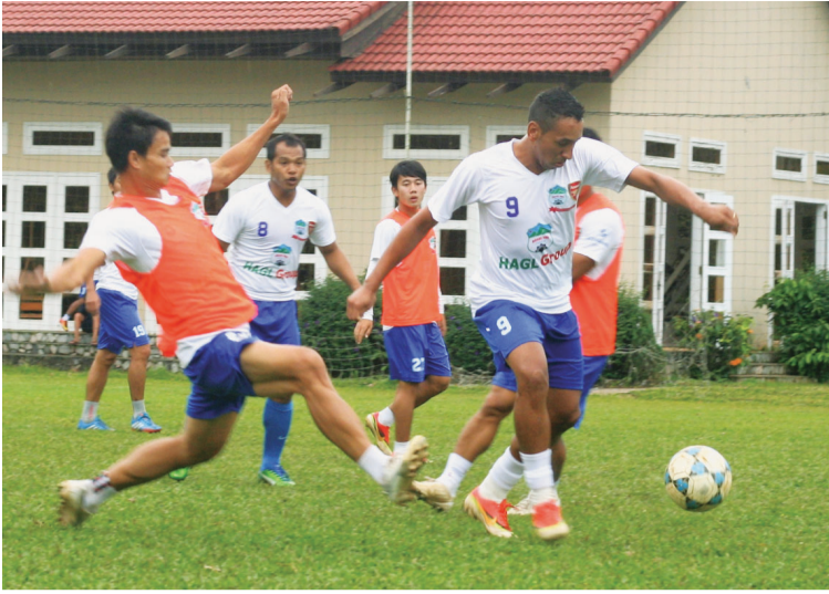
HA.GL đang có sự chuẩn bị khá chậm chạp khi mùa giải mới đang đến gần.