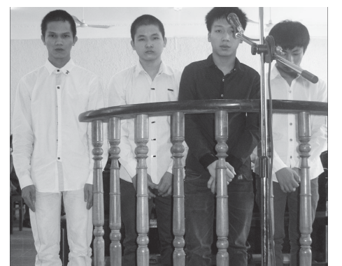
Các bị cáo trước vành móng ngựa.

Cảm tức vì bỗng dưng bị đánh, Phi rủ Chiến và Đức đánh Nhật trả thù. Khi cả