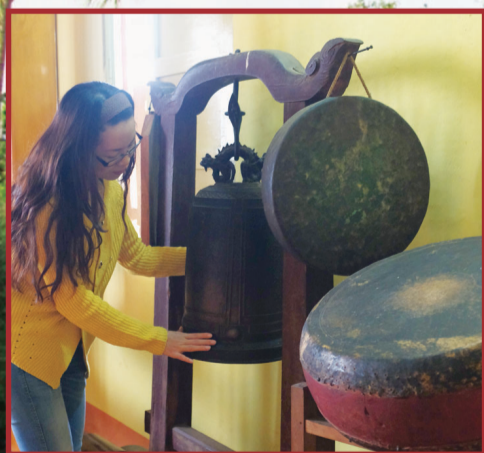
Có lịch sử mấy trăm năm, chùa An Bình giản dị giữa cảnh trí yên tĩnh của làng quê.