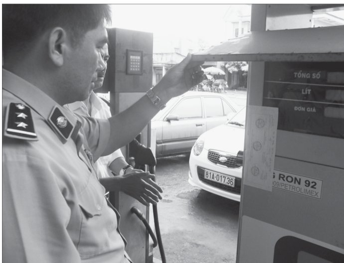
Lực lượng chức năng niêm phong cây xăng gian lận.

cây xăng này đã bán ra thị trường hơn 30 ngàn lít xăng, với sai số như trên, trong tháng 7, cây xăng đã “móc túi” của người tiêu dùng cỡ 1.800 lít xăng. Cửa hàng bán lẻ xăng dầu số 8 thuộc Công ty cổ phần thương mại Nam Gia Lai (xã Ia Tul, huyện Ia Pa) bị bắt quả tang cột đo xăng sai phạm với sai số +4,475%. Đại lý bán lẻ xăng dầu Ánh Lại (khối phố 2,