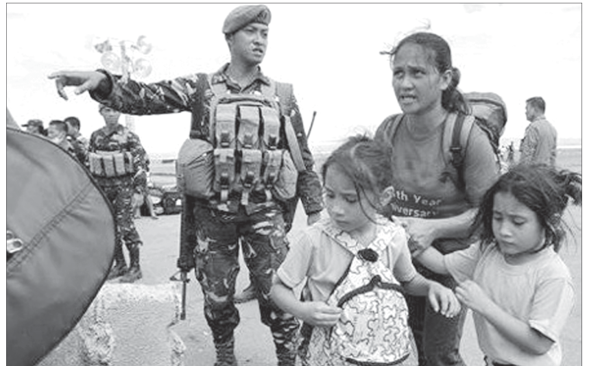
Hoạt động cứu trợ ở Tacloban có nhiều tiến triển.

Tổng thống Philippines-Benigno Aquino ngày 21-11 có cuộc họp nội các và các chuyên gia kinh tế nhằm thảo luận chương trình hành động cho những khu vực bị ảnh hưởng nghiêm