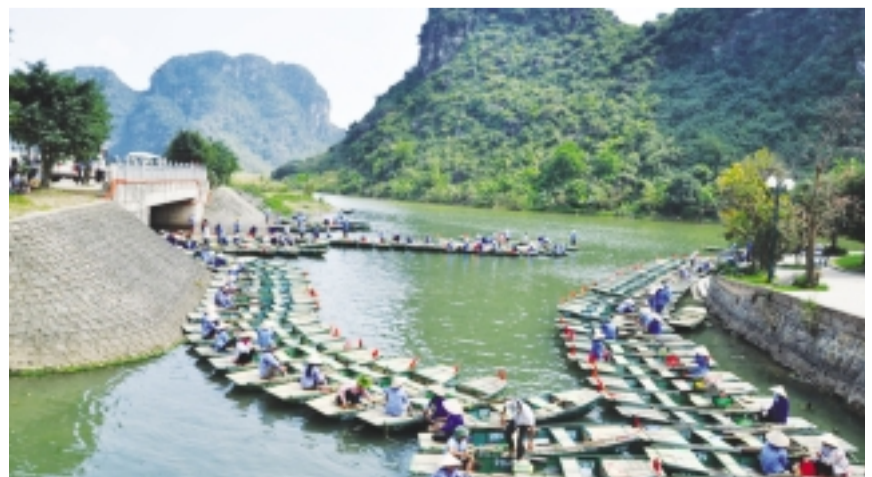
Bến đò Tràng An.

15 giờ 57 phút giờ Việt Nam, ngày 23-6, tại thủ đô Doha, Qatar, Ủy ban Di sản Thế giới thuộc Tổ chức Giáo dục-Khoa học và Văn hóa của Liên hợp quốc (UNESCO) đã chính thức ghi danh Quần thể danh thắng Tràng An (Ninh Bình) của Việt Nam vào danh mục Di sản Thế giới.