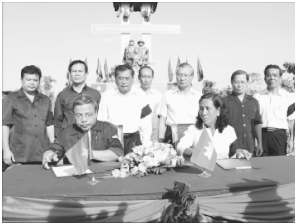
Chủ tịch UBND tỉnh Gia Lai và Tỉnh trưởng Presvihear chứng kiến lễ ký kết bàn giao hài cốt liệt sĩ Quân Tình nguyện Việt Nam (tháng 5-2013).