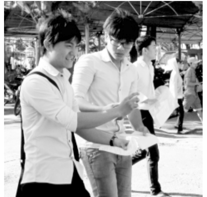
Nhiều thí sinh tỏ ra vui mừng với đề Toán.