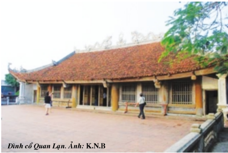
Đình cổ Quan Lạn.