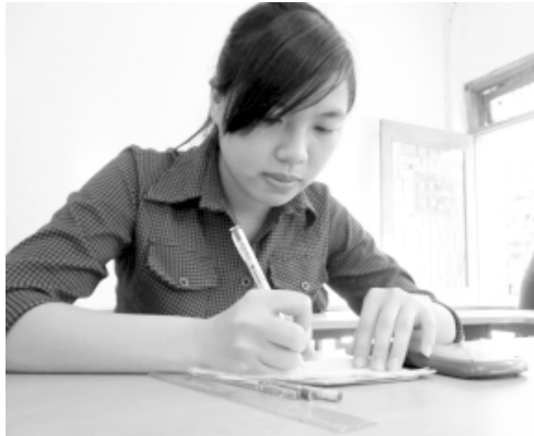
Bước vào ngày thi đầu tiên.

Ngày 4-7, tại Cụm thi liên trường TP. Quy Nhơn, 27.429 sĩ tử đã bước vào thi môn Toán và Vật lý-2 môn thi đầu tiên của kỳ thi tuyển sinh ĐH-CD 2014. Với đề Toán, nhiều thí sinh cảm thấy phấn khởi vì dù khó thì cũng dễ dàng đạt điểm 5, điểm 6 nhưng với đề thi Vật lý, nhiều thí sinh đã thực sự gặp khó với nỗi lo đạt điểm dưới trung bình.