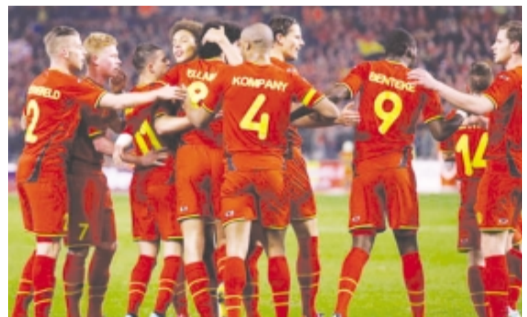
Thế hệ vàng của Bỉ là một trong số ít đội còn giữ được lối chơi truyền thống.

Sneijder, Van Persie. Bây giờ đòi hỏi Hà Lan phải tấn công tổng lực, mọi vị trí đều biết dâng lên ào ào như thời của Johan Cruyff những năm 1970 thì có khác gì... tự sát.