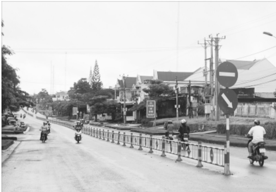
Trung tâm huyện Đức Cơ.