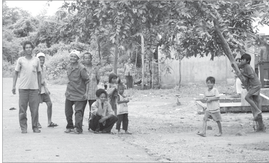
Làng cù ở Ia Puch.

Ngày địa phương tiến hành giao đất rừng cho các doanh nghiệp trồng cao su ở Ia Puch đã đánh dấu một cuộc chuyển đổi lớn lao trong đời sống của người dân nơi đây. Với 12.000 ha rừng và đất rừng giao 5 doanh nghiệp trồng cao su là: Bình Dương, Quang Đức, Quốc Cường, Cao su Chư Prông, Công ty cổ phần Trồng rừng Gia Lai (thuộc Tập đoàn Hoàng Anh Gia Lai), hiện trạng đất tự nhiên của Ia Puch thay đổi nhanh chóng.