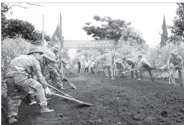
Hè tình nguyện tại xã An Phú.