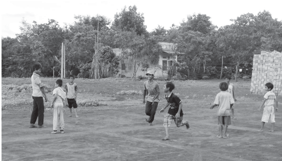
Luật tục của các dân tộc thiểu số ở Tây Nguyên nêu rõ trách nhiệm nuôi nấng, chăm sóc trẻ em là bổn phận của bậc làm cha mẹ, gia đình và cộng đồng.