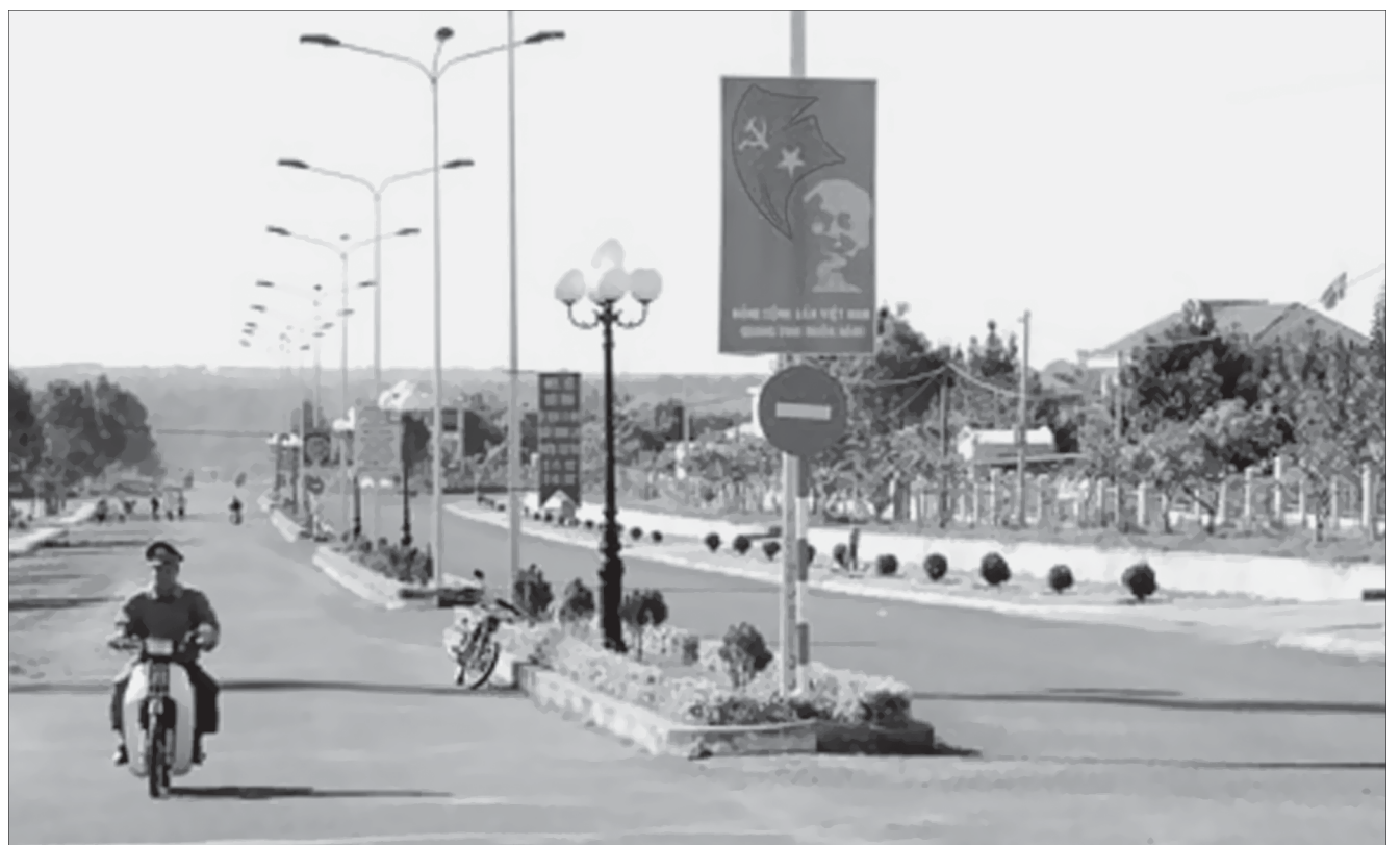
Thị trấn Phú Hòa, huyện Chư Pah.