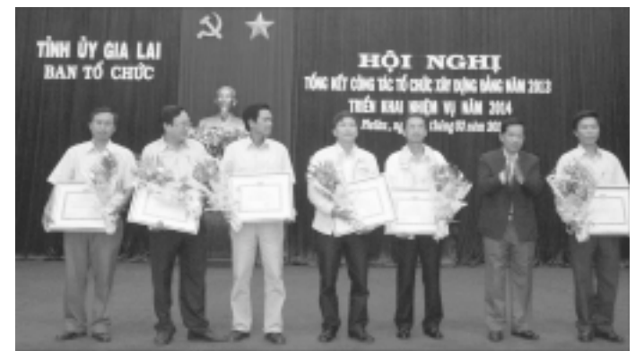
Khen thưởng các tập thể và cá nhân có thành tích tiêu biểu trong công tác tổ chức-xây dựng Đảng.

Chính trị tỉnh mở 3 lớp cao cấp lý luận chính trị hệ tại chức cho 362 cán bộ. Chọn cử 72 cán bộ đi dự thi nâng ngạch chuyên viên lên chuyên viên chính và cử 17 cán bộ đi dự thi chuyên viên chính lên chuyên viên cao cấp. Gắn với thực hiện Nghị quyết Trung ương 5 (khóa IX) về “Đổi mới và nâng cao chất lượng hoạt động của hệ thống chính trị ở cơ sở xã,