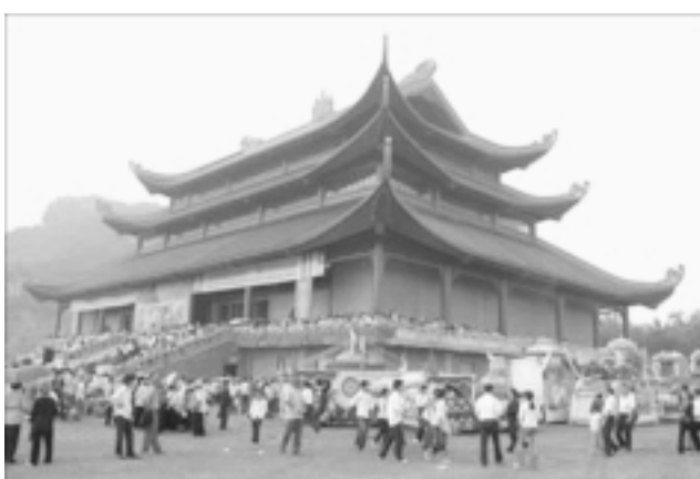
Chùa Bái Đính-nơi tổ chức Đại lễ Phật đản Liên hợp quốc tại Việt Nam.