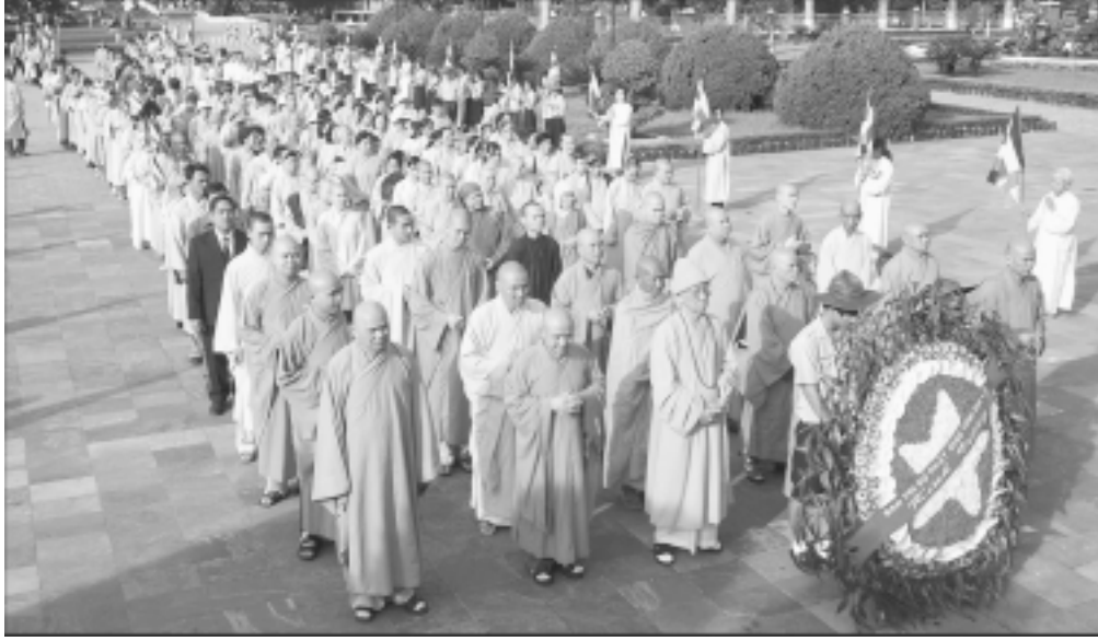
Tăng ni và phật tử viêng Nghia trang Liệt sĩ tỉnh trong dịp lễ Phật đản.