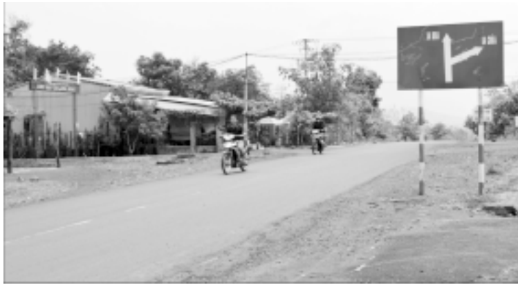
“Ngã ba xe tăng” thuộc thôn 5, xã Ia Kráí, huyện Ia Grai.

“Ngã ba xe tăng” cách TP. Pleiku 40 km về phía Tây, thuộc thôn 5, xã Ia Kráí, huyện Ia Grai. Phó Chủ tịch UBND huyện Ia Grai-ông Phan Trung Tường một mực khẳng định với chúng tôi rằng: Trước năm 1977, chính mắt ông Tường thấy ở ngã ba này có một chiếc xe tăng màu xanh của quân đội Mỹ đã bị cháy nham nhở. Sau đó, người dân đến tháo dỡ các bộ phận của xe tăng, rồi đưa đi lúc nào không hay biết. Dù không còn thấy chiếc xe tăng này, nhưng bà con trong vùng vẫn quen gọi nơi đây là “ngã ba xe tăng”.