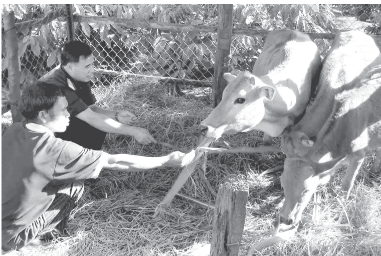
Những hộ dân được nhận bò đều đã vươn lên thoát nghèo.