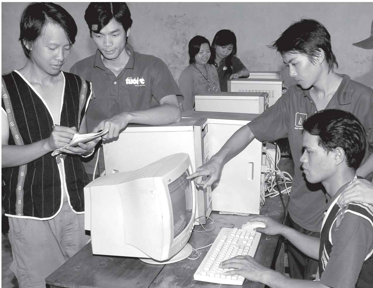
Ảnh mang tính minh họa.