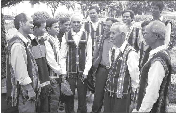
Cán bộ DTTS trong hệ thống chính trị ở cơ sở của TP. Pleiku.

phường nhiệm kỳ 2010-2015 là 27/304 người-chiếm 8,9%, đại biểu HĐND xã phường nhiệm kỳ 2011-2016 là 79/602 người-chiếm 13%.