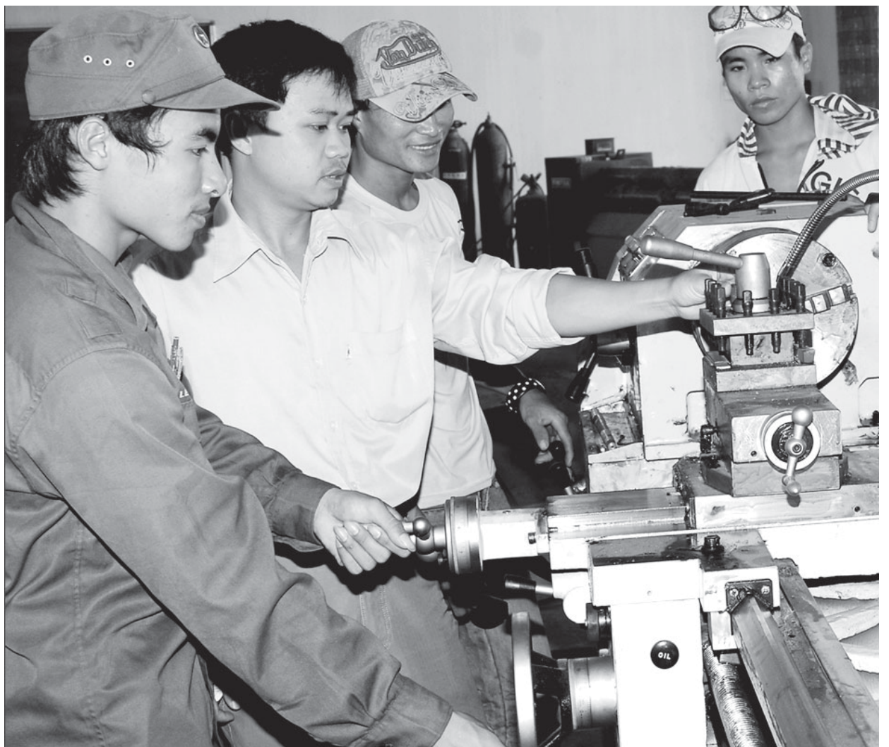
Giờ thực hành của học viên Trường Cao đẳng Nghề Gia Lai. Đ.T