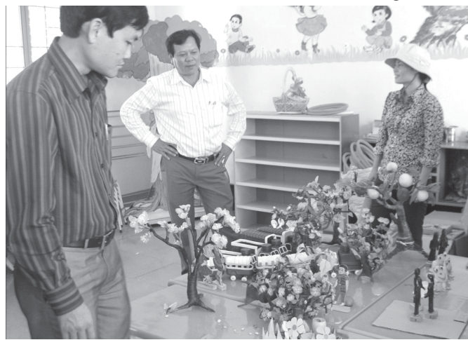
Đoàn giám sát kiểm tra thiết bị được cấp từ các dự án.

Năm 2013, kinh phí thực hiện Chương trình mục tiêu quốc gia về giáo dục-đào tạo và việc làm-dạy nghề là 134.625 triệu đồng, trong đó vốn đầu tư phát triển là 3.045 triệu đồng và vốn sự nghiệp là 131.580 triệu đồng.