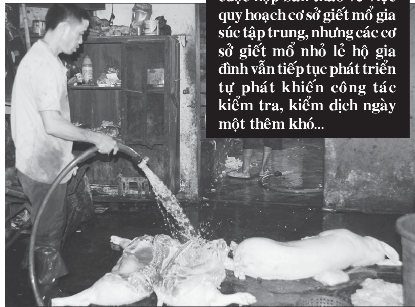
Một điểm giết mổ gia súc tại thị xã An Khê.