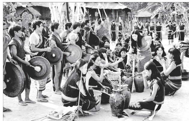
Vào mùa lễ hội.

Hiện tại, làng còn giữ được một số nghề truyền thống như đan lát và dệt thổ cẩm... Các gia đình trong làng cũng còn lưu giữ được nhiều quả bầu khô màu đen nhỏ xinh xắn để trên gác bếp làm quà tặng lưu niệm cho du khách, đó cũng là sản phẩm du lịch (souvenir) để du khách mua làm quà biếu tặng khi đến tham quan và nghỉ tại làng. Đây là sản phẩm người dân địa phương cần bảo tồn hạt giống, trồng nhân rộng và bán cho du khách để góp phần cải thiện cuộc sống của dân cư địa phương và điều đó khẳng định du lịch cộng đồng làng là biện pháp khá hữu hiệu để phát triển kinh tế-xã hội, xóa đói giảm nghèo. Điều này cũng nằm trong tiêu chí phát triển du lịch cộng đồng đã được ngành đề ra. Đời sống của người dân nơi đây chủ yếu dựa vào trồng mì vì địa hình ở đây có độ dốc cao, đất pha cát nên không thích hợp cho trồng lúa. Người dân nơi đây biết tận dụng củ mì kết hợp với hạt