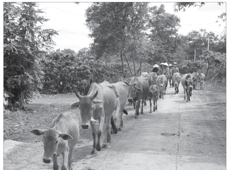
Đường giao thông đã được bê tông hóa.