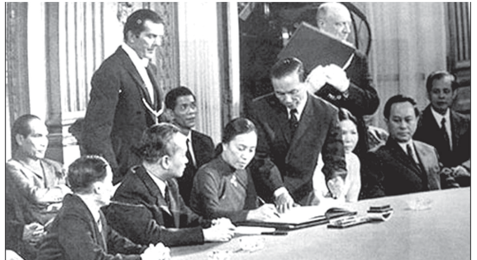
Bà Nguyễn Thị Bình-Trưởng đoàn Chính phủ Cách mạng lâm thời Cộng hòa miền Nam Việt Nam (ở giữa) ký vào Hiệp định Paris về chấm dứt chiến tranh, lập lại hòa bình tại Việt Nam (ảnh tư liệu).

Hiệp định là một thắng lợi có ý nghĩa lịch sử của nhân dân Việt Nam trong cuộc kháng chiến chống Mỹ cứu nước. Trong lịch sử đấu tranh chống ngoại xâm của nhân dân ta, chưa bao giờ có cuộc đàm phán nào kéo dài như tại Hội nghị Paris, từ 15-3-1968 đến 27-1-1973, cụ thể kéo dài 4 năm, 8 tháng, 14 ngày, với 202 phiên họp công khai và 24 đợt gặp riêng. Cuộc đấu tranh của nhân dân ta trên bàn thương lượng đã giành được thắng lợi quan trọng, to lớn về nhiều mặt.