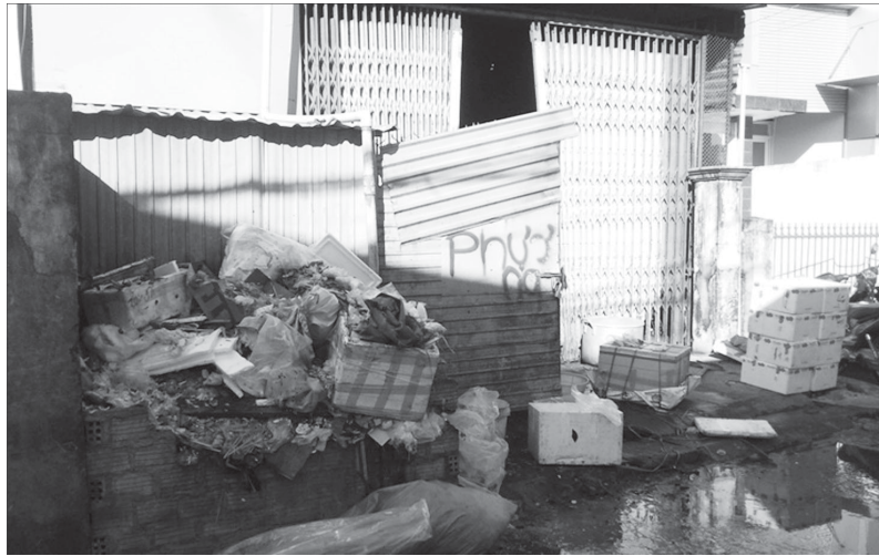
Rác chất thành đống ngay trước khu chế biến thức ăn.

vì trong nhà lúc nào cũng bị mùi hôi, bụi than và ruồi muỗi. Các con của tôi 2 năm nay cũng liên tục mắc các bệnh về đường hô hấp phải thường xuyên đi bệnh viện khám và lấy thuốc về uống”.