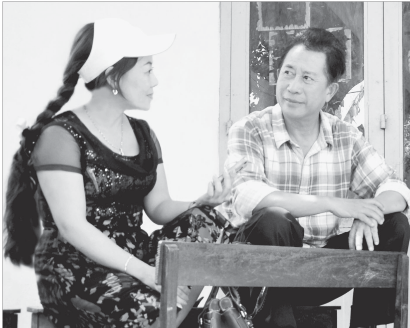
Yan vui vẻ chuyện trò cùng tác giả.