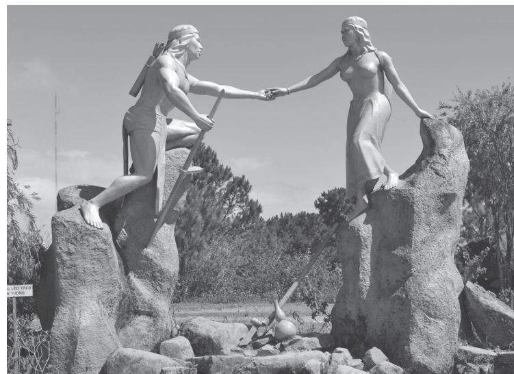
Bức tượng chàng K’Lang và nàng Biang trên đỉnh Lang Biang.

để cứu H’biang nhưng cái kết bi thương là nàng H’biang chết do nàng đỡ mũi tên có tẩm thuốc độc nhắm thẳng vào K’lang. Đau buồn khôn xiết, K’lang đã khóc rất nhiều, nước mắt chàng tuôn thành suối lớn, ngày nay gọi là Đa Nhim (suối khóc). Sau cái chết của hai người, cha H’biang rất hối hận, ông