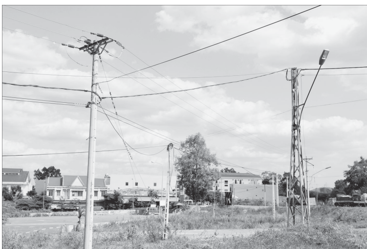
Đường điện ở khu vực Cửa khẩu Quốc tế Lê Thanh.

Dự án đầu tư xây dựng công trình mở rộng lưới điện các xã biên giới huyện Đức Cơ được khởi công xây dựng từ đầu tháng 9-2010. Dự án có tổng vốn đầu tư hơn 30 tỷ đồng, trong đó vốn của tổ chức JICA (Nhật Bản) là 19,87 tỷ đồng, số còn lại là vốn đối ứng từ ngân sách nhà nước, do UBND huyện Đức Cơ làm chủ đầu tư. Đến tháng 11-2011, dự án đã hoàn thành và đưa vào sử dụng. Sau 1 năm đưa vào sử dụng, dự án đã cho thấy tính hiệu quả đối với sự phát triển kinh tế-xã hội của các xã biên giới Đức Cơ.