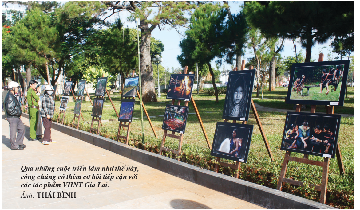
Qua những cuộc triển lãm như thế này, công chúng có thêm cơ hội tiếp cận với các tác phẩm VHNT Gia Lai.

Thành lập từ năm 1988, đến nay Hội VHNT Gia Lai có hơn 120 hội viên, trong đó có gần một nửa là hội viên các hội VHNT chuyên ngành Trung ương như Hội Nhà văn, Hội Nhạc sĩ, Hội Mỹ thuật, Hội Nghệ sĩ Nhiếp ảnh, Hội Văn nghệ Dân gian, Hội VHNT các dân tộc thiểu số... Được đánh giá là khá mạnh so với khu vực và quốc gia, Hội VHNT Gia Lai hiện đang “sở hữu” một số lượng lớn các tác giả thành danh, có nhiều ảnh hưởng trong cả nước. Bên cạnh đó, việc phát hiện và bồi dưỡng các