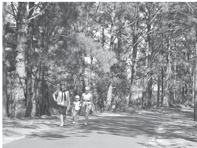
Du khách đi bộ, tự mình chinh phục đỉnh Lang Biang.

quyết tâm đến với nhau. Họ trở thành chồng vợ rồi bỏ đến một nơi trên đỉnh núi để sinh sống. Khi H’biang bị bệnh, K’lang đã tìm mọi cách chữa trị nhưng không khỏi. Chàng đành quay về báo cho buôn làng để tìm cách cứu nàng. Cha H’biang tức giận, cho rằng K’lang là con ma làm hại con ông. Buôn làng của H’biang kéo đến quyết tâm giết chết “con ma” K’lang