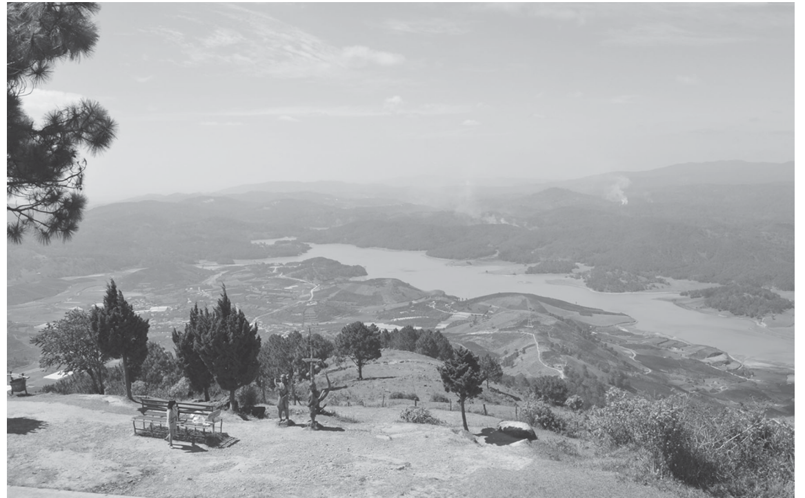
Dòng Dankia nhìn từ đỉnh Lang Biang.

để cứu H’biang nhưng cái kết bi thương là nàng H’biang chết do nàng đỡ mũi tên có tẩm thuốc độc nhắm thẳng vào K’lang. Đau buồn khôn xiết, K’lang đã khóc rất nhiều, nước mắt chàng tuôn thành suối lớn, ngày nay gọi là Đa Nhim (suối khóc). Sau cái chết của hai người, cha H’biang rất hối hận, ông