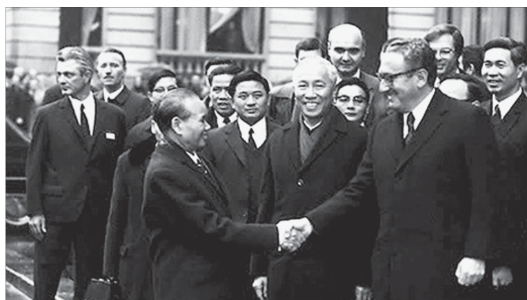
Các đồng chí: Bộ trưởng Ngoại giao Việt Nam Dân chủ Cộng hòa Xuân Thủy, Cố vấn Lê Đức Thọ gặp gỡ phái đoàn ngoại giao Hoa Kỳ tại Hội nghị Paris năm 1973.

Việc Mỹ dùng máy bay ném bom miền Bắc trong đó có thủ đô Hà Nội không phải là quá bất ngờ đối với Bác và Trung ương Đảng. Bởi trước đó, trong bức thư động viên cán bộ, chiến sĩ Đại đoàn pháo cao xạ 367 được thành lập (21-9-1954) để làm nhiệm vụ bảo vệ thủ đô Hà Nội, Chủ tịch Hồ Chí Minh đã nói “Hà