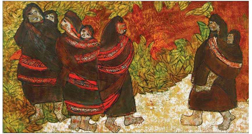
Tác phẩm “Suối nắng”.

- Có thể khẳng định như thế, bởi ngay khi chưa hết ngày triển lãm, nhưng phòng tranh Sắc màu Tây Nguyên được triển lãm tại Hội Mỹ thuật TP. Hồ Chí Minh từ ngày