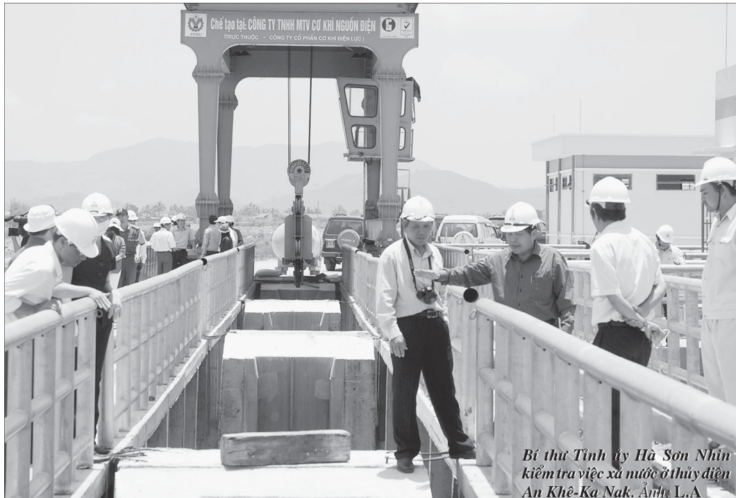
Bí thư Tỉnh ủy Hà Sơn Ninh kiểm tra việc xả nước ở thủy điện An Khê-Ka Nak.

BẮT NGUỒN TỪ ĐỈNH NÚI KON PLONG (TỈNH KON TUM), VỚI CHIỀU DÀI 388 KM, SÔNG BA CHẢY QUA CÁC TỈNH KON TUM, GIA LAI, PHÚ YÊN ĐẾN CỬA SÔNG ĐÀ RẰNG ĐỔ RA BIỂN LỚN. NGOÀI VẺ ĐẸP HÙNG VĨ VÀ NHỮNG GIÁ TRỊ VỀ LỊCH SỬ, VĂN HÓA CỦA NGƯỜI DÂN BẢN ĐỊA, SÔNG BA BÂY GIỜ CÒN ĐƯỢC BIẾT ĐẾN NHƯ MỘT “DÒNG SÔNG ĐIỆN”. TUY NHIÊN VIỆC XÂY DỰNG CÁC CÔNG TRÌNH THỦY ĐIỆN TRÊN DÒNG SÔNG NÀY ĐÃ PHÁT SINH NHIỀU HỆ LỤY.