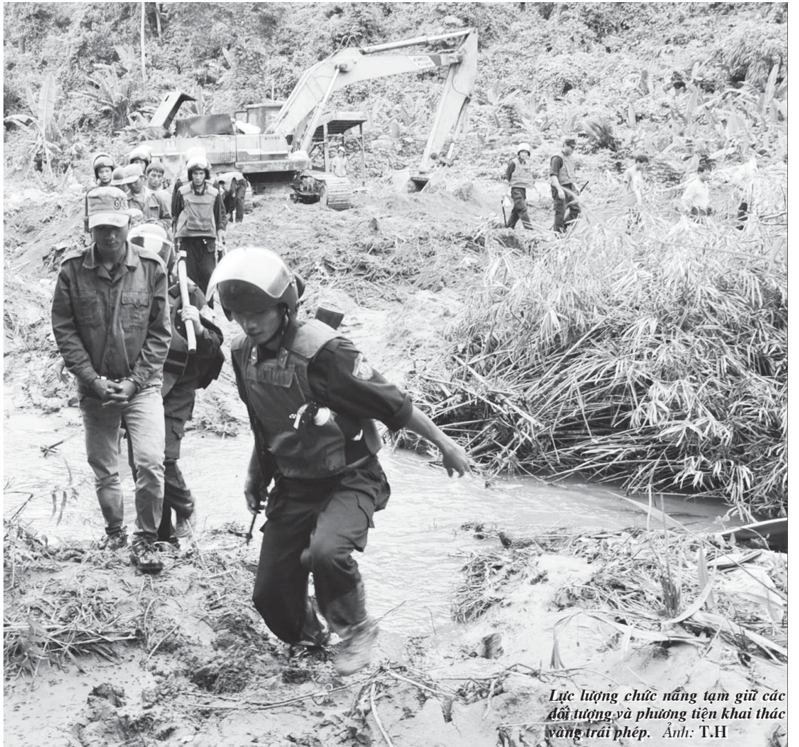
Lực lượng chức năng tạm giữ các đối tượng và phương tiện khai thác vàng trái phép.