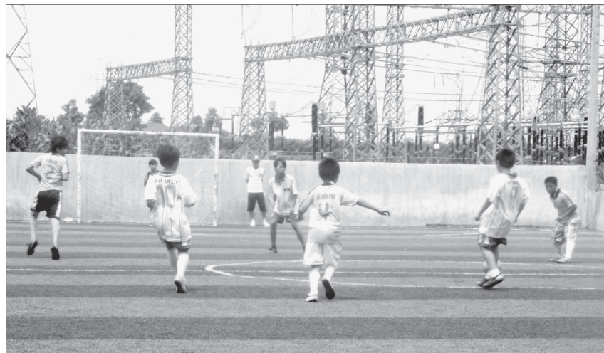
Sân bóng nằm trong hành lang an toàn lưới điện.