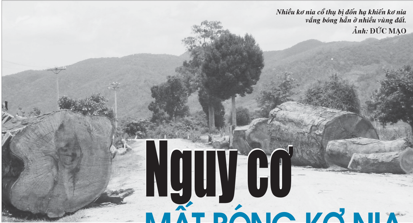
Nhiều cơ nia cổ thụ bị đốn hạ khiến cơ nia vắng bóng hẳn ở nhiều vùng đất.