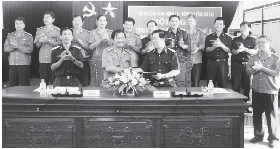
Lãnh đạo Công an tỉnh và Binh đoàn 15 ký kết quy chế phối hợp.

Thực hiện chỉ đạo của cấp trên, 2 năm qua, công tác xây dựng phong trào toàn