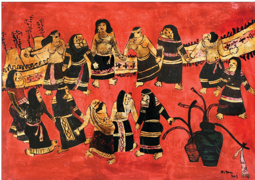
Tác phẩm “Vòng xoang ngày hội”.