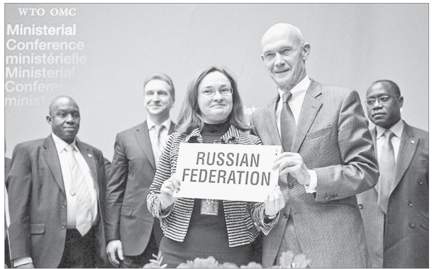
Lễ ký kết Nga gia nhập WTO ở Geneva, Thụy Sĩ hôm 16-12-2011.

trước đó đã không chấp nhận đề nghị của Tổng thống Barack Obama, trao cho Nga quy chế thương mại bình thường vĩnh viễn. Điều này rất quan trọng vì luật của WTO bắt buộc bất kỳ nước nào muốn được hưởng lợi ích từ tổ chức này phải áp dụng cùng quy tắc thương mại cho tất cả các quốc gia thành viên.