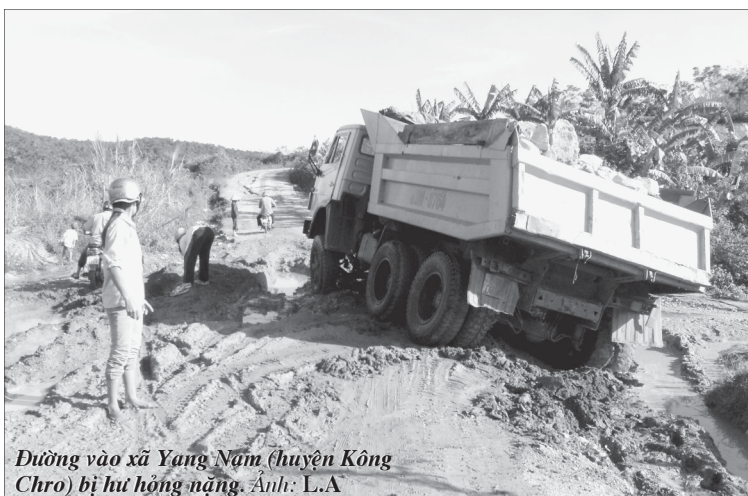
Đường vào xã Yang Nam (huyện Kông Chro) bị hư hỏng nặng.