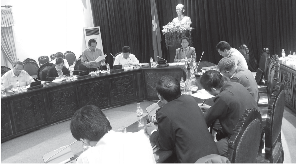
Ban Chỉ đạo 127 của tỉnh bàn kế hoạch kiểm tra, kiểm soát thị trường.