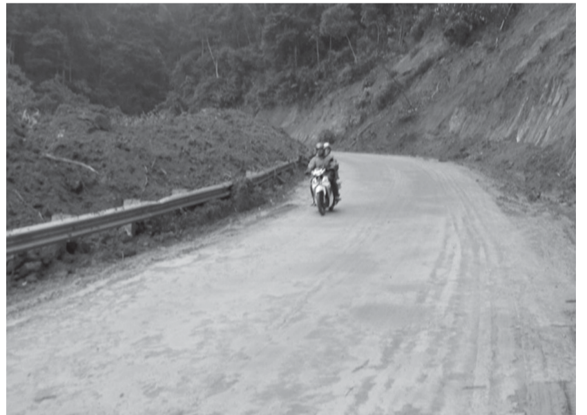
Đoạn đường thôn 2, xã Sơn Lang bị sạt lở nặng đã được khắc phục.