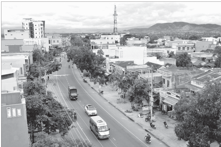
Một góc thị xã An Khê.