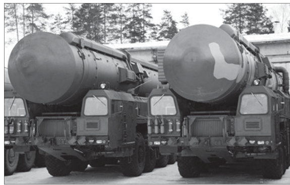
Tên lửa RT-2PM Topol của Nga.