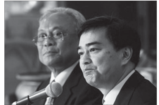
Cựu Thủ tướng Thái Lan Abhisit Vejjajiva (phải) và cựu Phó Thủ tướng Suthep Thaugsuban.