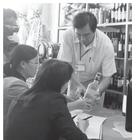
Kiểm tra một cơ sở kinh doanh rượu.

Chiều 11-12, đoàn đã tiến hành kiểm tra tại một số cơ sở kinh doanh rượu bia trên địa bàn TP. Pleiku. Điểm đến đầu tiên mà đoàn tổ chức kiểm tra là đại lý Xuân Nhân trên đường Võ Thị Sáu (06 Võ Thị Sáu). Theo ghi nhận của P.V, đại lý này bày bán rất nhiều sản phẩm rượu Vodka với nhiều thương hiệu, mẫu mã và chủng loại khác nhau nhưng tuyệt đối không có bán các sản phẩm rượu Vodka của Công ty cổ phần Xuất nhập khẩu 29 Hà Nội (gọi tắt là Công ty 29 Hà Nội). Sau khi tuyên truyền về tác hại của loại rượu này, đoàn kiểm tra đã đề nghị cơ sở kinh doanh không