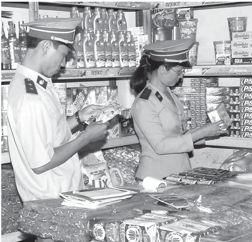
Kiểm tra nhãn mác hàng hóa.