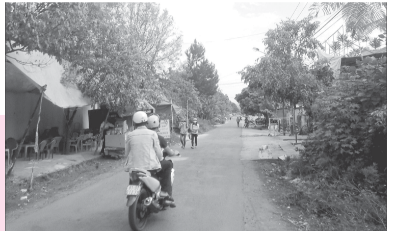
Đường Nguyễn Đường (TP. Pleiku).