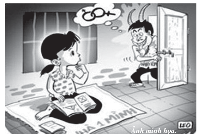
Ảnh minh họa.