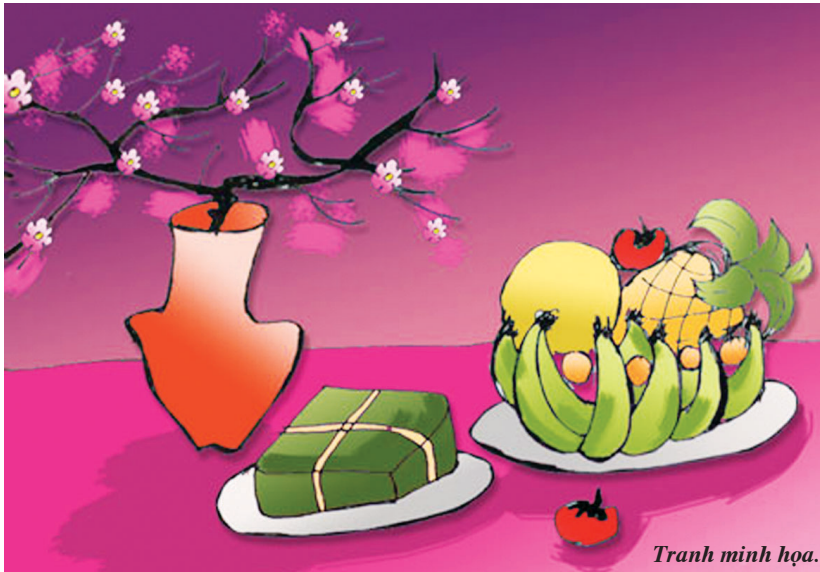
Tranh minh họa.

Với người dân Bình Định, ngày chạp mả (tảo mộ) có ý nghĩa tu sửa, trang hoàng lại mồ mả ông bà, nhất là đi qua mùa mưa bão trong năm để cùng con cháu đón Tết. Nó thể hiện lòng thành kính, hiếu thảo với ông bà tổ tiên, là dịp họ tộc xa gần quây quần bên nhau biết gốc tích, phân ngôi thứ nhằm tránh sự xung đột không đáng có như vẫn thường nói: “Đánh nhau vỡ đầu mới nhận ra anh em” và cả để tránh người trong họ lấy nhau.