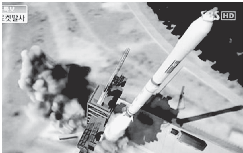
Truyền hình Hàn Quốc đưa hình ảnh mô phỏng Triều Tiên phóng tên lửa.

Động thái phóng tên lửa có thể là sự thể hiện của Triều Tiên cho thấy tiềm lực và năng lực tên lửa của họ trước những cuộc đàm phán mới, để Bình Nhưỡng ở một vị thế mặc cả tốt hơn khi các chính quyền xung quanh đã ổn định sau chuyển giao và những nỗ lực ngoại giao được nối lại. Vụ phóng thử cũng sẽ gây ra tác động ở Hàn Quốc dù ứng viên nào có thắng trong cuộc bầu cử sắp tới, nhiều khả năng họ cũng sẽ không tiếp