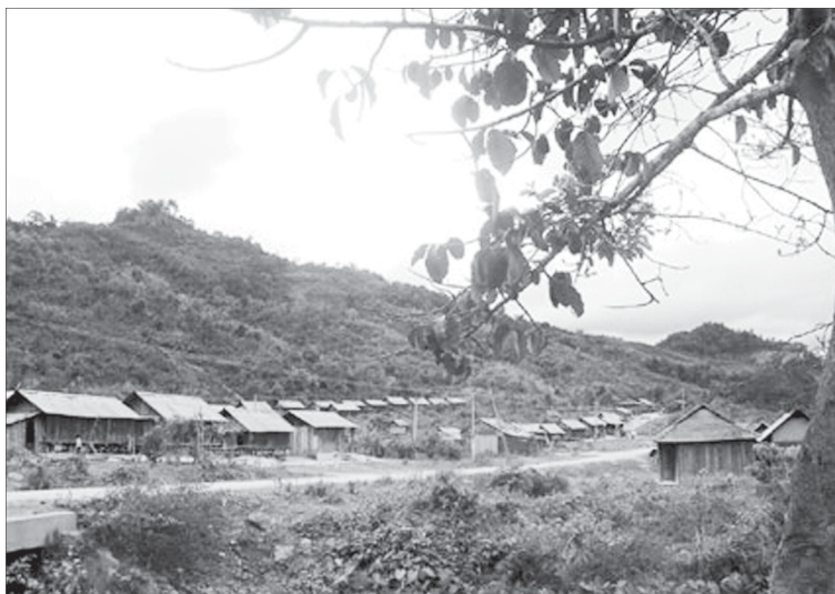
Khu dân cư ở Kon Pne (Kbang).