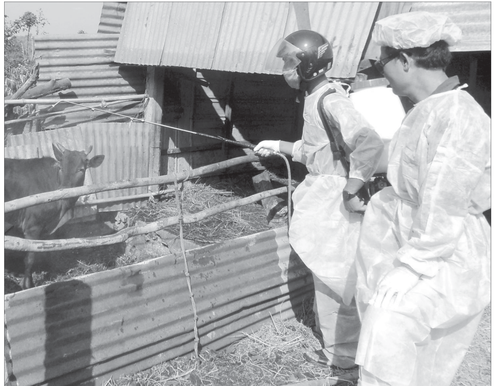
Tiêu độc khử trùng, vệ sinh môi trường chăn nuôi.