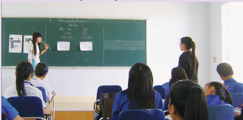
Một giờ tập giảng của sinh viên Trường Cao đẳng Sư phạm Gia Lai.

Nhiều người cho rằng cách dạy học văn hiện nay là “đồng phục hóa” các bài giảng và bài làm môn văn. Tất tần tật đều theo sách giáo khoa và sách giáo viên hoặc thiết kế bài giảng. Nhiều cán bộ quản lý chuyên môn còn yêu cầu giáo viên xem sách giáo khoa là pháp lệnh. Do vậy, giáo viên lên lớp phải cố “chạy” cho hết giáo án mà chẳng biết học sinh ngồi dưới có nghe, có hiểu gì không. Hiện nay hiếm khi chúng ta bắt gặp những tiết giảng văn của thầy mà trò say sưa nuốt từng lời văn, câu thơ như Trần Đăng Khoa mô tả “em nghe thầy đọc bao ngày, tiếng thơ đỏ nắng xanh cây quanh