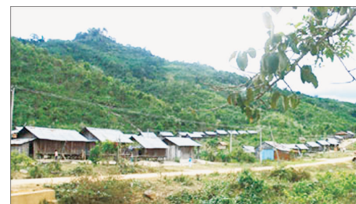
Thầy Trương Tấn Sỹ đến tận làng vận động học trò ra lớp.