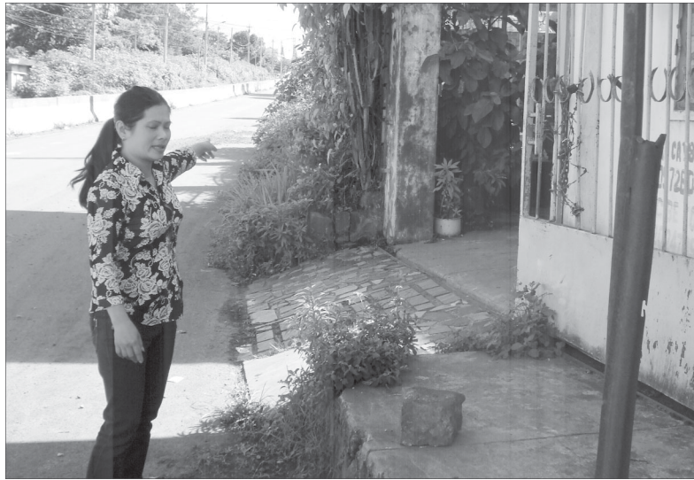
Phần diện tích đất hỗ trợ bồi thường đã được đo đạc lại từ phần móng cũ này trở vào.