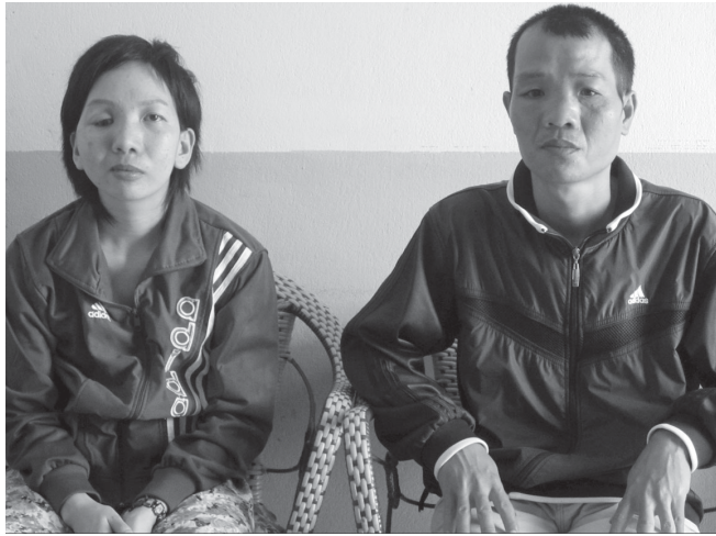
Khuôn mặt của vợ chồng chị Trâm bị biến dạng.