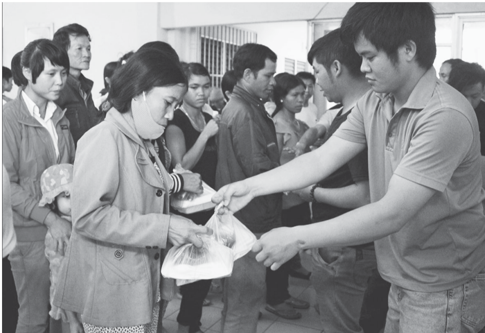
Các thành viên trao cơm tận tay cho người nhà bệnh nhân..