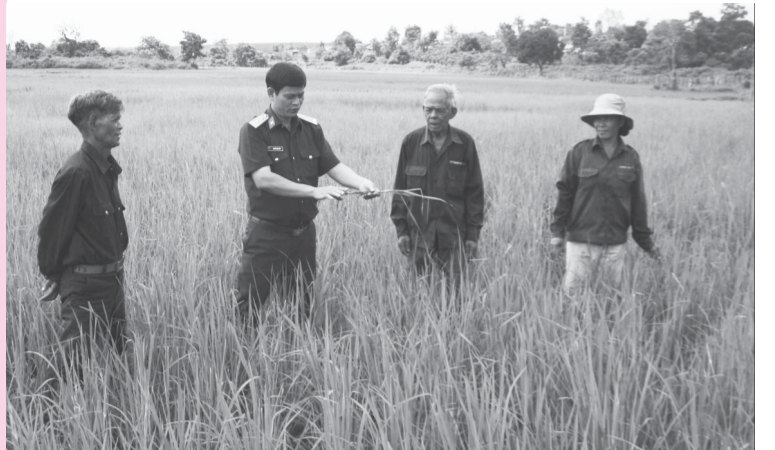
Công ty TNHH một thành viên 72 giúp người dân Ia Nan làm lúa nước.