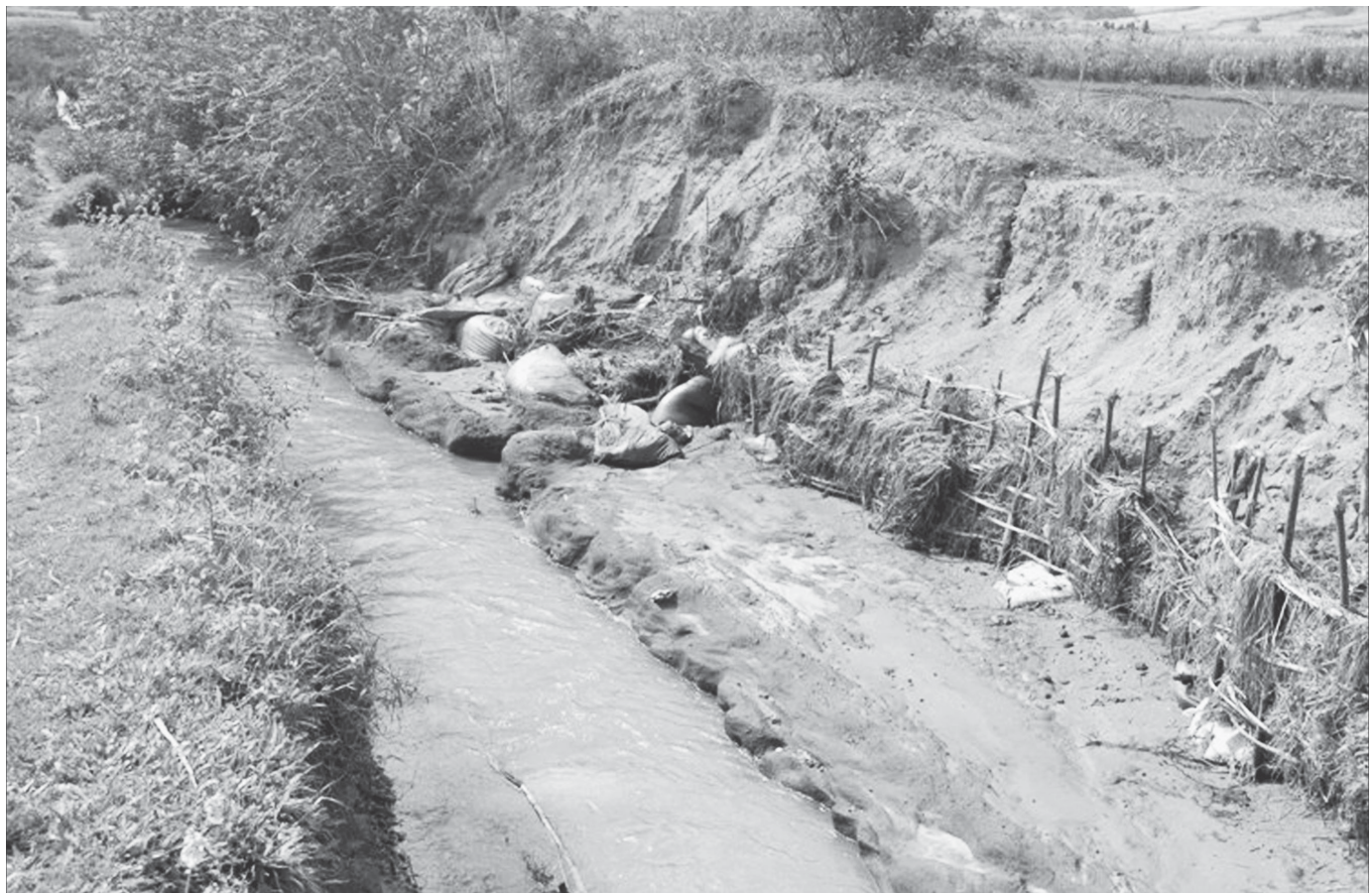
Một đoạn kênh bị sạt lở sau mưa, lũ.