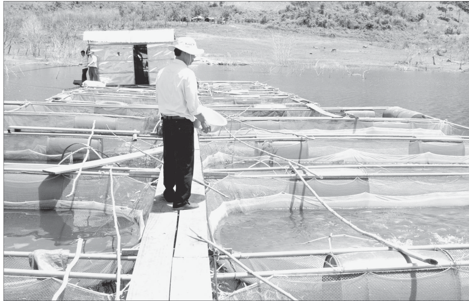
Nuôi cá lồng trên hồ Ka Nak.