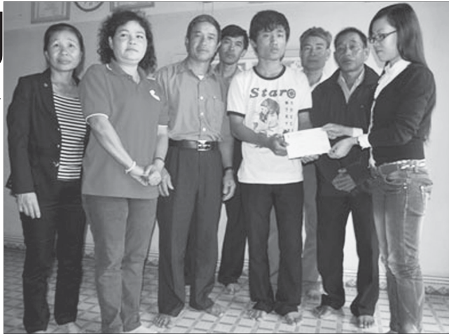
Trao tiền do bạn đọc Báo Gia Lai ủng hộ 3 anh em mồ côi (xã Ia Blang, huyện Chư Sê).

Năm 2011, Hội Chữ thập đỏ tỉnh cung cấp thông tin và