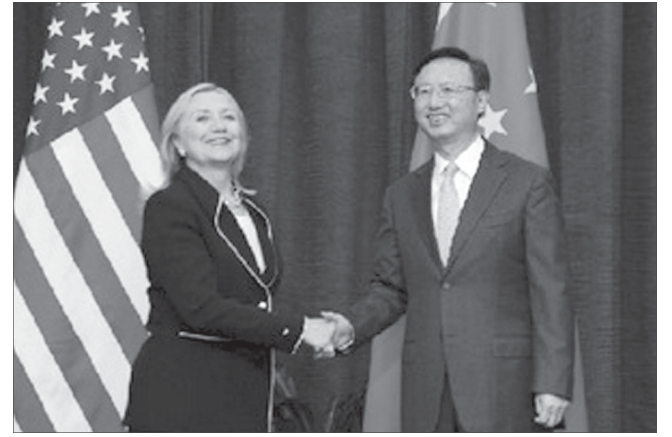
những tranh cãi về lãnh hải, đồng thời khuyến khích các quốc gia Đông Nam Á giữ vững tinh thần đoàn kết.

Về phần mình, Ngoại trưởng Mỹ Hillary Clinton nói với Trung Quốc rằng việc đạt được Bộ quy tắc ứng xử giữa các bên trên biển Đông (COC) là phù hợp với “lợi ích của tất cả các bên”. Bà Hillary cũng bày tỏ hy vọng rằng Bắc Kinh sẽ nhất trí thực hiện COC liên quan tới