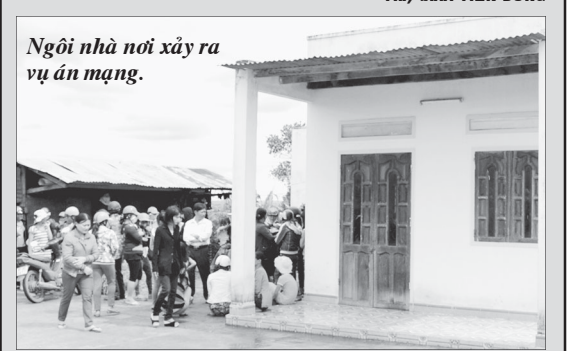
Ngôi nhà nơi xảy ra vụ án mạng.