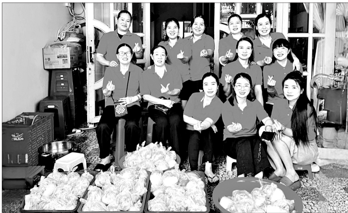
Nhóm Bếp thiện nguyện Từ Tâm chuẩn bị suất ăn phát cho người có hoàn cảnh khó khăn.

Trước mỗi đợt nấu, các chị em trong nhóm mua nguyên