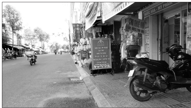
Trưng bày sản phẩm, buôn bán ngay trên vỉa hè tuyến QL 1, đoạn qua phường Bình Định và An Nhơn.

Đơn cử, tuyến hành lang ATGT dọc QL 1 đoạn qua địa bàn xã Tuy Phước - từ khu vực cầu Ông Đô đến cầu Gành đã bị nhiều hộ dân chiếm dụng làm nơi trưng bày đôn, chậu cảnh bằng xi măng từ nhiều năm nay. Dọc tuyến QL 1 qua địa bàn các phường Bình Định, Bồng Sơn, Tam Quan, các xã Hòa Hội, Phù Cát, Phù Mỹ Bắc, Bình Dương..., nhiều người ngang nhiên đặt chậu cảnh, bảng hiệu quảng cáo, bày biện sản phẩm trong phạm vi hành lang ATGT đường bộ, thậm chí có nơi còn lấn ra lòng đường.