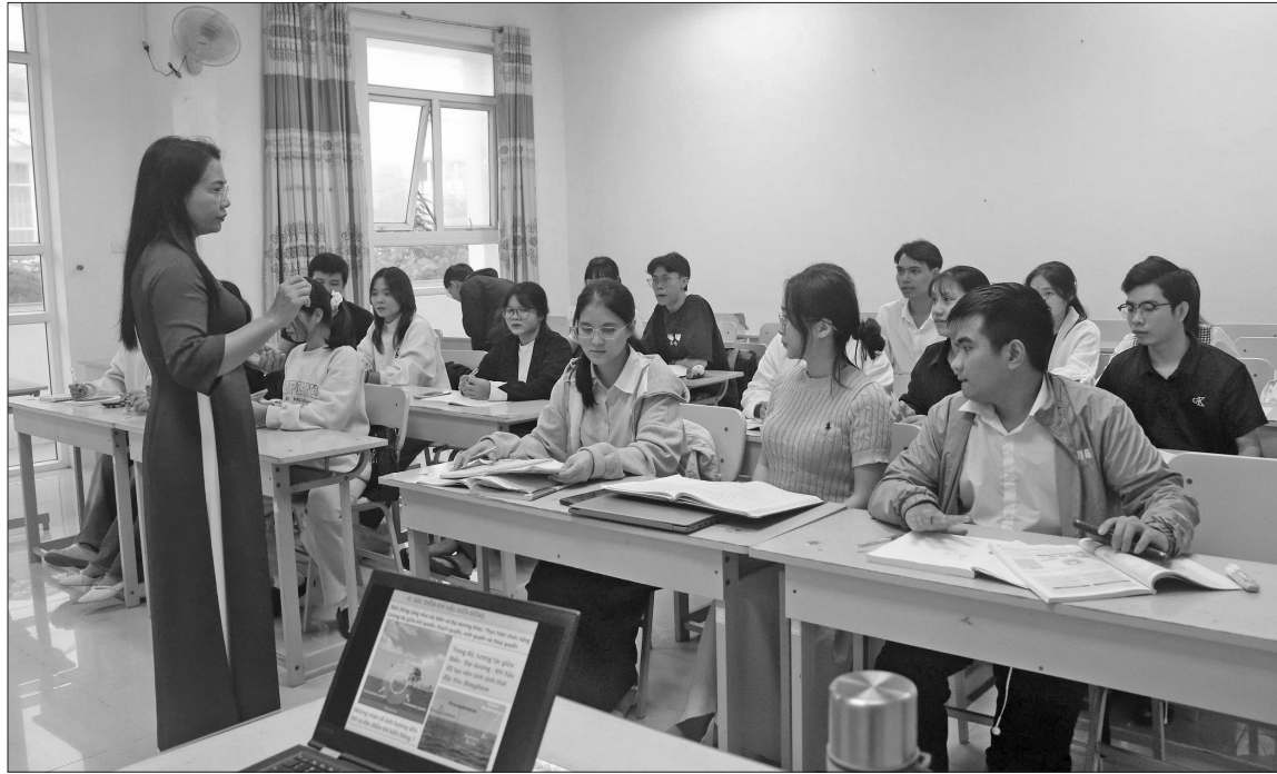
Một buổi học lý thuyết trên lớp của sinh viên Trường Đại học Quy Nhơn.