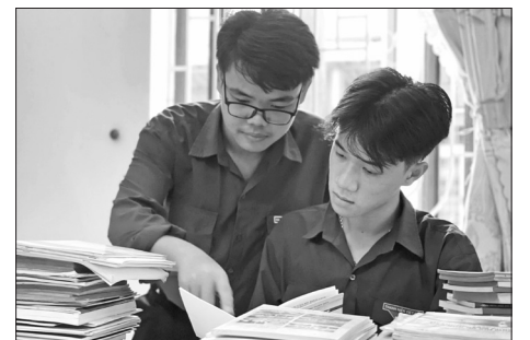
Xã Tuy Phước xây dựng "Tủ sách hy vọng" góp phần lan tỏa văn hóa đọc trong cộng đồng, nhất là trong thanh thiếu nhi.