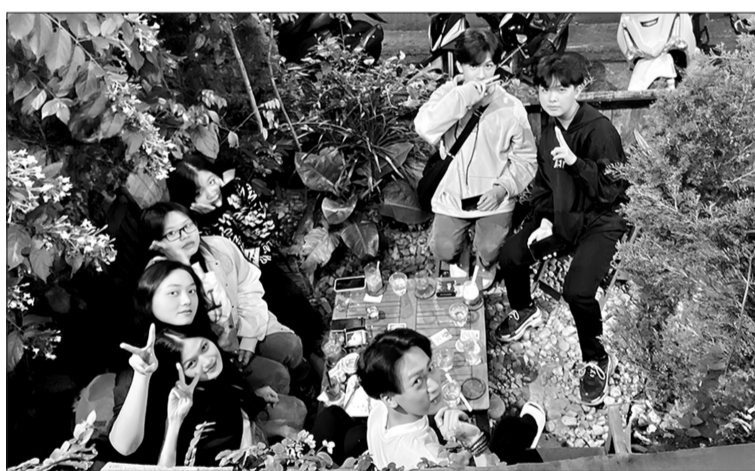
Giới trẻ Pleiku tụ họp tại quán cà phê đêm giữa không gian sương lạnh.

Với nhiều người trẻ, cà phê buổi tối không chỉ là thói quen mà còn như một "trạm dừng cảm xúc". Trong không gian