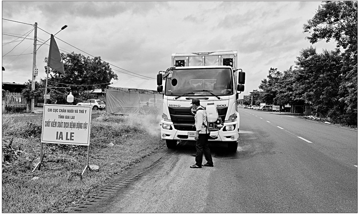
Lực lượng thú y làm việc tại chốt kiểm dịch Ia Le phun thuốc sát trùng xe vận chuyển động vật ra vào tỉnh.

Đặc biệt, chốt kiểm dịch Bình Đê được xác định là điểm giám sát trọng yếu. Ông Đỗ Văn Luật, Trưởng Trạm kiểm dịch động vật Cù Mông, đơn vị phụ trách chốt này, cho hay: "Trung bình mỗi ngày, chốt kiểm tra khoảng 5 xe chở động vật, sản phẩm động vật, chủ yếu từ các tỉnh phía Bắc vào. Từ ngày 16 đến 20.7, chúng tôi đã kiểm tra 17 xe chở 5.154 con gia súc, chủ yếu là xe vận chuyển heo vào tỉnh; còn phương tiện từ tỉnh ra Bắc, đã kiểm tra 124 xe chở 8.226 con gia súc, 104.500 con gà con và 15.907 kg sản phẩm động vật. Tất cả đều có biên bản kiểm dịch, niêm phong kẹp chì và đảm bảo vệ sinh thú y theo đúng quy định".