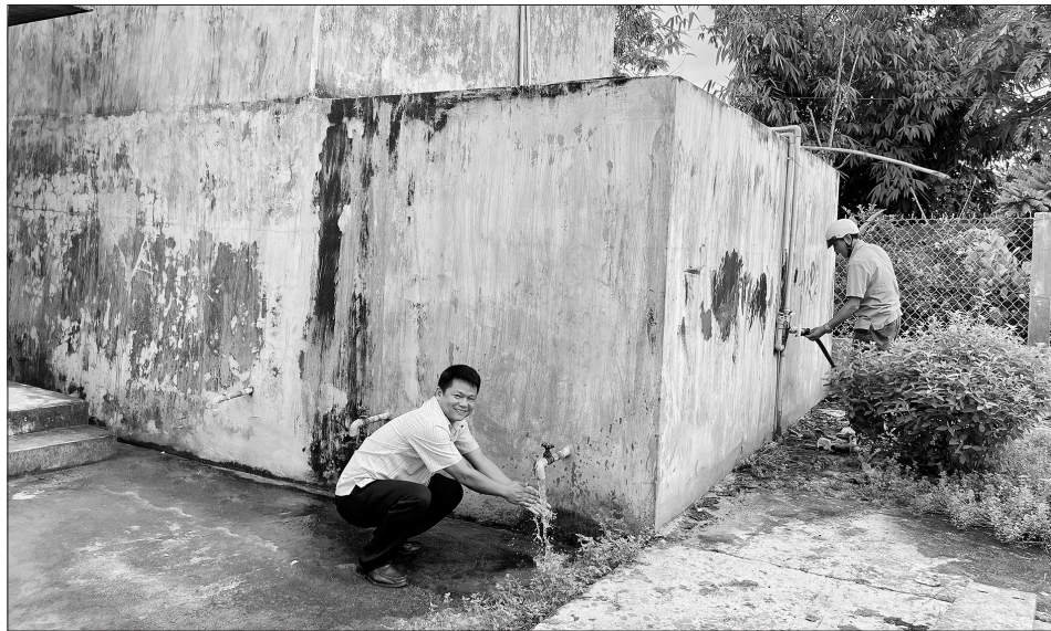
Công trình cung cấp nước sạch tập trung góp phần làm thay đổi rõ rệt diện mạo nông thôn và nâng cao chất lượng cuộc sống của người dân xã Ia Púch.

Xã Ia Púch hiện có 4 thôn, làng với khoảng 940 hộ, trong đó đồng bào dân tộc thiểu số chiếm 46%. Không còn phải