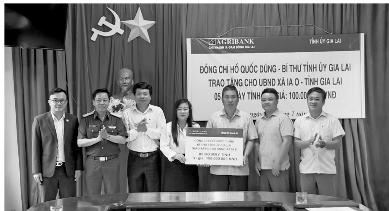
Đại diện lãnh đạo Văn phòng Tỉnh ủy trao tặng 5 bộ máy vi tính cho UBND xã Ia O.