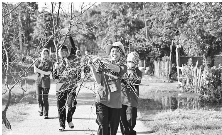
Sinh viên Trường Đại học Công thương TP Hồ Chí Minh dọn vệ sinh đường làng ở xã Ia Mơ.

Còn tại xã Al Bá, 36 sinh viên tình nguyện đến từ Trường ĐH Sư phạm TP Hồ Chí Minh cũng đang miệt mài mang tri thức và