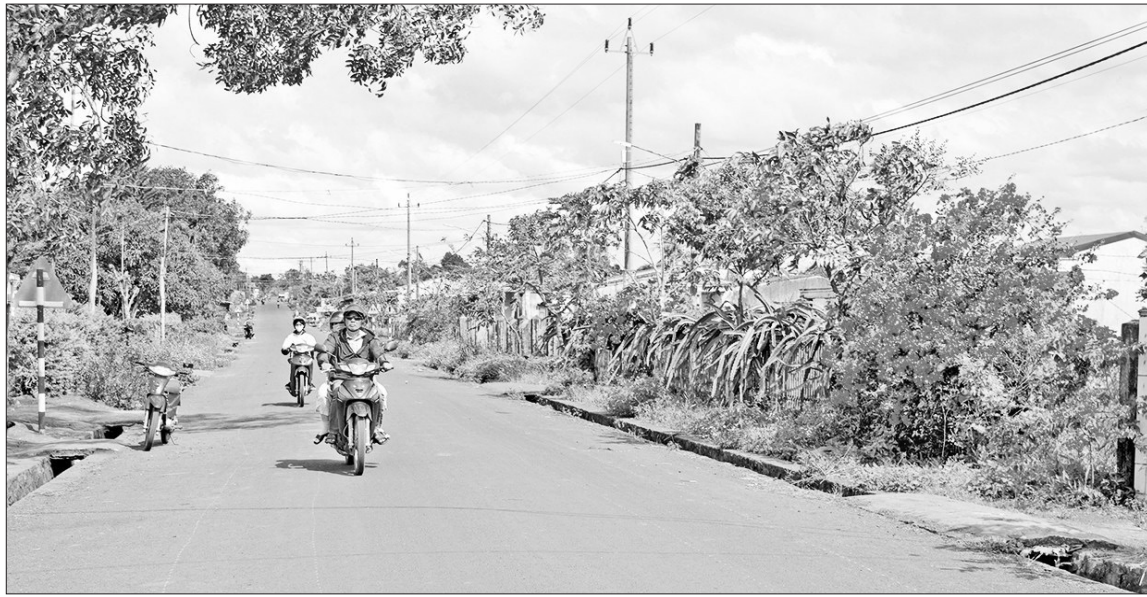
Nhờ thay đổi nếp nghĩ, cách làm, diện mạo nhiều làng đồng bào dân tộc thiểu số đã khởi sắc.

Trong tiến trình thay đổi nếp nghĩ, cách làm, bà con cũng dần