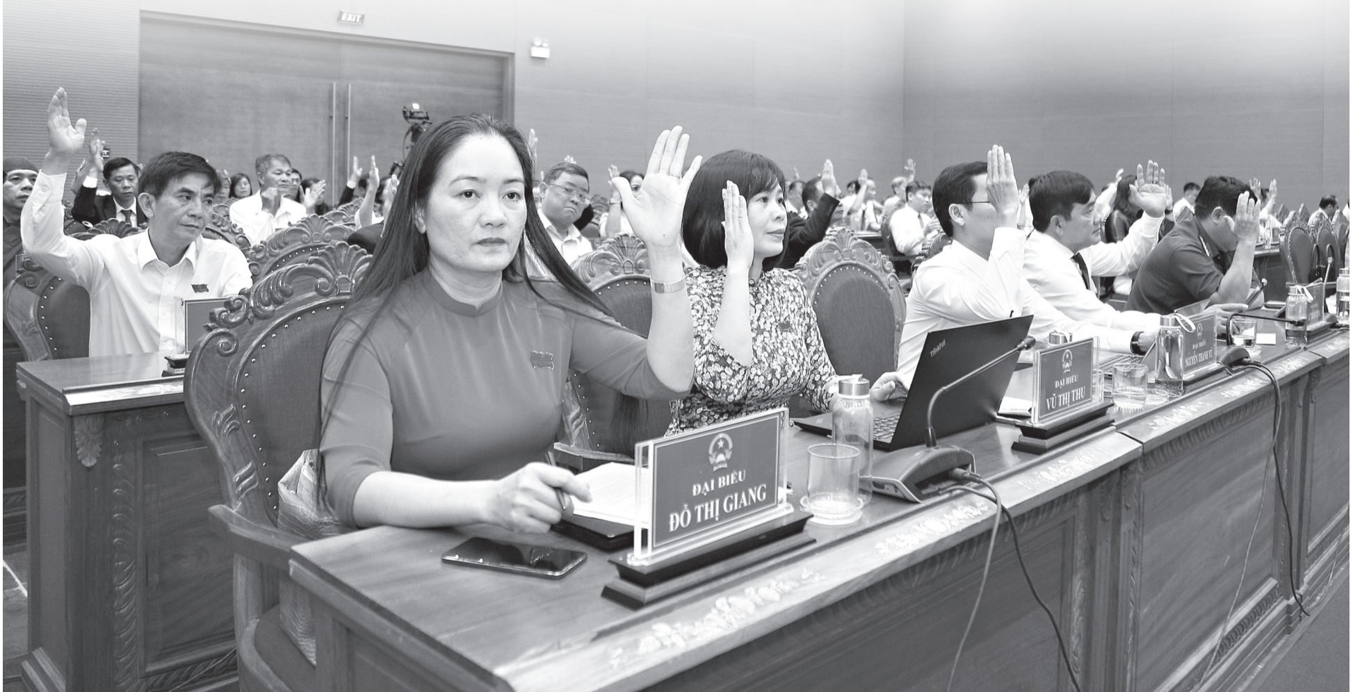
Đại biểu HĐND tỉnh biểu quyết thông qua các nghị quyết trình kỳ họp.

Kịp thời tháo gỡ các khó khăn, vướng mắc, khơi thông các điểm nghẽn để tăng trưởng phát triển kinh tế - xã hội 6 tháng cuối năm 2025; tăng mức hỗ trợ cán bộ về công tác tại xã đảo Nhơn Châu; có chính sách hỗ trợ hộ chăn nuôi thiệt hại do bệnh viêm da nổi cục trên đàn gia súc... là những vấn đề được các đại biểu HĐND tỉnh đặt ra tại kỳ họp thứ 2 HĐND tỉnh Gia Lai khóa XII, nhiệm kỳ 2021 - 2026, diễn ra ngày 22.7. ▶ 2