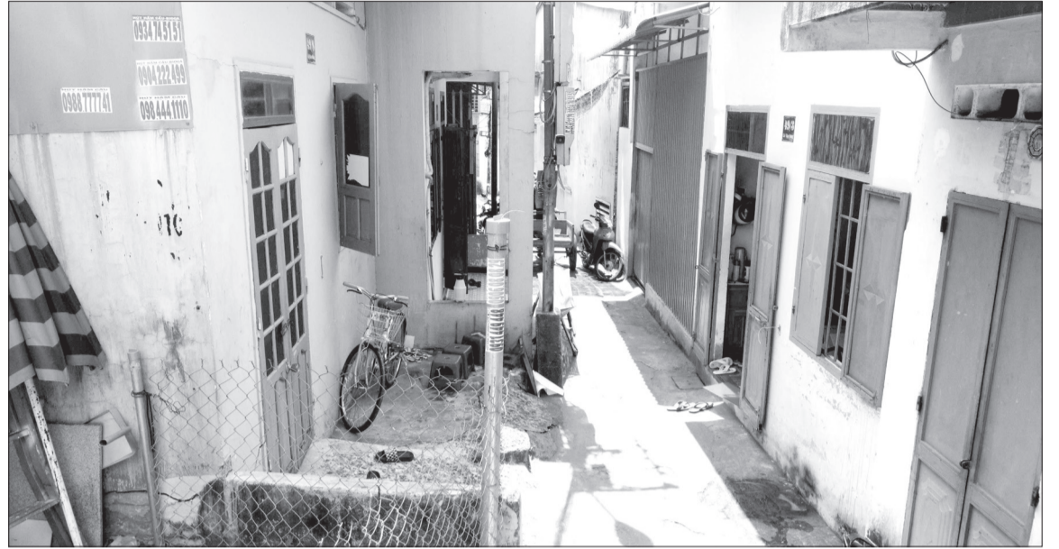
Khu nhà dân trong vùng ảnh hưởng đầu tư Dự án tuyến đường Ngô Mây nối dài đi qua địa bàn phường Ngô Mây.