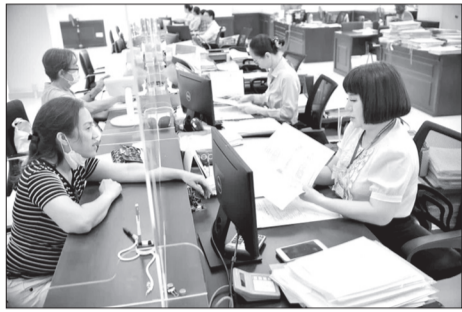
Người dân làm thủ tục nhà đất tại TP Thủ Đức.

Sở Nội vụ TP Hồ Chí Minh vừa có tờ trình UBND TP Hồ Chí Minh phê duyệt đề án sắp xếp, bố trí và thực hiện chế độ chính sách cho cán bộ, công chức, viên chức, người hoạt động không chuyên trách, người lao động sau sắp xếp bộ máy.