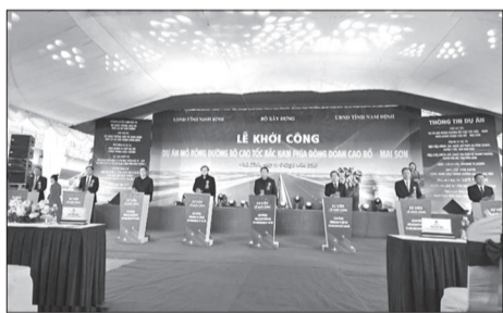
Lễ khởi công dự án mở rộng đường bộ cao tốc Cao Bồ - Mai Sơn.

Ngày 7.3, tại Ninh Bình, Bộ trưởng Bộ Xây dựng Trần Hồng Minh đã phát lệnh khởi công dự án mở rộng đường bộ cao tốc Bắc - Nam phía Đông, đoạn Cao Bồ - Mai Sơn từ 4 lên 6 làn xe, tổng đầu tư 1.900 tỷ đồng.