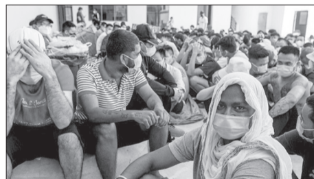
Chính phủ Thái Lan dự định sẽ đẩy mạnh hồi hương 1.500 nạn nhân của các khu phức hợp lừa đảo trực tuyến bất hợp pháp trên biên giới Thái Lan - Myanmar.

Một số quốc gia như Indonesia cũng đã đưa công dân về nước với sự hỗ trợ của Thái Lan. Tuy nhiên vẫn còn hàng nghìn người chờ hồi hương tại các trại tạm giữ ở biên giới, bao gồm công dân những nước châu Phi không có cơ quan ngoại giao tại Thái Lan.