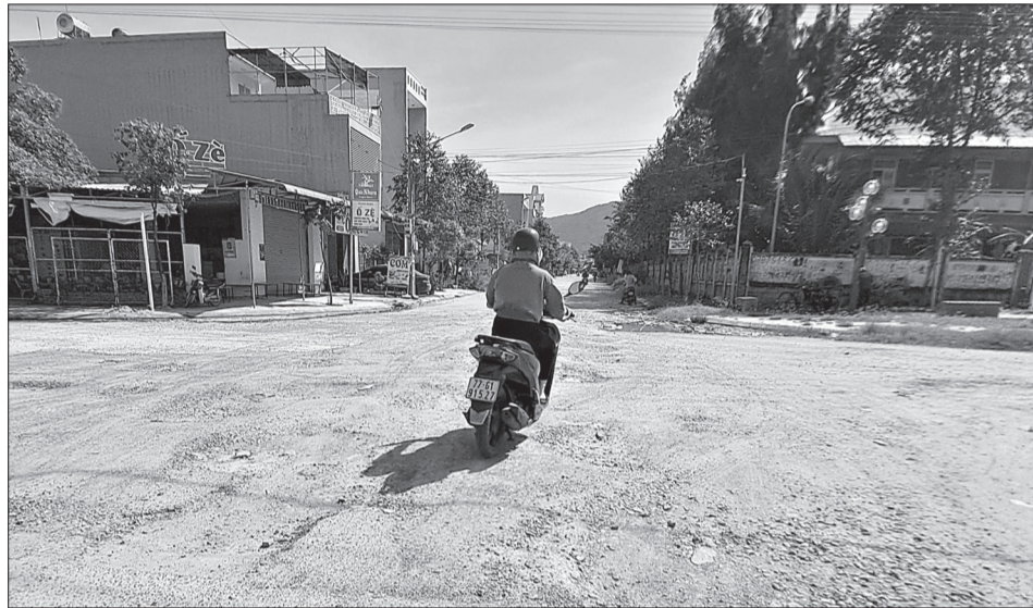
Ổ gà, ổ voi xuất hiện dày đặc trên đường Nguyễn Diêu.