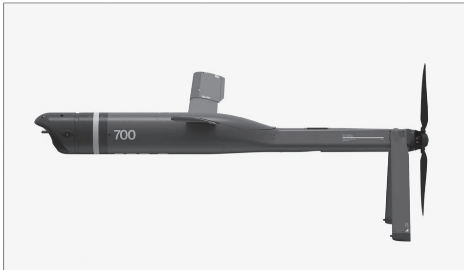
Một máy bay không người lái "tự sát" của Anduril UK đang hoạt động.

Quyết định của Anh được đưa ra sau khi Tổng thống Mỹ Donald Trump quyết định ngừng viện trợ quân sự và chia sẻ thông tin tình báo với Ukraine. Tuyên bố của Bộ trưởng Quốc phòng Anh cho biết nước này đã cung cấp hơn 10.000 drone cho LLVT Ukraine và số thiết bị bay không người lái này đã chứng minh được tầm quan trọng trên chiến trường. Ông Healey khẳng