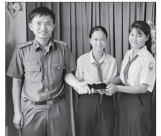
Hai học sinh trao điện thoại nhặt được cho CA xã Mỹ Đức.

Ngay khi tiếp nhận vụ việc, bằng các biện pháp nghiệp vụ, CA xã Phước An đã nhanh chóng xác minh