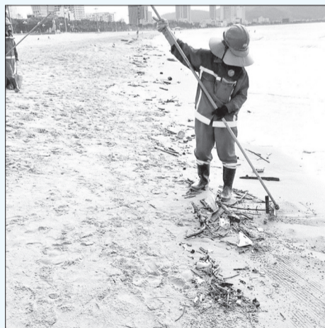
Nhân viên Công ty CP Môi trường Bình Định dọn dẹp rác tại bãi biển Quy Nhơn.

Tại các công viên và khu vực bãi biển dọc theo đường Xuân Diệu (TP Quy Nhơn), không ít người vứt bừa bãi hộp, ly nhựa đựng thức ăn, đồ uống; bao bì ny lông; thùng xốp... ra bãi cỏ hoặc xuống biển. Đây cũng là tình trạng chung mà nhiều bãi biển khác trên địa bàn tỉnh