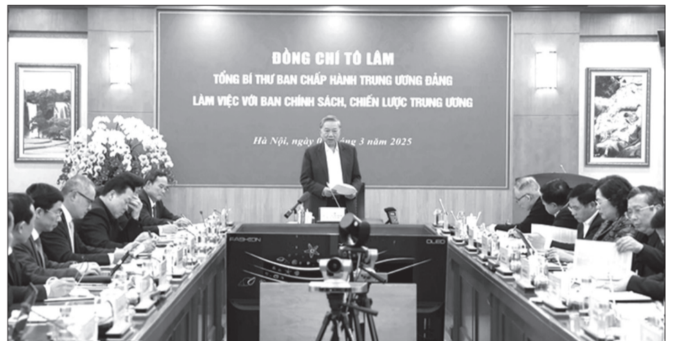
Quang cảnh buổi làm việc.

Đồng thời, có tính tới những biến đổi của địa kinh tế, địa chính trị thế