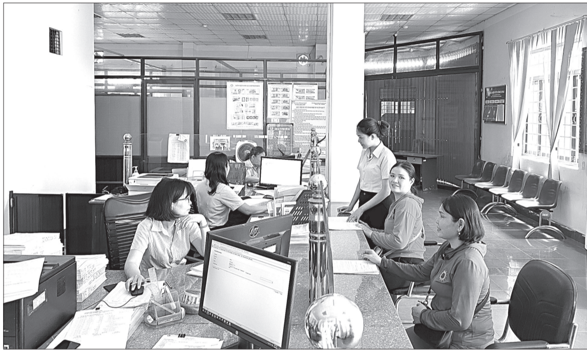
Người dân thực hiện thủ tục vay vốn tại Ngân hàng CSXH TX Hoài Nhơn.