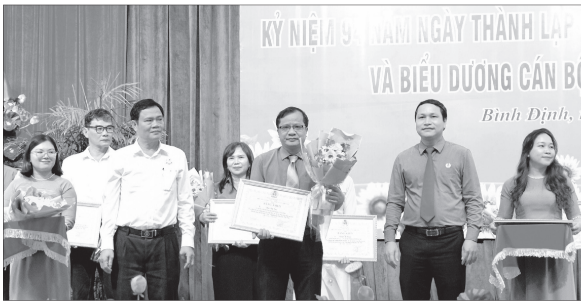
LĐLĐ tỉnh biểu dương cán bộ công đoàn tiêu biểu nhân dịp kỷ niệm 94 năm ngày thành lập tổ chức Công đoàn Việt Nam (28.7.1929 - 28.7.2023).

Nhằm khắc phục tình trạng khen thưởng "tích lũy thành tích, cộng dồn thành tích", LTĐKT bổ sung nguyên tắc "thành tích đến đâu khen thưởng đến đó (điểm c khoản 2 Điều 5), được thể hiện trong các điều, khoản của từng hình thức khen thưởng quy định trong