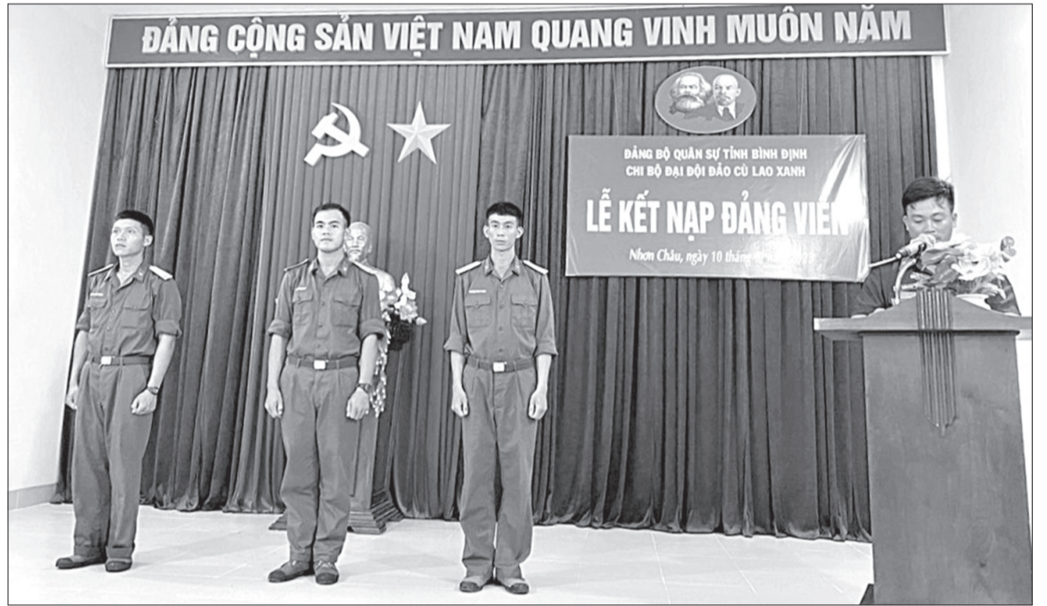
Phát triển Đảng trong quân đội phải thực hiện tốt phương châm “số lượng đi liền với chất lượng”.

- Trong ảnh: Lễ kết nạp đảng viên là chiến sĩ đang thực hiện nghĩa vụ quân sự tại Đại đội Hỗ trợ đảo Cù Lao Xanh.