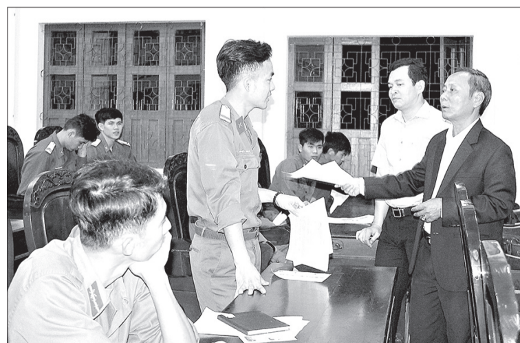
Tuyên truyền, tư vấn việc làm cho quân nhân xuất ngũ.