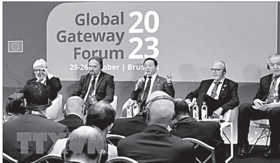
Phó Thủ tướng Trần Hồng Hà phát biểu tại phiên đối thoại cấp cao về Chuyển đổi Năng lượng Xanh và Hydrogen Xanh.

Phát biểu tại phiên đối thoại cấp cao về Chuyển đổi Năng lượng Xanh và hydrogen Xanh, Phó Thủ tướng Chính phủ Trần Hồng Hà đánh giá Chiến lược Cửa ngõ Toàn cầu của EU đã đi vào giai đoạn triển khai thiết thực, đề xuất nhiều biện pháp cụ thể và kỹ thuật.