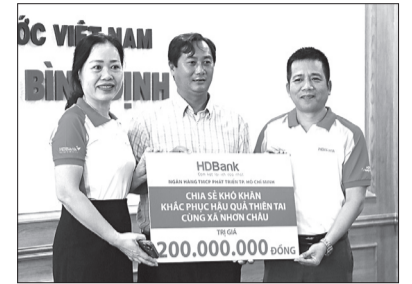
Đại diện HDBank Bình Định trao tiền hỗ trợ cho lãnh đạo xã Nhơn Châu.