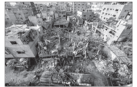
Cảnh đổ nát sau các vụ oanh tạc của Israel xuống thị trấn Khan Yunis, phía Nam Dải Gaza ngày 25.10.2023.

Ngày 25.10, Nga và Trung Quốc đã phủ quyết dự thảo nghị quyết về xung đột Israel - Hamas do Mỹ đề xuất tại Hội đồng Bảo an LHQ, cho rằng dự thảo không kêu gọi ngừng bắn hoàn toàn.