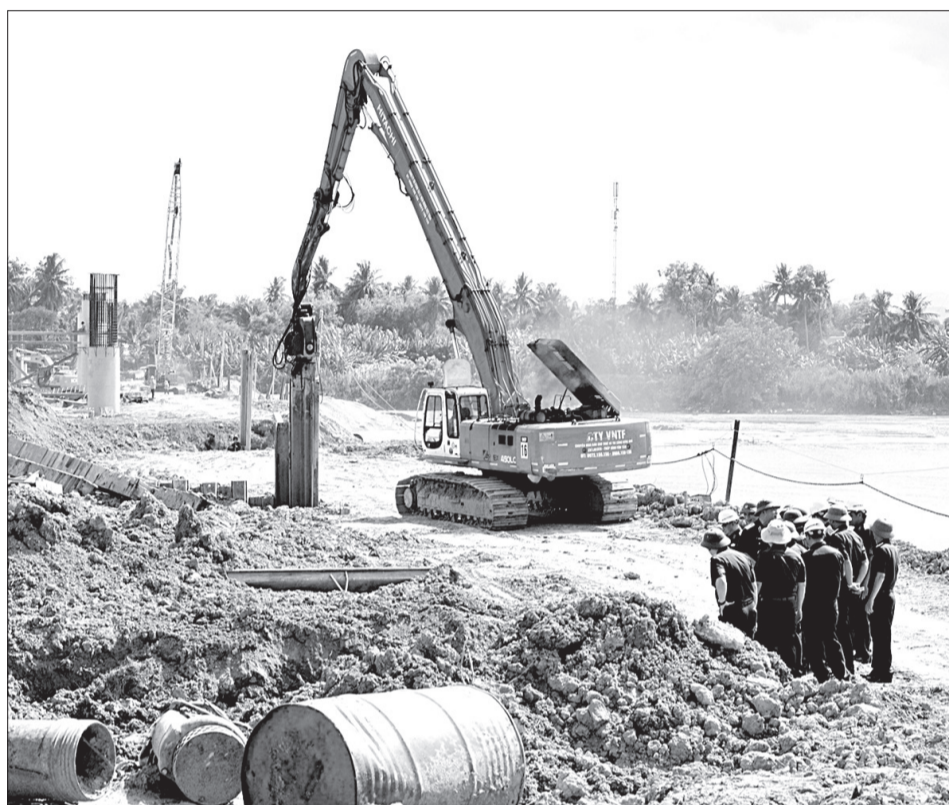
Lãnh đạo các nhà thầu tăng cường kiểm tra việc đảm bảo tiêu thoát nước, chống nguy cơ ngập úng tại các công trường thi công.

Trên đoạn tuyến Hoài Nhơn - Quy Nhơn, Ban điều hành Trường Sơn 5 (Tổng công ty Xây dựng Trường Sơn) đã thành lập Ban chỉ huy phòng chống thiên tai, bão lụt gồm 12 thành viên, do Giám đốc Ban điều hành làm trưởng ban. Ban đang thực hiện 8 mũi thi công. Trong đó mũi thi công 5 thi công cầu Ân Phong 2 và cầu Hóc Kỳ; mũi 6 thi công phần tuyến km 21+00 - km 23+500 và cầu Ân Phong 1 tuyến chính; mũi 7 thi công phần cầu của 9 cầu; mũi 8 thi công phần cầu Hóc Sim và cầu Ân Tường Đông.