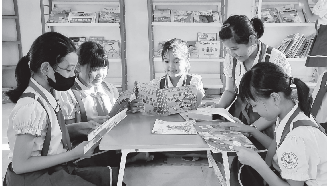
Học sinh trường Tiểu học số 1 Cát Trinh đọc sách, chơi cờ tại thư viện.