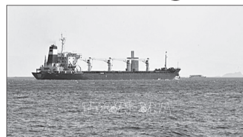
Tàu chở ngũ cốc của Ukraine đi qua Eo biển Bosphorus ở Istanbul, Thổ Nhĩ Kỳ.