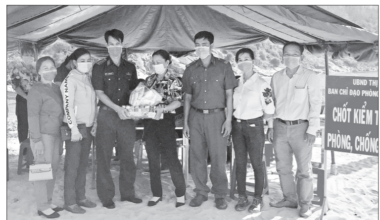
Tặng quà chốt kiểm soát dịch Covid-19 tại Cảng cá Tam Quan (TX Hoài Nhơn).

• Sáng 26.8, Hội LHPN TX Hoài Nhơn phối hợp với Công ty TNHH Sinh Phát, Hội Phụ nữ phường Hoài Hương và Hoài Tân đã đến thăm, tặng quà cho cán bộ, chiến sĩ, nhân viên y tế chốt kiểm soát dịch Covid-19 tại Cảng cá Tam Quan. Phần quà gồm 500 khẩu trang và một số nhu yếu phẩm như nước đóng chai, sữa các loại, trái cây... với tổng giá trị 8 triệu đồng. Đây là hoạt động thiết thực, góp phần động viên cán bộ, chiến sĩ, nhân viên y tế trực chốt có thêm động lực hoàn thành tốt nhiệm vụ phòng, chống dịch bệnh Covid-19.