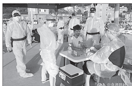
Giới chức Đài Loan kiểm tra y tế nhóm người Việt bị bắt với cáo buộc nhập cư lậu và buôn người.