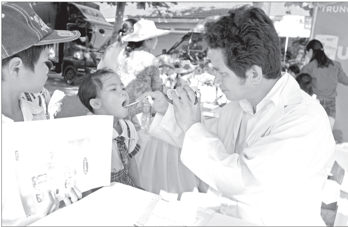
Bình Định đặt mục tiêu 100% đối tượng học sinh, sinh viên tham gia BHYT trong năm 2020.

Ngày 20.8, BHXH tỉnh và Sở GD&ĐT đã ban hành hướng dẫn liên ngành về thực hiện BHYT học sinh, sinh viên năm học 2020 - 2021. Trong đó, quy định cụ thể về mức đóng, phương thức đóng, hạn