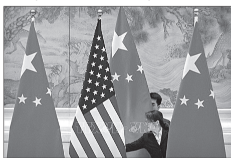
Quốc kỳ Trung Quốc và quốc kỳ Mỹ trước một phiên thảo luận về thỏa thuận thương mại Mỹ-Trung ở Bắc Kinh, Trung Quốc.

Bộ Thương mại Trung Quốc cũng xác nhận rằng hai bên đã có một "cuộc đối thoại mang tính xây dựng" và nhất trí tiếp tục thúc đẩy hướng tới việc thực thi Thỏa thuận thương mại giai đoạn 1 nói trên.