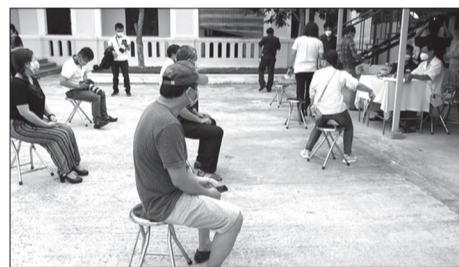
Tất cả công dân rời vùng dịch Đà Nẵng về các tỉnh, thành khác trong cả nước đều được xét nghiệm Covid-19 trước khi về địa phương.

khỏi Đà Nẵng thì không phải đăng ký lại. Trước đó, giữa tháng 8 đã có 7 chuyến bay đưa hơn 1.500 du khách mắc kẹt tại Đà Nẵng do dịch Covid-19 về Hà Nội,