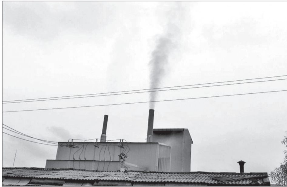
Ông khói của nhà máy sản xuất viên nén nhiên liệu sinh học rắn tại CCN Đại Thạnh phát ra trụ khói có màu đen (ảnh chụp ngày 20.8).

Còn theo Phòng TN&MT huyện Phù Mỹ, sau khi kiểm tra, ngành chức năng đã đề nghị Công ty có biện pháp khắc phục,