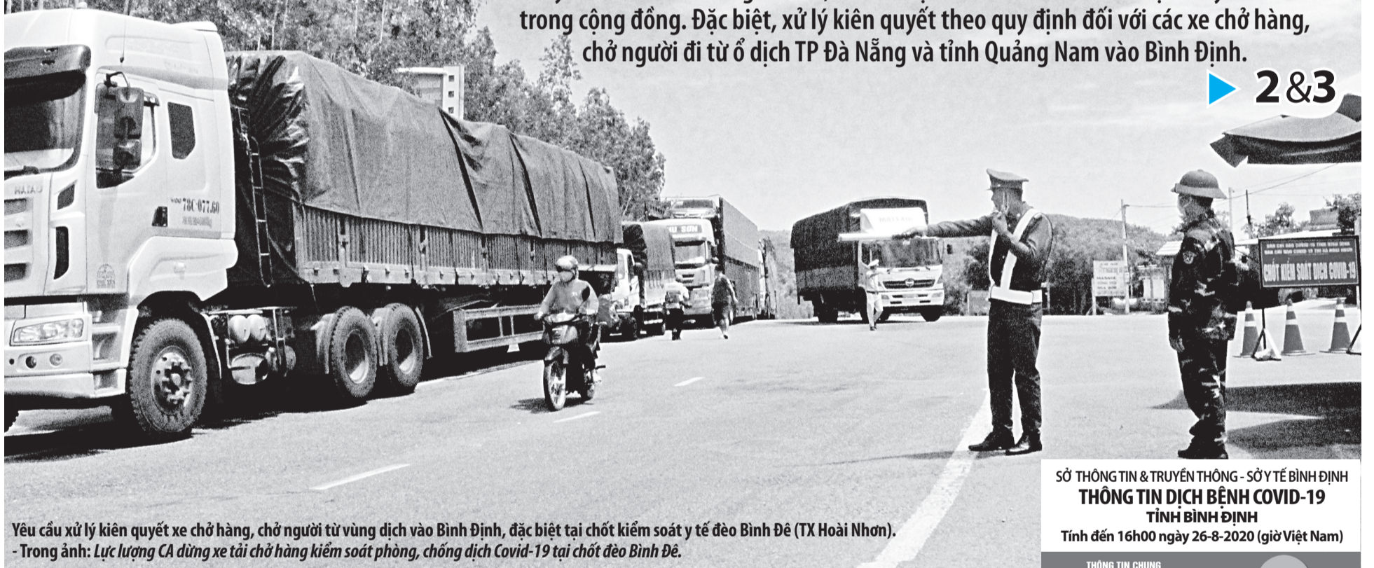
Yêu cầu xử lý kiên quyết xe chở hàng, chở người từ vùng dịch vào Bình Định, đặc biệt tại chốt kiểm soát y tế đèo Bình Đê (TX Hoài Nhơn). - Trong ảnh: Lực lượng CA dừng xe tải chở hàng kiểm soát phòng, chống dịch Covid-19 tại chốt đèo Bình Đê.

SỞ THÔNG TIN & TRUYỀN THÔNG - SỞ Y TẾ BÌNH ĐỊNH THÔNG TIN DỊCH BỆNH COVID-19 TỈNH BÌNH ĐỊNH Tính đến 16h00 ngày 26-8-2020 (giờ Việt Nam)