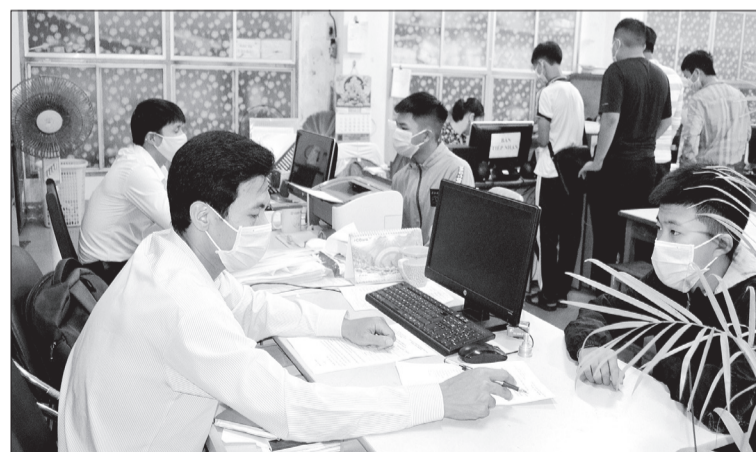
Sinh viên hệ trung cấp khóa mới làm thủ tục nhập học tại Trường CĐ Kỹ thuật Công nghệ Quy Nhơn.

Tính đến ngày 25.8, Trường CĐ Kỹ thuật Công nghệ Quy Nhơn đã tiếp nhận khoảng 600 hồ sơ đăng ký nhập học. Trong đó, hơn 560 hồ sơ trung cấp, 33 hồ sơ cao đẳng và 3 hồ sơ liên thông lên hệ cao đẳng. Thông tin từ phía nhà trường, số hồ sơ đăng ký nhập học đối với hệ cao đẳng sẽ rõ sau thời điểm biết kết quả thi tốt nghiệp THPT năm 2020.