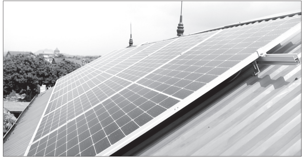
Nhiều hệ thống ĐMTMN được EVN ký hợp đồng mua bán và đấu nối vào lưới điện trong thời gian qua.

Tại địa bàn Tổng công ty Điện lực miền Trung (EVNCPC) quản lý, ĐMTMN phát triển mạnh và tập trung tại các tỉnh Quảng Nam, Bình Định, Phú Yên, Khánh Hòa và 4 tỉnh Tây Nguyên là Đắk Nông, Đắk Lắk, Kon Tum, Gia Lai gây nguy cơ quá tải lưới điện trung áp. Cụ thể, hiện có 519 dự án với tổng công suất 414,2 MWp ở các địa phương này đã đăng ký đấu nối