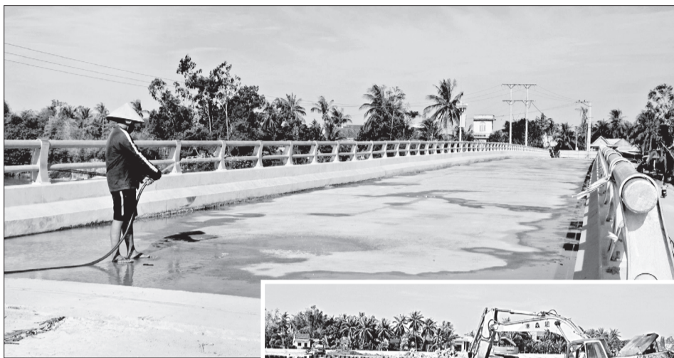
Cầu An Mỹ bắc qua sông La Tinh giữa xã Mỹ Chánh và Mỹ Cát (huyện Phù Mỹ) cơ bản hoàn thành.

Không chỉ lớn về quy mô, đập dâng Đức Phổ (xã Cát Minh, huyện Phù Cát) còn phức tạp về kỹ thuật, trong khi thời gian thi công ngắn, yêu cầu tiến độ rất căng thẳng. Công ty TNHH Xây dựng Tấn Thành đã huy động nguồn lực tập trung thi công công trình này. Đập dâng mới ở cùng vị trí đập dâng cũ, nhưng quy mô lớn hơn nhiều, dài 128 m bằng bê tông cốt thép, kết hợp đường giao thông rộng 4 m, giữa cầu xây dựng điểm tránh rộng 6,5 m. Theo thiết kế, đập có 10 cửa xả sâu ở giữa, mỗi cửa cao 3 m, rộng 5 m, vận hành bằng cửa van thép, đóng mở bằng máy vitme chạy điện kết hợp quay tay; hai bên đập bố trí 10 khoang tràn tự do.