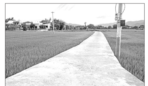
Một tuyến đường ngõ xóm thôn Thanh Quang, xã Phước Thắng vừa đúc bê tông, đưa vào sử dụng.

Như vậy, từ năm 2015 đến nay toàn xã đã thực hiện đúc bê