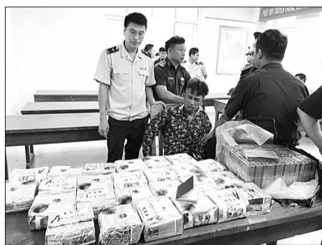
Cơ quan chức năng bắt giữ đối tượng cùng tang vật.

Phó Thủ tướng Thường trực Trương Hòa Bình - Trưởng Ban Chỉ đạo 389 quốc gia biểu dương lực lượng Bộ đội biên phòng, Hải quan, CA tỉnh Hà Tĩnh và các lực lượng liên quan đã triệt phá thành công đường dây vận chuyển trái phép ma túy từ Lào về Việt Nam qua địa bàn tỉnh Hà Tĩnh.