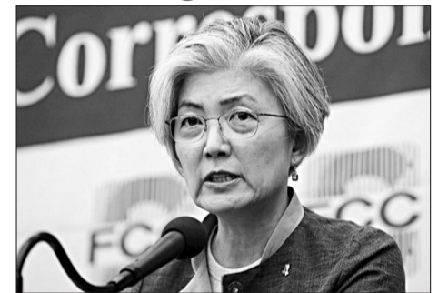
Ngoại trưởng Hàn Quốc Kang Kyung-wha.