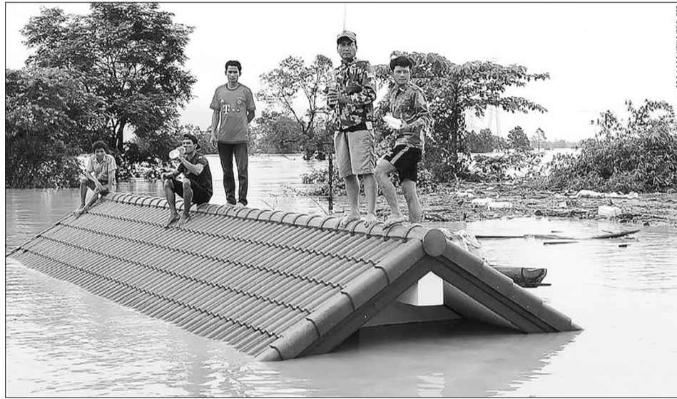
Trận lụt do vỡ đập thủy điện ở Lào đã khiến hàng ngàn hộ dân bị ảnh hưởng.