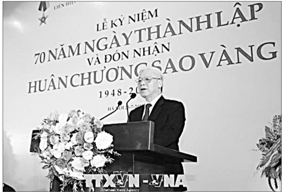
Tổng Bí thư Nguyễn Phú Trọng phát biểu tại Lễ kỷ niệm.

Phát biểu chúc mừng tại buổi lễ, Tổng Bí thư Nguyễn Phú Trọng khẳng định và ghi nhận những đóng góp của đội ngũ văn nghệ sĩ - chiến sĩ Việt Nam vào sự nghiệp kiến tạo nền văn học, nghệ thuật vì đất nước và nhân dân, vì tiến bộ xã hội