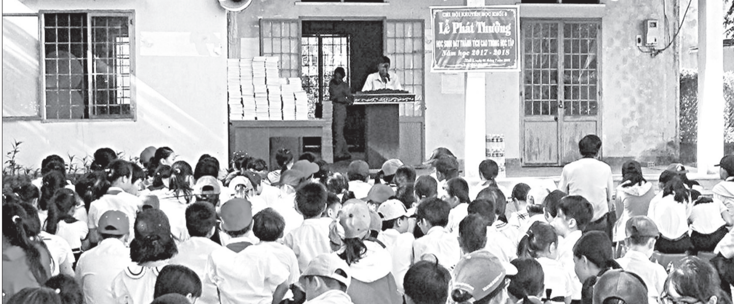
Chi hội Khuyến học khối 5 thị trấn Bông Sơn tổ chức trao thưởng cho học sinh đạt thành tích tốt trong học tập niên khóa 2017-2018 với sự chứng kiến của đông đảo người dân.

Những năm qua, nhờ làm tốt công tác xây dựng tổ chức hội, Hội Khuyến học thị trấn Bông Sơn, huyện Hoài Nhơn đã vận động xây dựng quỹ khuyến học kịp thời, thúc đẩy phong trào khuyến học khuyến tài trên địa bàn ngày càng phát triển.