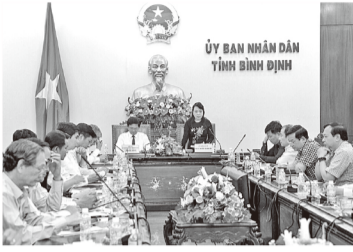
ỦY BAN NHÂN DÂN TỈNH BÌNH ĐỊNH

ĐƯA NGHỊ QUYẾT ĐẠI HỘI ĐẢNG VÀO CUỘC SỐNG