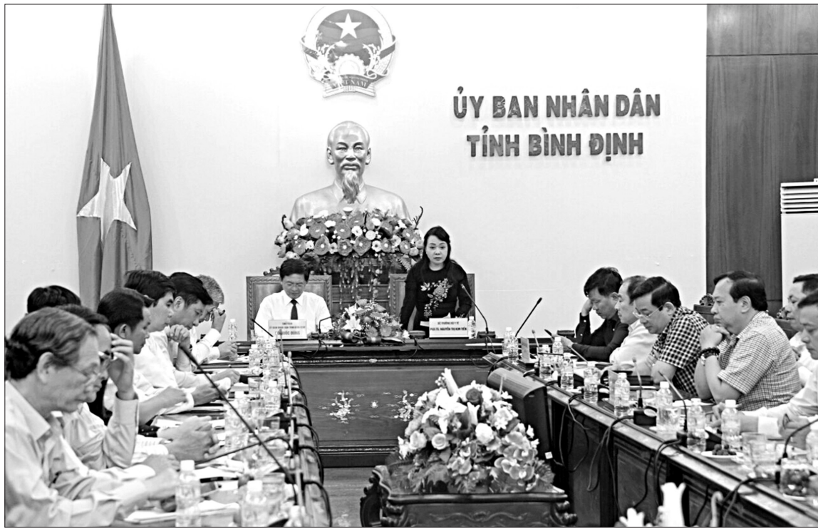
Bộ trưởng Bộ Y tế Nguyễn Thị Kim Tiến (người đứng) trong buổi làm việc với UBND tỉnh.