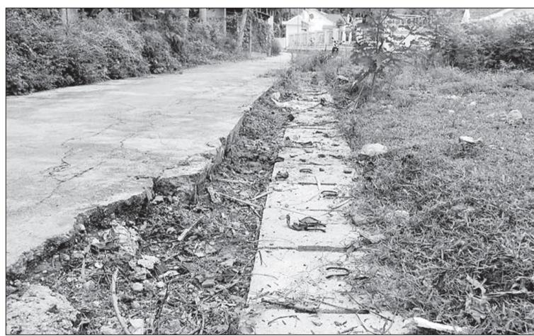
Hệ thống cống thoát nước tại khu dân cư Hưng Nhượng thi công dở dang dẫn đến gây ngập nhà dân mỗi khi trời mưa lớn.

Tuy nhiên, do kinh phí hạn chế nên chủ đầu tư mới xây dựng hệ thống cống thoát nước được 150m thì dừng lại. Thực trạng này khiến cống không đảm bảo việc thoát nước thải sinh hoạt khu dân cư; cũng như lượng nước mỗi khi trời mưa