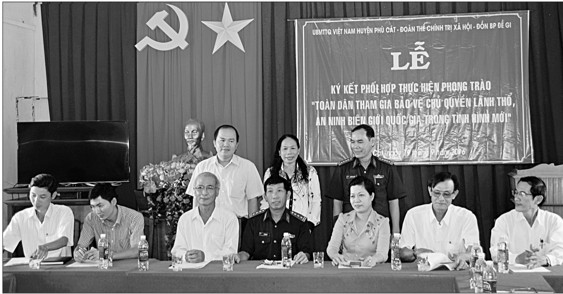
Ủy ban MTTQ Việt Nam huyện Phù Cát, các đoàn thể chính trị - xã hội và Đồn Biên phòng Đệ Gi ký kết phối hợp thực hiện phong trào "Toàn dân tham gia bảo vệ chủ quyền lãnh thổ, an ninh biên giới quốc gia trong tình hình mới".

Tuy nhiên, quá trình triển khai thực hiện Nghị định 169/2013/NĐ-CP trên thực tế đã bộc lộ nhiều khó khăn, vướng