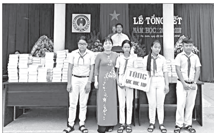
Trường THCS Bùi Thị Xuân trao phần thưởng cho lớp học có Góc học tập xuất sắc.