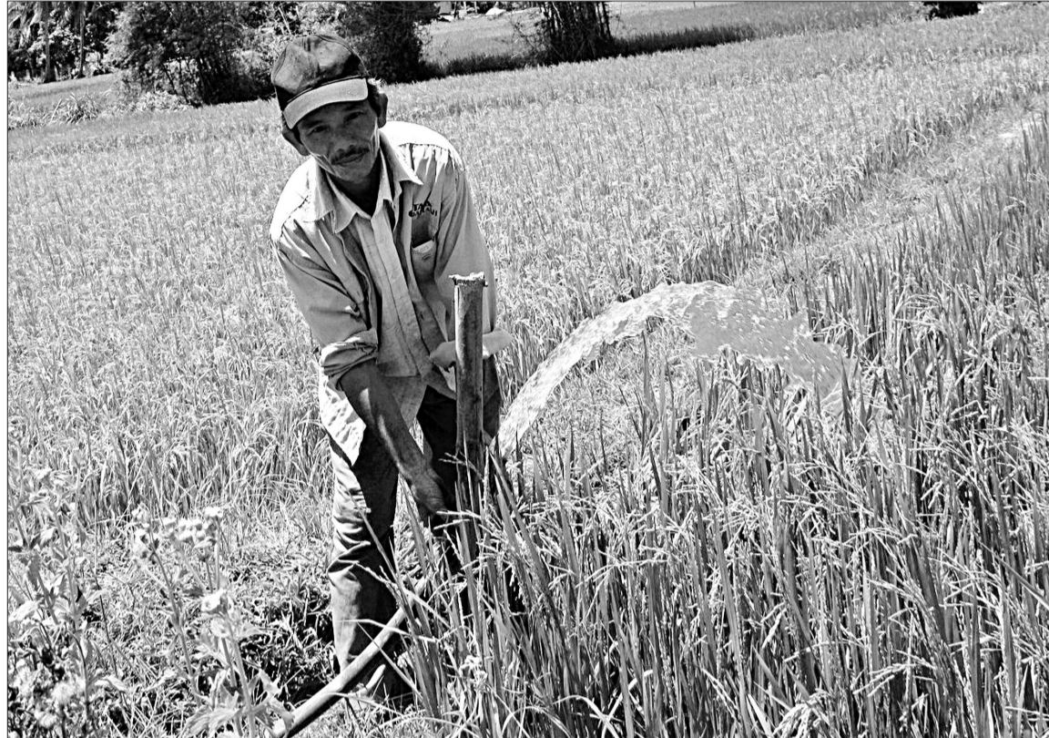
Nông dân xã Mỹ Phong (Phù Mỹ) khoan giếng lấy nước ngầm tưới lúa.