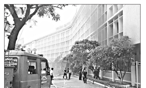
Cảnh sát PCCC khống chế ngọn lửa.

Nguyên nhân ban đầu của vụ cháy được xác định do chập điện tại hệ thống điều hòa. (Theo VOV.VN)