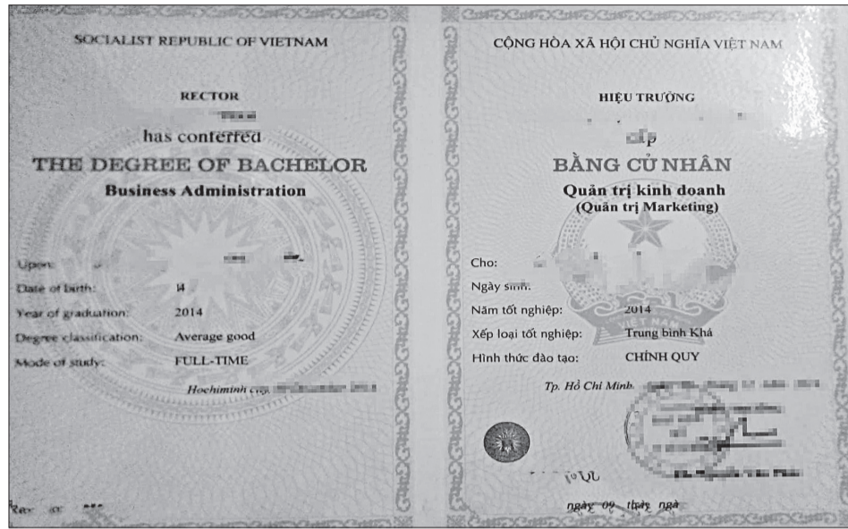
Một bằng đại học mua qua dịch vụ làm bằng cấp giả nhìn không khác gì bằng thật nên rất khó phân biệt.