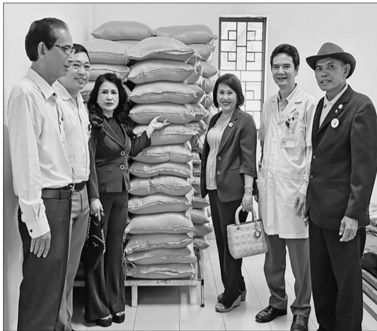
Các tổ chức, nhà hảo tâm chung tay hỗ trợ kinh phí, hiện vật cho Bếp ăn tình thương BVĐK Gia Lai.