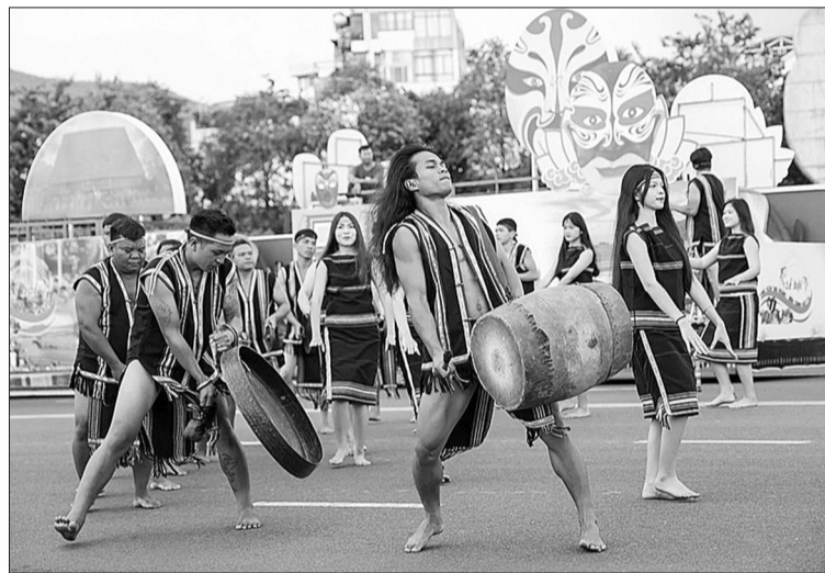
Nghệ nhân làng Pleiku Roh (phường Diên Hồng) trình diễn công chiêng trong Lễ hội đường phố với chủ đề "Sắc màu biển cả" tại Quảng trường Nguyễn Tất Thành (phường Quy Nhơn).