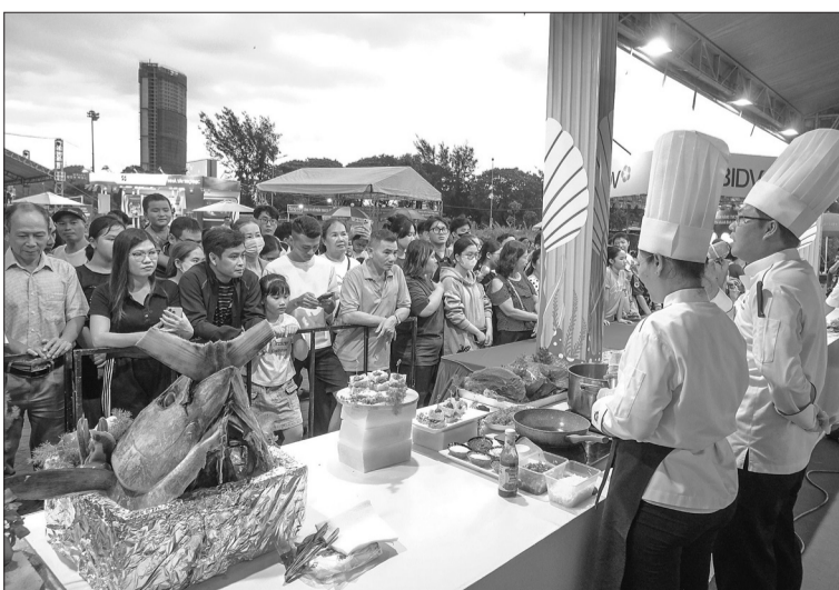
Chế biến các món ăn từ cá ngừ đại dương tại Lễ hội ẩm thực Món ngon từ đất bazan và biển thu hút người dân và du khách.

Gia Lai hôm nay với sức mạnh kết nối từ Đông sang Tây đã sẵn sàng cất cánh, mang trong mình khát vọng vươn lên, bay xa, hội nhập và vươn tầm thế giới. NHÓM PHÓNG VIÊN