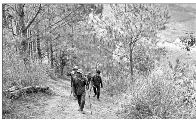
Để bảo vệ tốt diện tích rừng được giao, các cộng đồng, tổ nhận khoán đã chia nhóm thay phiên nhau đi tuần tra, kiểm soát rừng.