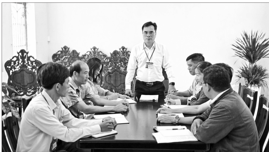
Đảng ủy xã Biển Hồ họp triển khai nhiệm vụ về nâng cao chất lượng công tác xây dựng Đảng ở cơ sở.

Để nghị quyết sớm đi vào cuộc sống, các chi bộ đều xây dựng kế hoạch cụ thể, gắn với chức trách, nhiệm vụ của từng đảng viên.