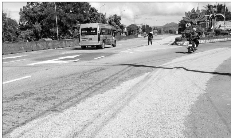
Người dân phường Bồng Sơn biến một phần mặt đường tuyến Quốc lộ 1 thành sân phơi lúa.

Theo Phòng CSGT (CA tỉnh), hành vi lấy lòng đường làm nơi phơi nông sản là vi phạm pháp luật, cụ thể là vi phạm quy định về sử dụng đất dành cho giao thông, bởi đây là khu vực dành riêng cho phương tiện lưu thông an toàn.