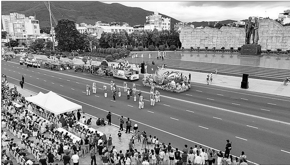
Lễ hội đường phố với chủ đề "Sắc màu biển cả" làm cho không gian Quảng trường Nguyễn Tất Thành thêm sinh động, tươi mới.

(GL) - Từ ngày 29.8 - 1.9, Lễ hội Tinh hoa Đại ngàn - Biển xanh hội tụ năm 2025 với chủ đề "Khát vọng Biển xanh - Đại ngàn tỏa sáng", diễn ra tại phố biển Quy Nhơn đã mang đến chuỗi hoạt động văn hóa - nghệ thuật phong phú, thu hút đông đảo người dân và du khách, góp phần quảng bá hình ảnh, tiềm năng du lịch của tỉnh Gia Lai.