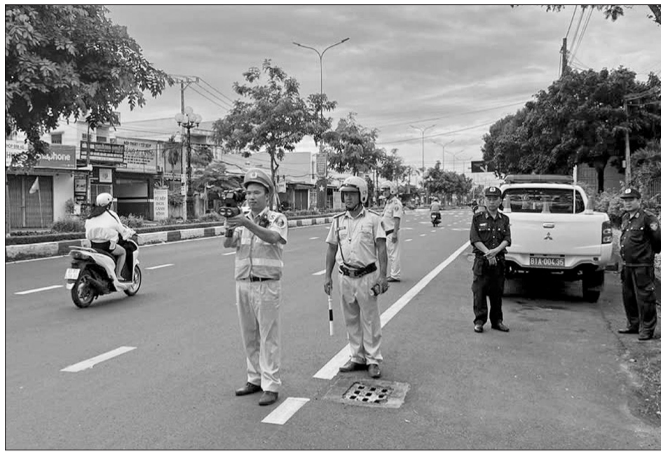
Lực lượng Cảnh sát giao thông kiểm tra tốc độ trên tuyến Quốc lộ 25 (đoạn đường Hồ Chí Minh, xã Chư Sê).

mỗi ngày Đội Cảnh sát đường thủy bố trí nhiều tổ công tác kiểm soát ngay tại bến bãi các khu du lịch biển đảo như Kỳ Co, Hòn Khô (phường Quy Nhơn Đông), Nhơn Châu để nhắc nhở, xử lý nghiêm phương tiện chở quá số người, thiếu áo phao hoặc người điều khiển không đủ điều kiện.