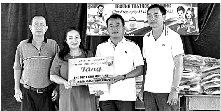
Tặng thẻ BHYT cho học sinh có hoàn cảnh khó khăn ở Trường Tiểu học và THCS An Trung (xã Chư Krey).