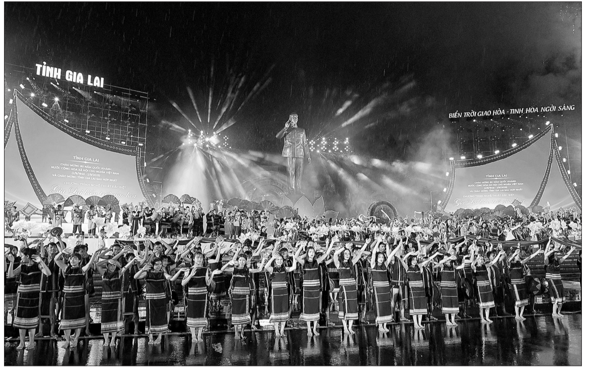
Tiết mục Hào khí Việt Nam tại chương trình nghệ thuật Gia Lai: Biển trời giao hòa, tinh hoa ngời sáng.

Sau chương trình nghệ thuật, màn pháo hoa rực rỡ bùng tỏa trên nền nhạc của các ca khúc: Hào khí Việt Nam, Như có Bác Hồ trong ngày vui đại thắng . Từ mạch nguồn văn hóa ngàn đời, Gia Lai đang căng tràn sức sống mới, mở rộng cánh cửa hội nhập, vươn xa trong nhịp điệu phát triển không ngừng của đất nước và thế giới.