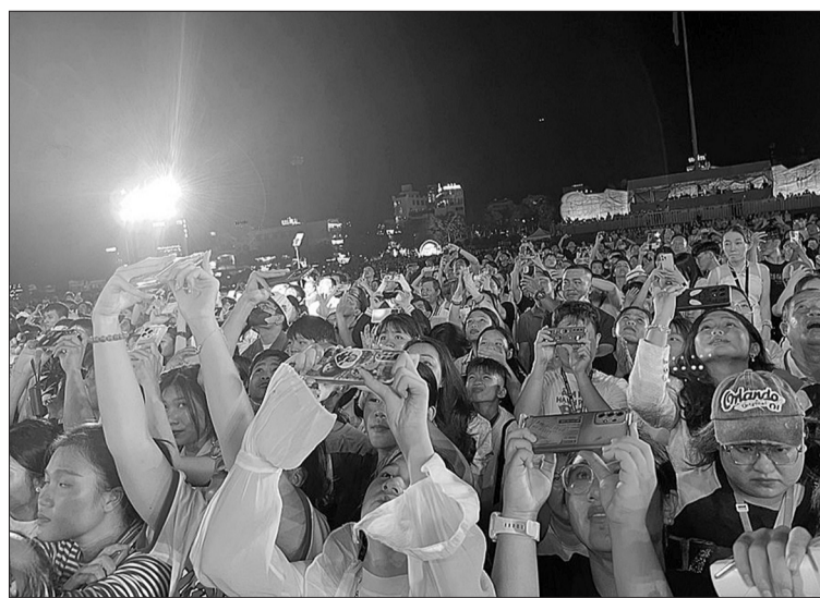
Khán giả thích thú ghi lại những khoảnh khắc đẹp của drone tại Lễ hội ánh sáng năm 2025.