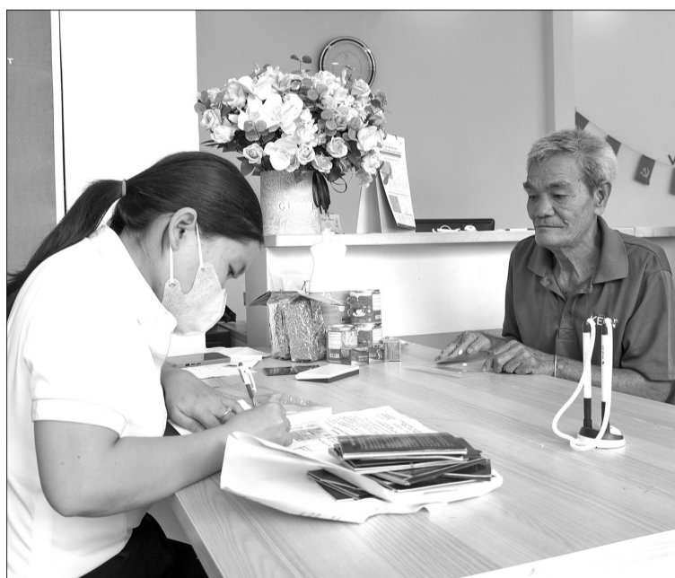
Người cao tuổi phường Bình Định nhận trợ cấp hưu trí xã hội cuối tháng 8.2025 - kỳ chi trả đầu tiên.

Từng nghĩ phải 80 tuổi thì mới được nhận chế độ trợ cấp dành cho người cao tuổi nên